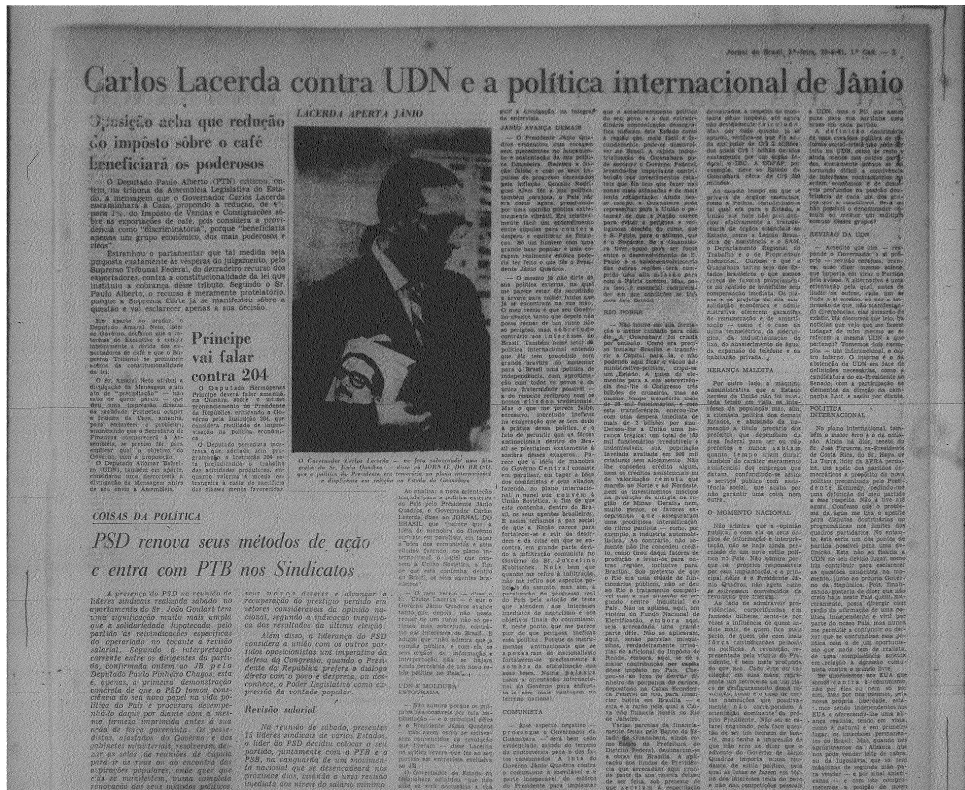
Figura 4 Jornal do Brasil, junho de 1961