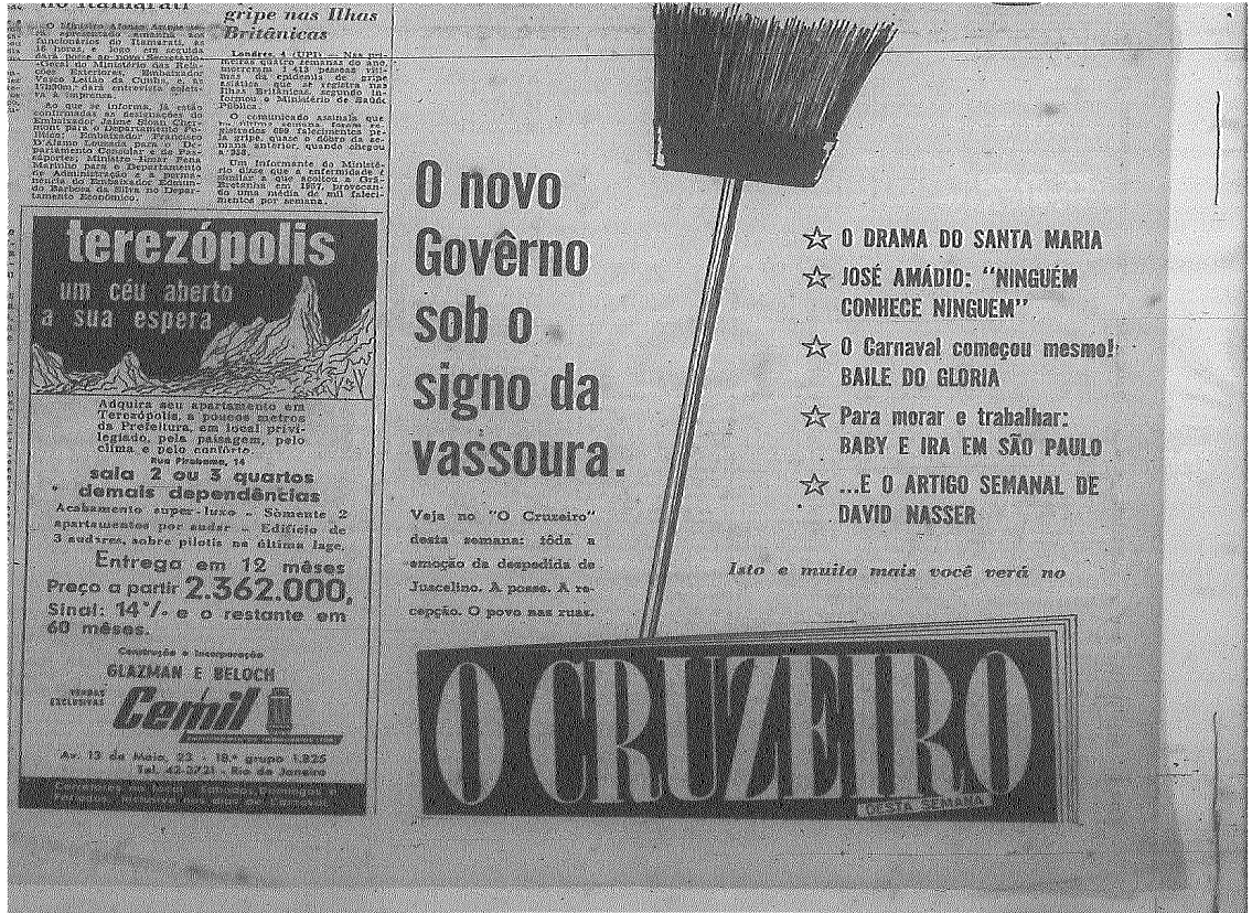
Figura 1 Propaganda da Revista O Cruzeiro mostra o símbolo de Jânio