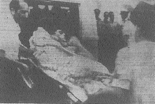
Desembarque de fuzilas em Luanda, Capital de Angola. Militares de países aliados do regime do sulista, por via aérea, em cumprimento de operação militar