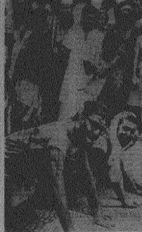
O trote da Faculdade de Medicina foi o primeiro trote em homenagem ao Rio de Janeiro realizado ontem, numa homenagem ao Rio de Janeiro.