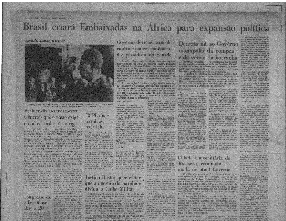
Figura 3 Jornal do Brasil, 03/04/1961