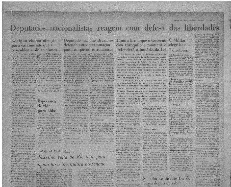
Figura 5 Jornal do Brasil, junho de 1961