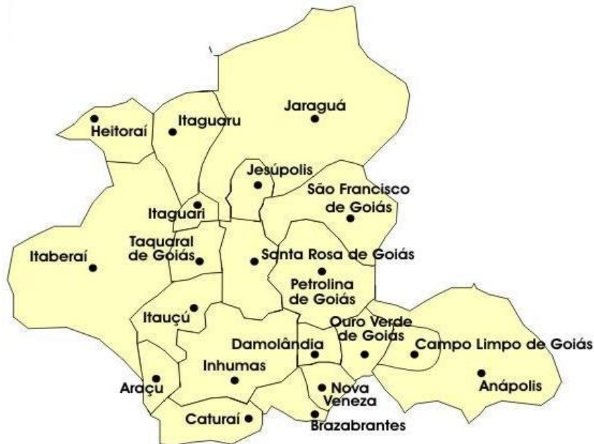
Figura 2: Mapa da microrregião de Anápolis, Goiás.