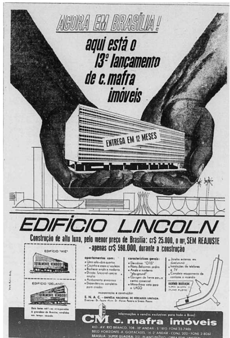
Figura 4 - Anúncio de venda de apartamentos na Asa Sul do Plano Piloto.