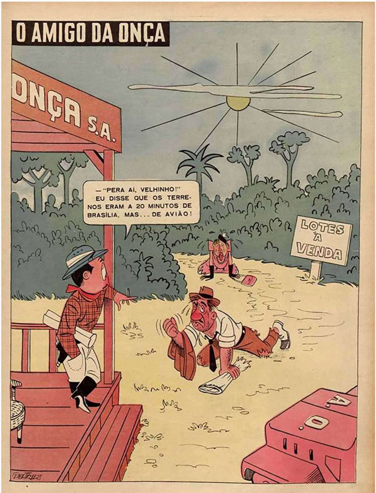
Figura 7 – Charge d’O Amigo da Onça sobre a venda de lotes em Brasília.