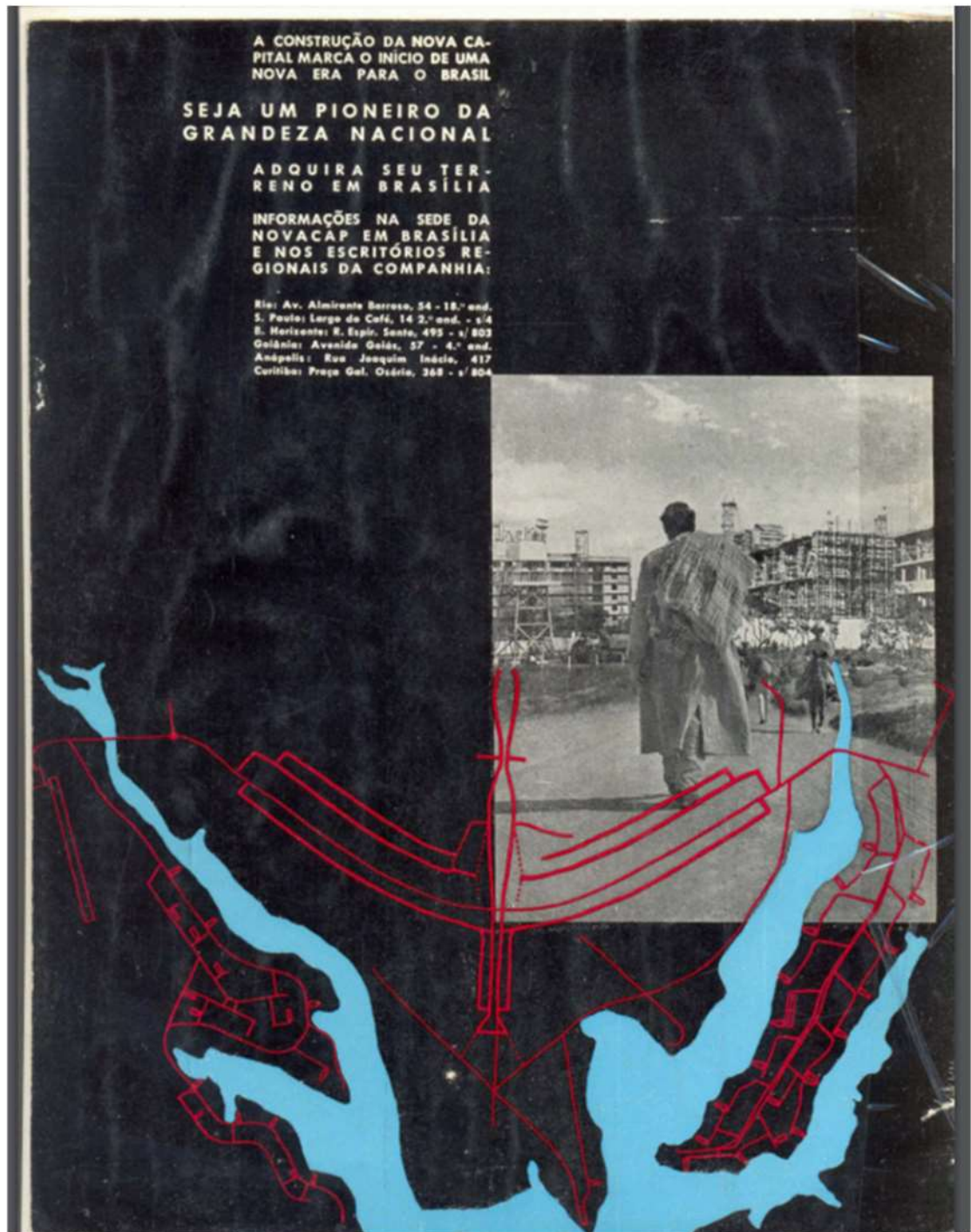
Figura 10 – Anúncio de terrenos em Brasília veiculado pela Novacap.

“em frente à igreja de Nossa Sra. de Fátima”, ou ainda supostas qualidades da vizinhança: “junto às residências de deputados e senadores” (Terreno em Brasília, 1959, p. 13). Apartamentos situados nas quadras 100 da Asa Sul (a oeste do Eixo Rodoviário-residencial) foram propagandeados como tendo “magnífica vista para o LAGO [Paranoá]” (Figura 4). No entanto, essa vista, ainda que fosse possível naquele momento e a partir daquela distância, seria parcial e logo viria ser entrecoberta por construções posteriores.