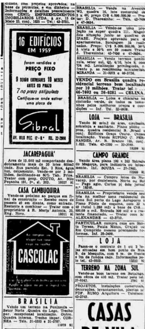
Figura 3 - Anúncios variados relativos a imóveis em Brasília.