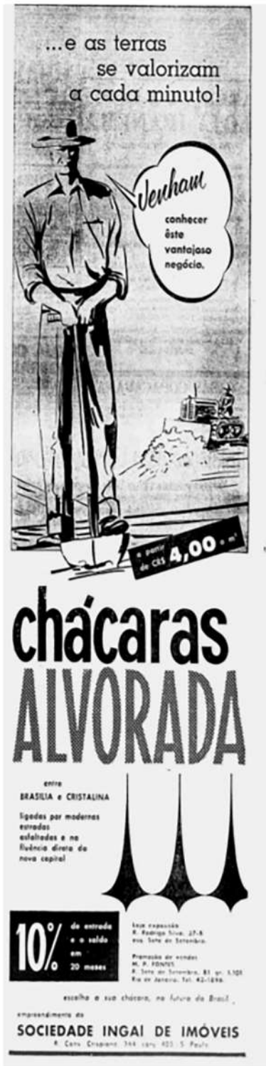
Figura 8 – Anúncio de lotes nas Chácaras Alvorada, em Goiás.