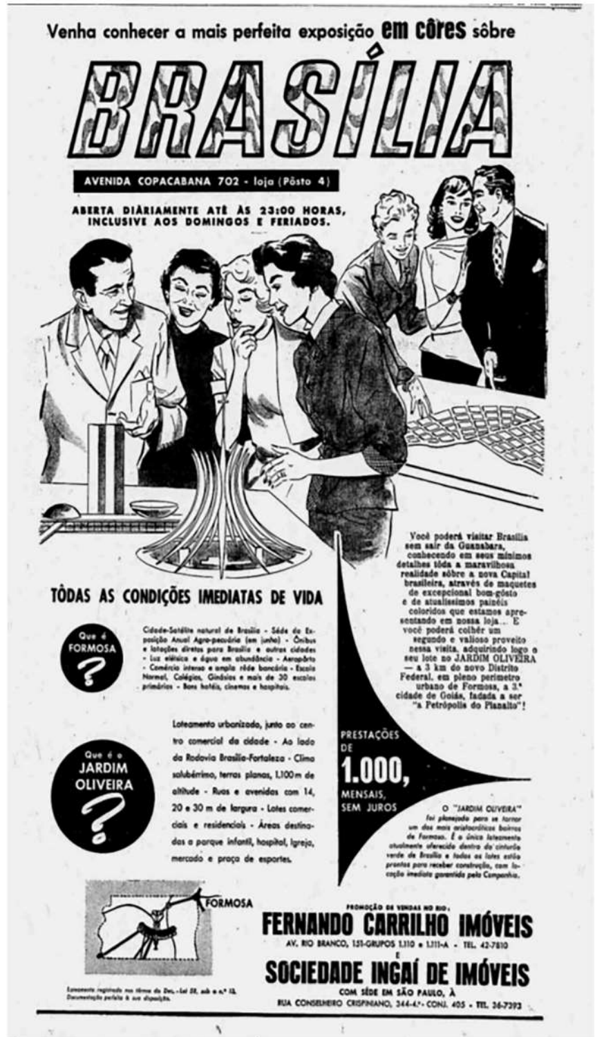
Figura 9 – Anúncio do loteamento Jardim Oliveira, em Formosa, Goiás.

A publicidade de loteamentos situados em áreas externas ao DF frequentemente contou com imagens da arquitetura monumental de Brasília. No caso do já citado Jardim Oliveira, em Goiás, um recurso extra, similar a estratégias de divulgação da própria Novacap, foi um stand de vendas, no Rio de Janeiro, tendo como atrativo “maquetes de excepcional bom gosto”