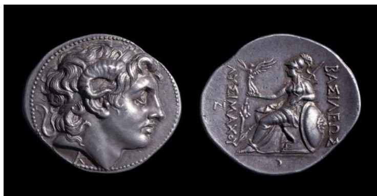
Figura 1- Tetradracma de prata de Lisímaco, emitida entre 308-281 AEC

As fontes sobre Alexandre são de modo geral literárias. Papiros e inscrições são escassos, sendo a numismática a única fonte material realmente rica e abundante, ainda que póstuma (GREEN 2007, p. 20). Como veremos mais profundamente no capítulo 2, a autopromoção de Alexandre foi uma medida de propaganda pessoal empregada pelo rei, que desejava substituir o sistema monetário local por moedas próprias, com várias delas chegando até a atualidade 2 . Além das moedas contemporâneas a Alexandre, seguiu-se também moedas cunhadas por seus sucessores, já que o uso de moedas com a cabeça de Alexandre transmitia a ideia de legitimidade de um sucessor herdeiro. Essa tática foi usada por Ptolomeu, Lisímaco e outros (GREEN, 2014, p. 31).