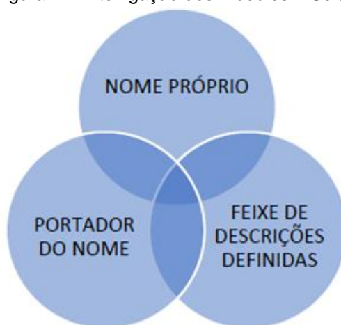
Figura 1 - Interligação dos módulos – Seide

são todos nomes e podem exercer, no sintagma nominal, a função de núcleo, de sujeito ou de objeto, por exemplo. Outro fator relevante e muito importante para os nossos estudos, levando em conta, sobretudo, o aspecto da neologia, é o de que, nos processos de formação de palavras, uma das categorias lexicais mais envolvidas é o substantivo. Mas, apesar desses aspectos, é preciso ressaltar que, em relação ao nome próprio de pessoa, a ativação mental é diferente. Concebemos nomes próprios de forma particularizada. Compreender um nome comum como sendo próprio implica não só nas questões pautadas na forma da palavra. É preciso acrescentar ao debate argumentos cognitivos, e é isso o que Seide (2021) faz ao apresentar uma proposta de classificação de nome próprio implicada em amplas questões. A autora considera que nós, seres humanos, armazenamos o nome próprio de forma interligada, associando o nome próprio ao seu portador e a um feixe de descrições definidas. Propõe que há a interligação de módulos mentais para conceituar nomes próprios como mencionado na figura abaixo: