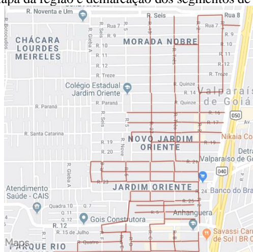
Figura 1: Mapa da região e demarcação dos segmentos de via avaliados

Normalmente, um SGPU é auxiliado por um Sistema de Informação Geográfica com aplicações em Transportes (SIG-T). Como a Prefeitura Municipal ainda não possui uma base de dados georreferenciada, foi utilizado um mapa disponível na internet para marcar os segmentos de pista a serem avaliados. Em um SIG-T são definidos os “nós”, que são os pontos de cruzamento entre duas vias. O comprimento entre dois nós consecutivos é definido como sendo um segmento de pista. O mesmo conceito foi aplicado nesta pesquisa.