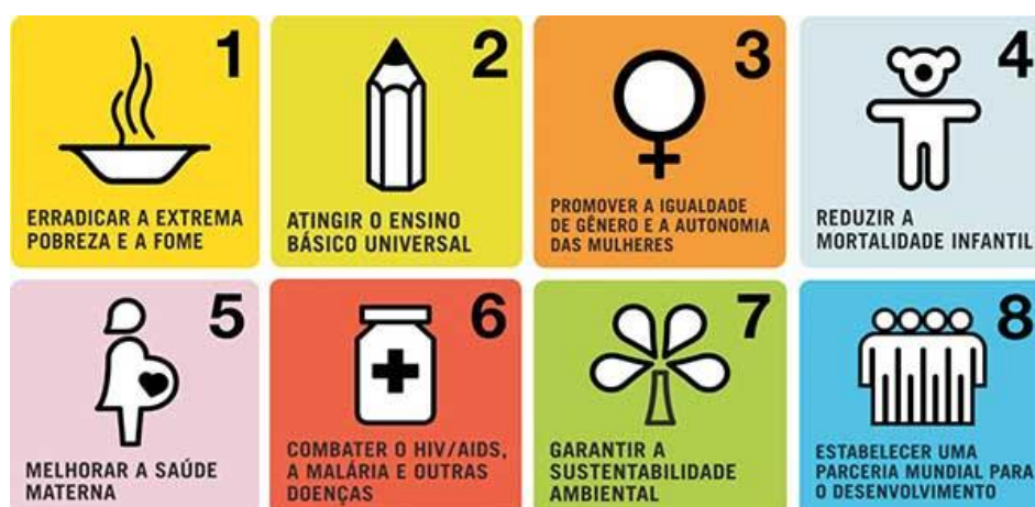
Figura 3 – Objetivos de Desenvolvimento do Milênio