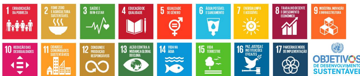
Figura 2 – Objetivos de Desenvolvimento Sustentável

Em um paralelo com a Agenda 2030 para o Desenvolvimento Sustentável (80) – por essa representar atualmente o acontecimento político internacional de maior relevância para a temática ambiental, assunto que será aprofundado adiante – ver-se-á que Potter, em seu tempo, já alertava para a necessidade de uma bioética planetária, com uma agenda crítica de trabalhos para enfrentar os imensos desafios do nosso tempo atual. Trata-se de uma ação mundial coordenada que tem como objetivo alcançar 17 Objetivos de Desenvolvimento Sustentável (ODS), disponíveis na figura abaixo, de forma a erradicar a pobreza e promover vida digna para todos, dentro dos limites do planeta, e que, portanto, vai de encontro com as ideias sustentadas por Potter, já que o autor alertava que problemas com a pobreza, consumo desenfreado, mudança global do clima são os responsáveis pelo risco à sobrevivência da espécie humana.