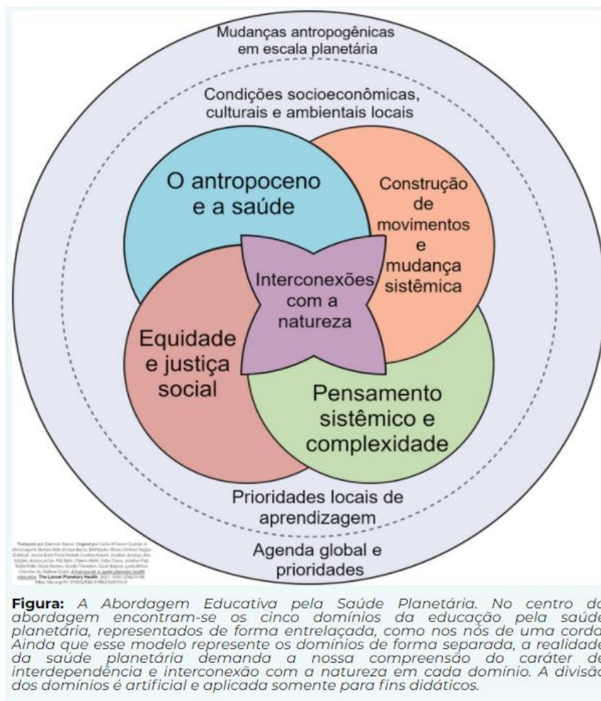
Figura 5 – Abordagem Educativa pela Saúde Planetária

domínios fundamentais se acredita envolver a essência dos conhecimentos, valores e práticas em saúde planetária defendidas nessa dissertação. A figura abaixo foi traduzida e adaptada por Extensão Natural (262) e representa, em síntese, as ideias aqui expostas.