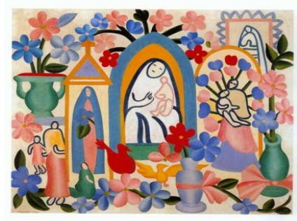
Tarsila do Amaral, Religião Brasileira , 1927.