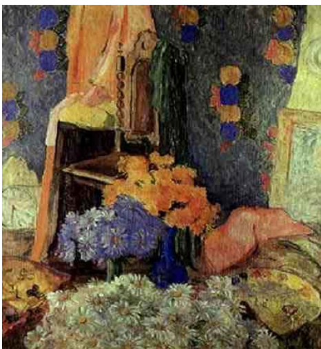
(Margaridas de Mário de Andrade, Tarsila do Amaral)