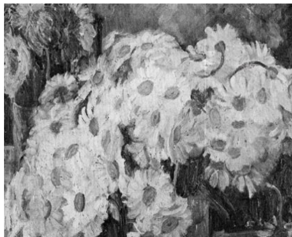
(As margaridas de Mário, Anita Malfatti).