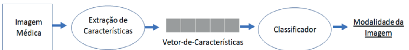
Figura 1. Metodologia para classificação de imagens

A Figura 1 ilustra a metodologia que será abordada neste trabalho para desenvolver um sistema classificador de imagens: primeiro passo é necessário extrair as características visuais da imagem médica. Essa extração irá gerar um vetor-de-características que, por sua vez, será utilizado para o treinamento de alguma técnica de classificação supervisionada.