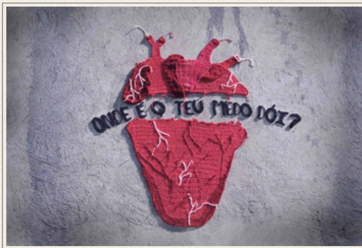
Figura 1 - Visceral