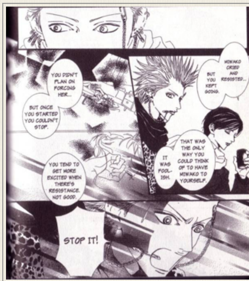
Paradise Kiss , vol. 5, cap. 44

entre os dois rapazes é revelado que o namoro do casal começou com um estupro. Tudo isso acontece no último volume da série, o quinto, e foi igualmente uma surpresa para os leitores.