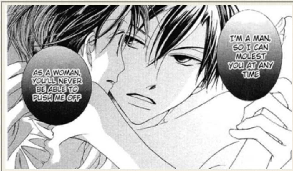
Ouran Host Club , vol. 3, cap. 9

A sequência da violência “simulada” ocupa várias páginas, com a menina encurralada em um quarto com o rapaz que lhe diz que se ela ficou sozinha com ele é porque desejava que algo lhe acontecesse. Tudo culmina com a ameaça “Eu sou um homem, então, eu posso molestar você quando eu quiser. Como mulher, você nunca será capaz de escapar de mim” 7 . Não é uma cena engraçada, ainda que a autora tente introduzir uma piada no final da sequência. Trata-se, mais uma vez, de um reforço pedagógico. Colégio Ouran Host Club e Ao Haru Ride não foram publicados na mesma antologia, mas são para o mesmo público adolescente.