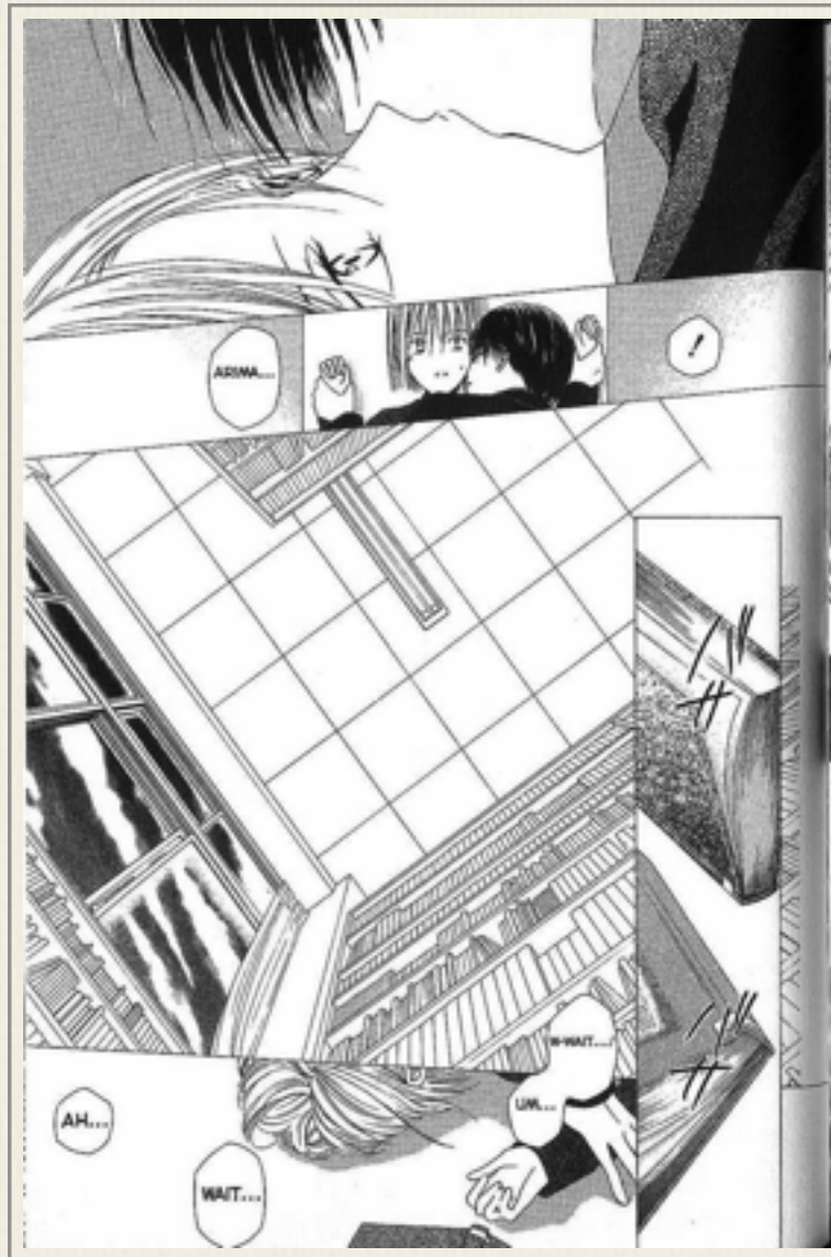
Karekano , vol. 15, cap. 72

volume 12 da série, no entanto, Arima começou a enfrentar uma forte crise familiar e seu psicológico ficou abalado. A namorada, Miyazawa, decidiu dar-lhe suporte, insistiu para manter o romance e ocorreu algo que a maioria dos leitores da série não esperava, no volume 15, o rapaz violenta a namorada.