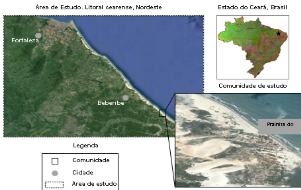
Figura 1. Mapa de localização da comunidade da Prainha do Canto Verde, no município de Beberibe, Estado do Ceará, Região Nordeste do Brasil.