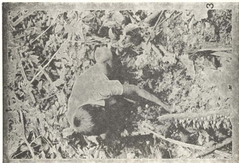
Figura 2 — Quebrando babaçu para obtenção de larvas de bruquídeos. Figura 3 — Larva de Rhynchophorus palmarum em fragmentos de tronco apodrecido de jaracatiá.