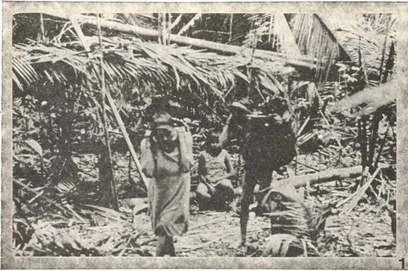
Figura 1 — Coleta de cocos de babaçu em acampamento.

serem fritas. Os kadeg" são fritos em sua própria gordura. As larvas fritas são também apreciadas como acompanhamento de milho assado ou de "pipocas" ("meeg-ây"). As larvas cruas são amassadas no pilão e misturadas a um tipo de mingau de milho verde denominado "malôhba". Dessa forma, as larvas de gosto adocicado proporcionam a este mingau um sabor característico, sendo muito apreciado pelos Suruí.