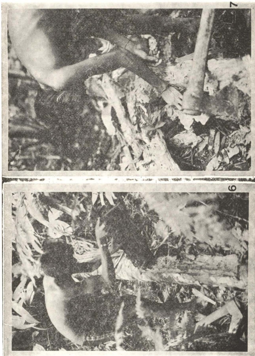
Figuras 6 e 7 — Rachando o estipe de inajá para a obtenção e coleta de Rhina barbitrostris .