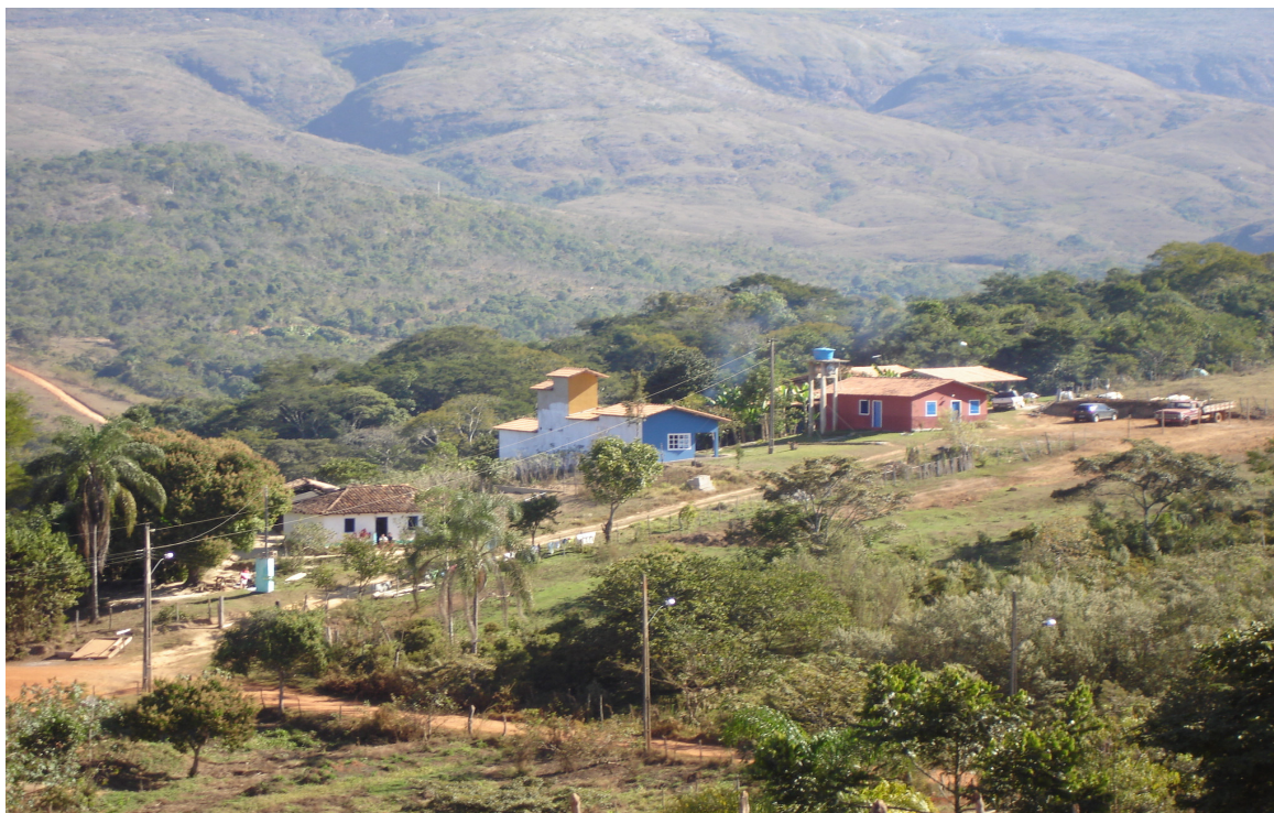
Fig. 5.42: Mudanças recentes na paisagem (à direita da entrada do Povoado de Tabuleiro). (2006)