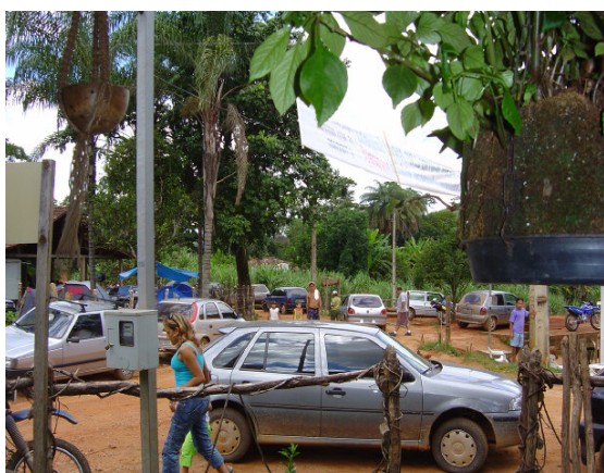
Fig. 5.30: Acúmulo de carros no Povoado. (2004)

Quanto ao uso de bebidas, é um tema que gera controvérsias, já que algumas pessoas afirmam que antes da criação do Parque os tabuleirenses bebiam mais. De qualquer forma, supõe-se que o consumo de bebidas alcoólicas entre os habitantes tradicionais seja alto, baseando-se na frequência com que se vêem bêbados perambulando pelas ruas. Porém, o que mais os irrita é o acúmulo de carros (falta estacionamentos) que dependendo da demanda, interdita as ruas que são na sua totalidade muito estreitas (Figuras 5.30 a 5.32).