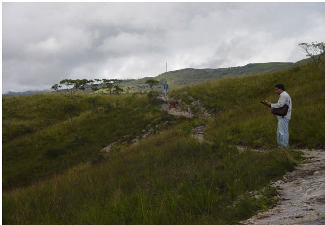
Fig. 5.43: Registro do início da implementação das obras da Trilha do Parque do Tabuleiro.

Para atingir os objetivos do Plano Diretor, o Poder Público Municipal, através da Secretaria do Meio Ambiente e Turismo (Semat), tem desenvolvido projetos tais como, a conclusão do Terminal Rodoviário na sede do município, os projetos da Sinalização Turística e do Pórtico Turístico, que estão em andamento, assim como a implantação da sede do Parque Municipal Ribeirão do Campo e o início do projeto de implementação de suas trilhas (Figura 5.43).