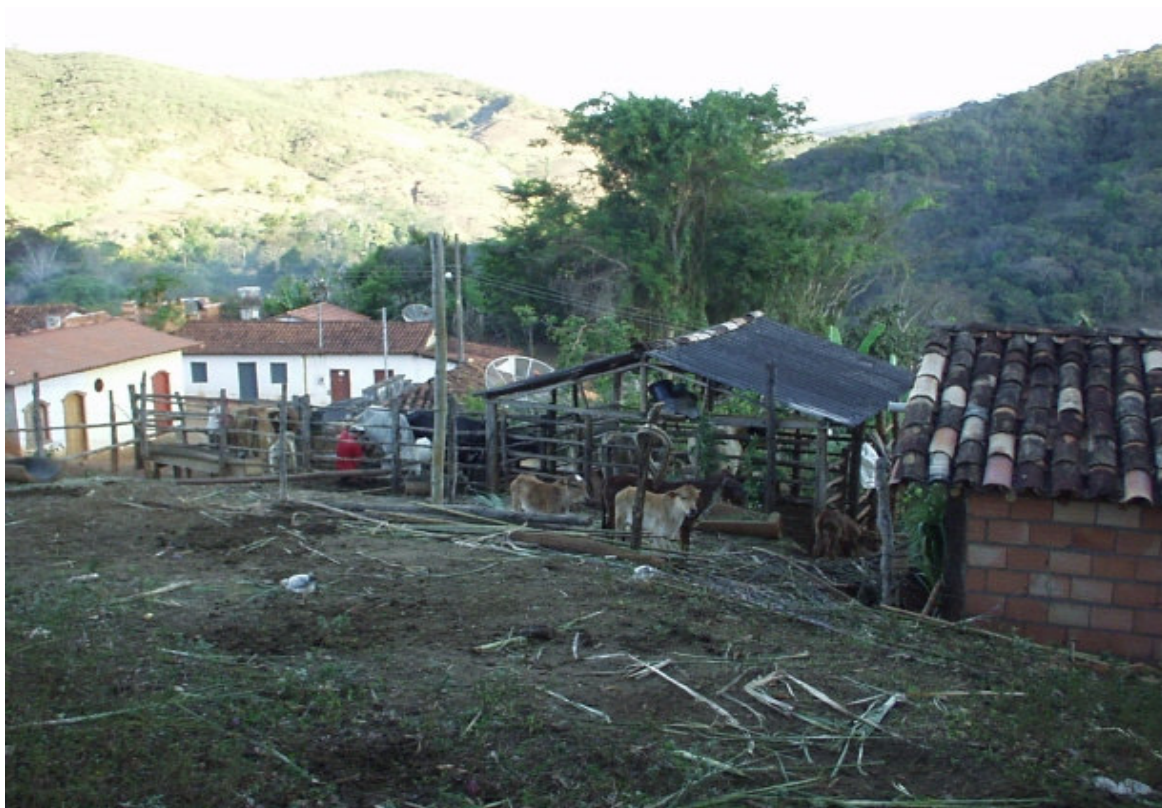
Fig. 5.35: Aspecto rural do Povoado de Tabuleiro, curral para 20 animais ao lado da igreja. (2006)

O povoado, que era tranqüilo, já registra ocorrências de roubos, arrombamento de residências e comércio, que embora em número reduzido, não deixa de trazer preocupação para a comunidade, quanto à sua segurança.