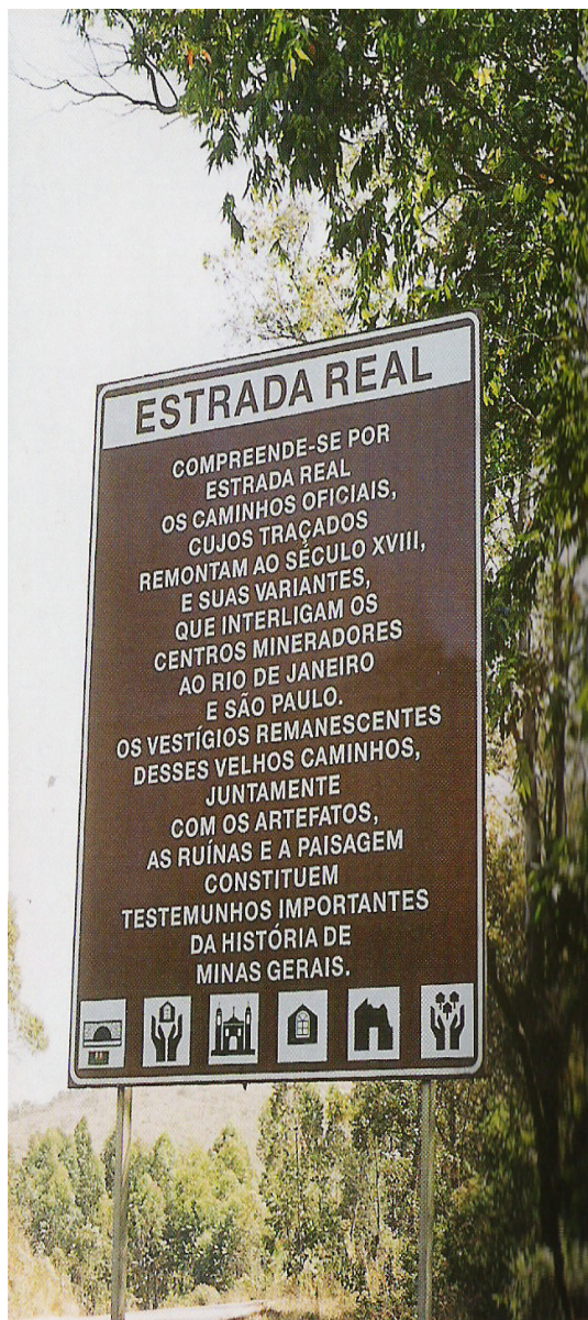
Fig. 5.40 e 5.41: O Povoado e o Parque do Tabuleiro no circuito Estrada Real e placa explicando o que é Estrada Real e sua importância para a história de Minas Gerais. Fonte do mapa: Prefeitura Municipal de Itabira – MG. Adaptação da autora. Foto: Dorothy Safe Carneiro. (2003)

Todas essas políticas desenvolvidas no âmbito nacional conjugam-se com as do âmbito estadual e municipal e vêm repercutindo no aumento da demanda de turistas pelas atrações do município de Conceição do Mato Dentro, principalmente pelo Parque Natural Ribeirão do Campo e pelo Povoado do Tabuleiro, que a cada dia incorpora novos elementos à sua paisagem (Figura 5.42).