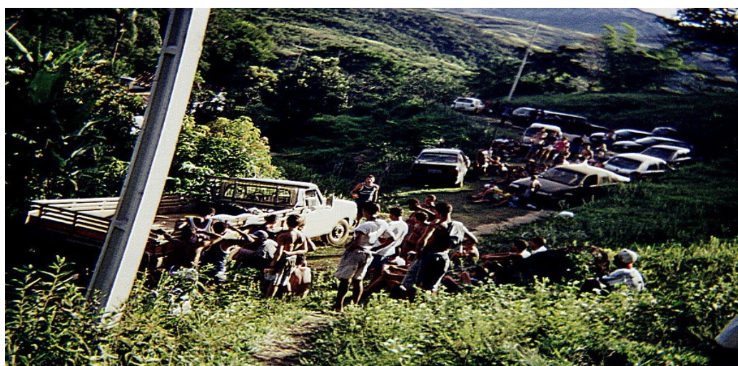
Fig. 5.32: Trânsito interrompido sobre a ponte do Rio Preto, no caminho entre o Povoado e o Parque, em dia de grande movimento. (2003)