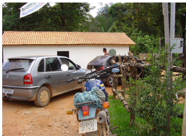
Fig. 5.31: Carros e motos obstruindo a passagem. (2004)