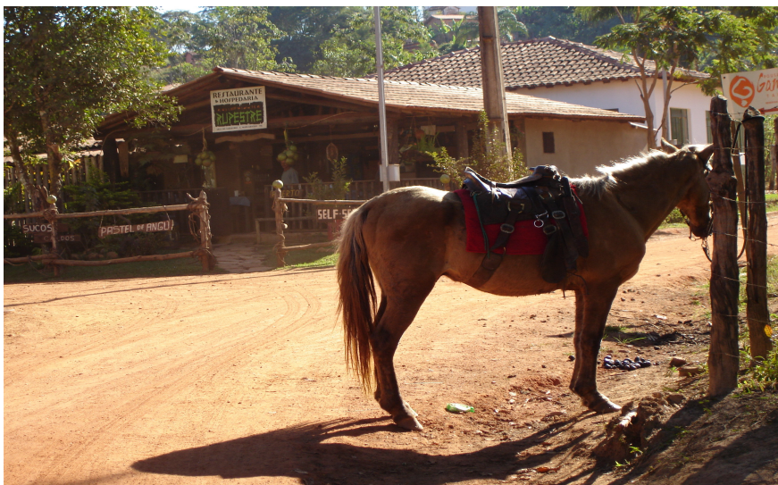
Fig. 5.33: Animal nas ruas (usado como meio de transporte). (2006)

O uso de animais como meio de transporte também traz alguns problemas. O pessoal amarra cavalos nas ruas que ficam sujas de estrume e urina de animal, causando mal cheiro em alguns locais (Figura 5.33).