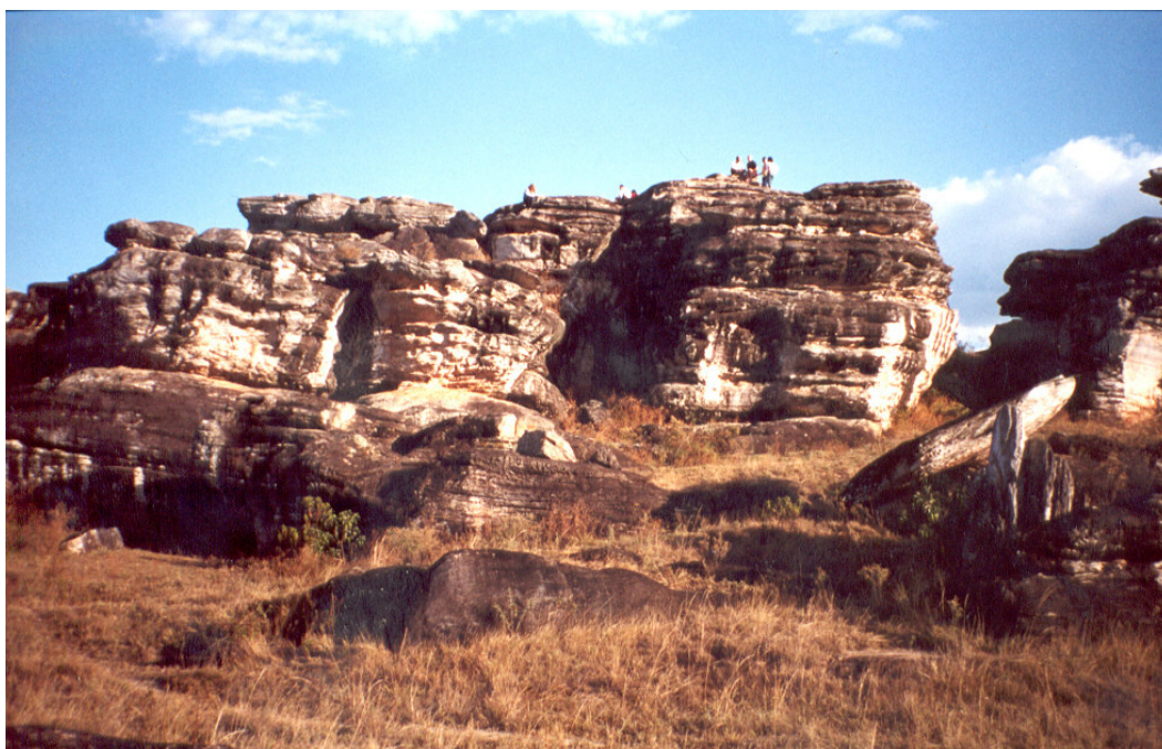
Fig. 5.46: Parque Natural Municipal Salão de Pedras em Conceição do Mato Dentro – MG.

Quanto a entidades voltadas para a questão ambiental, cita-se, além do Codema, a atuação da Ong Sociedade Amigos do Tabuleiro (SAT), que desde 1996 vem desempenhando papel de destaque na criação das unidades de conservação como o Parque Municipal Ribeirão do Campo, a APA e Parque da Serra do Intendente, a criação da Reserva da Biosfera da Serra do Espinhaço e do Parque Salão de Pedras onde estão as nascentes que abastecem a cidade de Conceição do Mato Dentro (Figura 5.46).