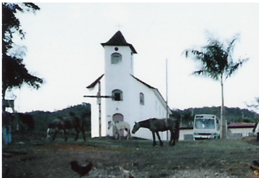
Fig. 5.34: Cavalos e aves pastando no adro da igreja. (2005)

Do lado de baixo da igreja fica um curral e o adro da mesma é usado como pasto (Figuras 5.34 e 5.35). Além de animais como cavalos e vacas, que alguns moradores deixam a pastar, aparecem também algumas aves ciscando. Outro problema na paisagem, segundo o prof. Altamiro, é a presença de porcos no meio da rua. Conforme dados da Emater (2005), no distrito há um total de 550 suínos.