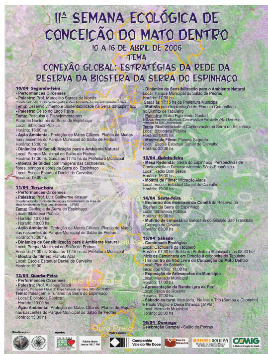
Fig. 5.45: Programação da 11ª Semana Ecológica de Conceição do Mato Dentro – MG. Fonte: Semat. (anexo 4)