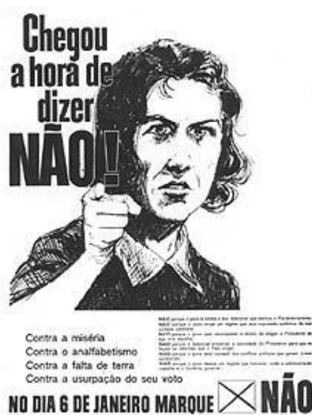
Figura 1 – Propaganda em defesa do fim do parlamentarismo. 59

Os trechos dos livros didáticos citados no parágrafo anterior não mencionam a greve geral que antecedeu a votação pela antecipação do plebiscito e que a vitória esmagadora do presidencialismo foi vista por João Goulart como uma vitória pessoal e, principalmente, uma vitória de seu projeto político ilustrado pelas imagens a seguir. As imagens mostram o interesse em associar o retorno ao presidencialismo ao projeto das reformas de base e demonstram o papel relevante de Jango nesse processo.