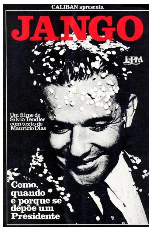
Figura 6 – capa do DVD do filme Jango .

No caso de Jango , é mais difícil determinar com precisão, mas o Goulart desse filme é ilustrado como um sonhador que incorporou os anseios populares e acreditou em um país tão novo quanto se vislumbrava no início da década de 1960. Parece que Tandler ( JANGO , 1984) se guia mais pelo horizonte de expectativa, pensando nas categorias de Koselleck, que existiam para alguns setores sociais no final dos anos 1950 e início dos 1960 – um país novo, urbano, nacionalista – do que pelo espaço de sua experiência – a decepção com golpe aos 14 anos de idade. Por esta razão, o filme é tão emotivo e marcante. Esse cineasta/historiador conseguiu fazer esse deslocamento de uma forma brilhante, talvez pelo momento de sua produção, além das habilidades técnicas. Ou seja, o momento da produção – as Diretas Já e o fim da ditadura — traz à tona o sonho do país mais justo e igualitário, vivido antes do golpe, esse passado passa a ser interpretado de outra forma, pois se transforma em uma possibilidade de futuro. Na própria capa do DVD (figura 4), há um tom mais positivo, Goulart com confetes de carnaval representando talvez a esperança e o entusiasmo de uma geração.