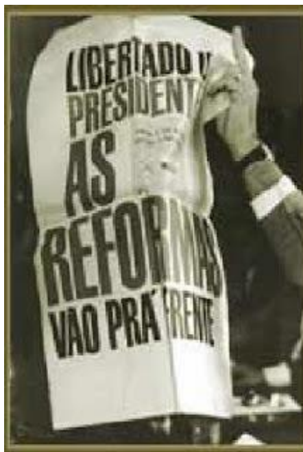
Figura 2 – Notícia da vitória do presidencialismo em um jornal da época. 60

A figura 1 aponta que a opção pelo modelo presidencialista naquele momento incorporava outras reivindicações como a luta contra a miséria, o analfabetismo e a falta de terras.