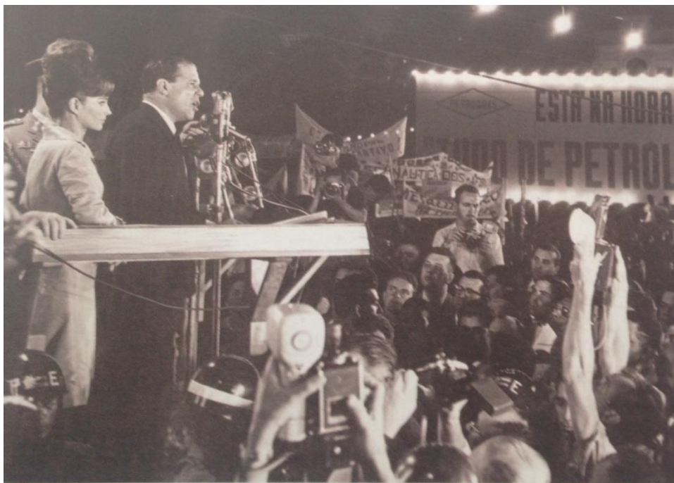
Figura 3– O presidente João Goulart, ao lado de sua mulher Maria Tereza Goulart, discursa no durante o comício de 13 de março de 1964 na Central do Brasil, Rio de Janeiro. 62

Sobre as reformas de base algumas inquietações são importantes: por que elas incentivaram ou foram uma espécie de válvula de escape para uma radicalização que já se anunciava desde o governo de Vargas? Como abordá-las nos livros sem provocar a impressão nos alunos que o fato de se aproximar de uma ideologia de esquerda é algo que, obviamente, deve ser combatido? Será que elas eram tão radicais como os livros didáticos afirmam? Radical para quem?