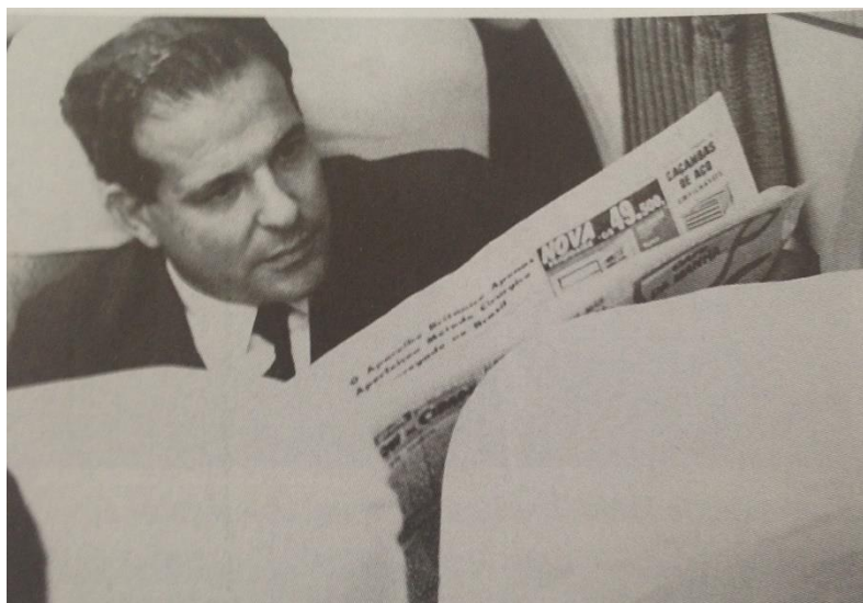
Figura 4 –João Goulart no avião, voltando de viagem à China, após a renúncia do presidente Jânio Quadros.

É difícil compreender esse silenciamento em parte da literatura escolar. Parece que a tendência de ver o movimento de 1964 como o colapso do populismo é muito alicerçada em várias representações que se tem da história política nacional, essa participação política vista como desviante. Logo, qualquer tentativa que compartilhe essa culpa, “responsabilidade ampliada” segundo Daniel Aarão Reis (2014, p. 13), pode desvalorizar essa perspectiva de uma passividade política inata ao brasileiro. Há o “esquecimento” em relação ao apoio militar dos Estados Unidos. Se é pesado afirmar que o golpe foi uma ação imperialista, imposta pelos Estados Unidos, por outro é inegável que ele contou com uma sustentação interna. O envolvimento estadunidense na política brasileira às vésperas do golpe foi reconhecido nos Estados Unidos. 67