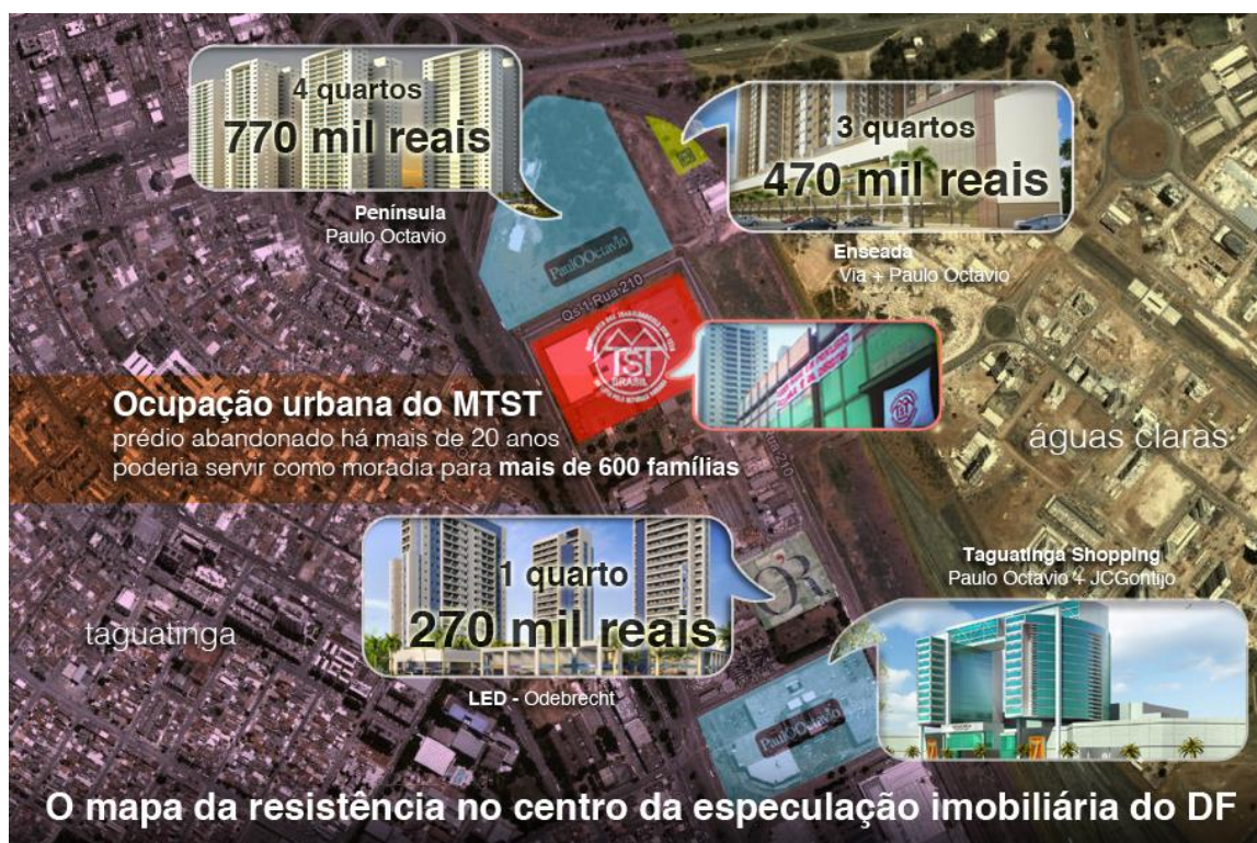
Figura 1 - Autoria Renato Moll.

em um sábado pela manhã levei uma amiga arquiteta para, junto a um militante do movimento, conhecer o prédio e elaborar um projeto inicial de requalificação para fins de habitação popular. De acordo com os estudos realizados por ela, o prédio poderia oferecer moradia para 600 famílias em apartamentos duplex de 60 a 90 metros quadrados, além de cozinhas comunitárias, espaços de lazer, bibliotecas e áreas para agricultura urbana (Maia, 2013).