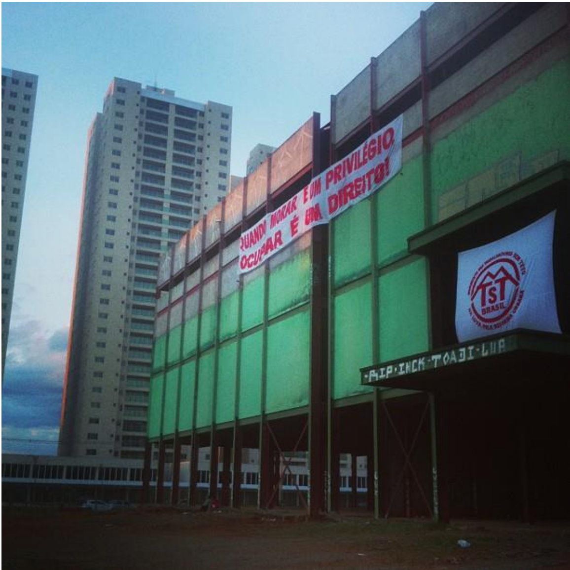
Figura 2 - Autoria própria.