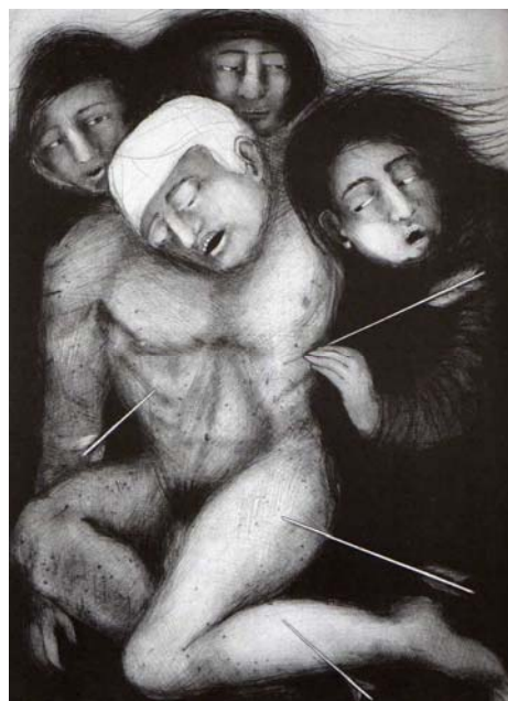
Ana Maria Pacheco, Study for St. Sebastian II , 1998, monotipia, coleção MACG.

A apropriação da artista pelas diferentes instituições culturais do Estado é marcada pelo signo identitário e pelo desejo de modernidade. A biografia da artista foi muito útil nessa constituição. Nascida na capital do estado e graduada pela Escola de Belas Artes local,