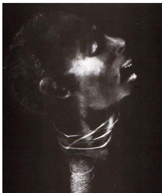
Ana Maria Pacheco, Zumbi , série “Bandidos”, 2000, monotipia, coleção da artista

A série sobre personagens míticos da história brasileira mostra-nos sua ironia para com as narrativas históricas. Os “rebeldes” e “desajustados” decapitados de outrora 6 , marginais da ordem estabelecida em diferentes momentos históricos, são reabilitados não pela artista, mas pelo presente que expõe a próprio movimento de lógica de controle social contemporâneo. A artista “subverte o simbolismo político das degolas, restaurando à cabeça dos ‘bandidos’ toda a dignidade de seu sacrifício, ao mesmo tempo em que registra a selvageria que se presumia chamadas de civilização.” (MNBA, 2000: 34).