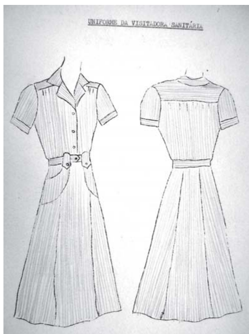
Figura 3. Uniforme da visitadora sanitária (Itacoatiara/AM).

Se o foco explícito do guarda era separar fezes de pessoas por meio da produção da materialidade necessária, o da visitadora era efetuar esta separação por meio da produção de pessoas disciplinadas ao uso destes recursos. À prática de lavar as mãos somam-se muitas outras práticas higiênicas e de cuidados corporais vinculadas a certa concepção de funcionalidade do organismo humano. Dentre os tópicos de higiene pessoal do curso de formação de visitadoras, encontramos, além de (1) “higiene e saúde - definição e signos de boa saúde” e (2) “hábitos de higiene - como são formados”: (3) “células - unidade estrutural do corpo humano”; (4) “desenvolvimento do corpo humano”; (5) “pele - estrutura e função”; (6) “ossos, músculos e postura”; (7) “mãos e unhas - cuidado necessário”; (8) “pés e sapatos - higiene necessária”; (9) “olhos - estrutura e função e cuidado necessário” (o mesmo se repetindo para ouvidos e cabelos); (12) “sistema digestivo - boca e dentes”; (13) “estômago e intestino”; (14) “hábitos higiênicos de eliminação”; e assim sucessivamente para diferentes órgãos e sistemas, finalizando com “menstruação”, “dormir e descansar”, “recreação - higiene mental”, “roupas - higiene” e “hábitos de higiene necessários para diferentes idades”. Infelizmente, não há um detalhamento de cada um dos tópicos, mas sua enunciação permite acompanhar a