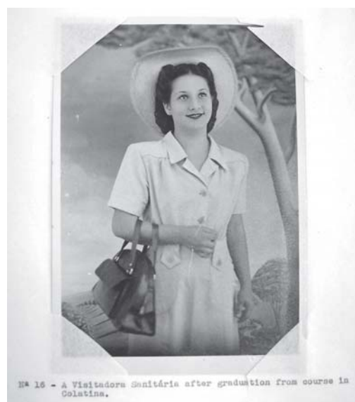
Figura 4. Formanda da turma de visitadoras de Colatina (MG).