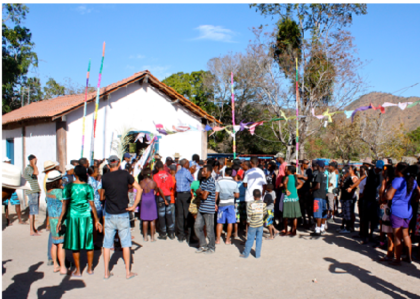
Saída do Império, Igreja do Vão de Almas

No dia 14 de agosto acontece o Império do Divino Espírito Santo aproximadamente às 16 horas, e sai da casa do festeiro em direção à capela. O ritual é composto por um imperador, com os anjos e sua família sendo acompanhados por um sujeito que carrega a bandeira e outro a espada, são rezados benditos e é feito um sorteio para que se defina o próximo imperador e responsável pela festa do ano seguinte. Após esse momento, há um cortejo que acompanha um sanfoneiro e seus tocadores à residência do festeiro e serve-se um banquete para toda a comunidade. Nesse mesmo dia, à noite acontece uma reza, o levantamento do mastro que simboliza a gratidão, um cortejo e uma reza. Além disso, nos dias 14 e 15, há sempre uma missa realizada pelo Padre da região em que são celebrados casamentos e batizados. No dia 15 acontece o reinado com ritual semelhante ao império e no dia seguinte, 16, ocorre missa dos romeiros e o encerramento da festa com a assunção dos novos festeiros.