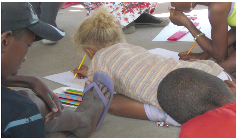
Oficina de desenhos com crianças do Vão de Almas