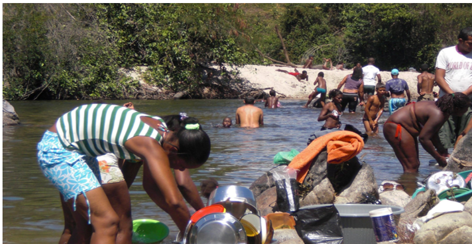
Rio das Almas – Comunidade do Vão de Almas