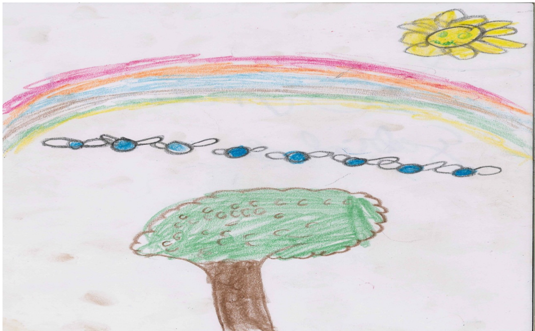
O arco-íris, o sol, pássaros e a árvore – desenho de criança kalunga sobre sua região.