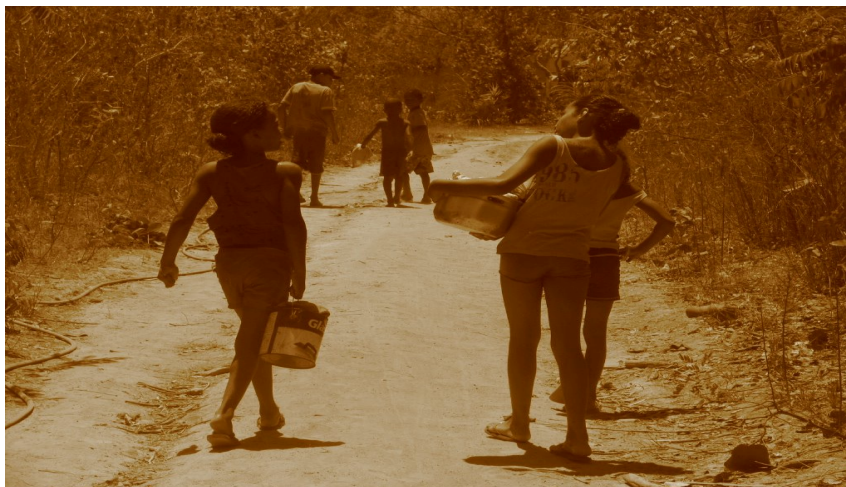
Crianças indo buscar água no rio – Vão de Almas

Nesse contexto, percebemos que as crianças desde cedo aprendem a lidar com as obrigações comuns ao espaço kalunga. Ajudar na roça é sempre algo que os adultos ensinam a suas crianças, pois nas famílias kalungas, no geral, são muitos filhos, e com isso muitas mãos para ajudar assim como muitas crianças para alimenta. Além disso, vemos crianças indo ao rio buscar água utilizada na alimentação, para lavar as panelas e louças e para asseio pessoal. É comum também, a participação dos idosos em todas as atividades. O povo kalunga é conhecido pelas atividades de plantio para a sua subsistência, e segundo relatos dos entrevistados, todos participam, desde criança aos mais velhos.