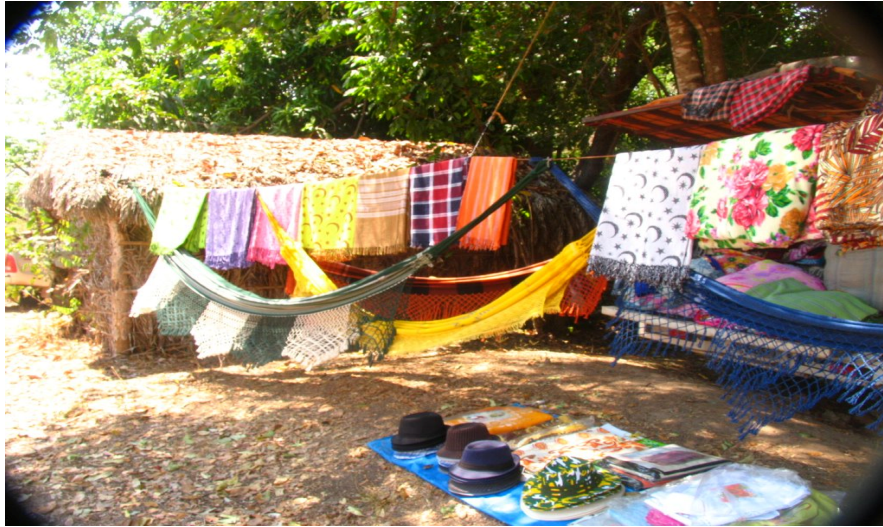
Comércio improvisado durante a festa do Vão do Moleque

manhã, almoço, jantar. É comum encontrarmos barracas de vendas com freezers que funcionam movidos a geradores elétricos para venda de bebidas alcoólicas, refrigerantes e água; além de uma estrutura composta por balcão, mesas, cadeiras de plásticos para oferecerem algum conforto aos clientes. Alguns caminhões carregados por roupas, lanternas, chapéus, entre outras mercadorias de utilidade para os habitantes da região compõem o cenário do comércio nesse período. Além disso, muitos kalungas comercializam bebidas alcólicas e algum tipo de comida em seu barraco com prateleiras e cozinha improvisadas.