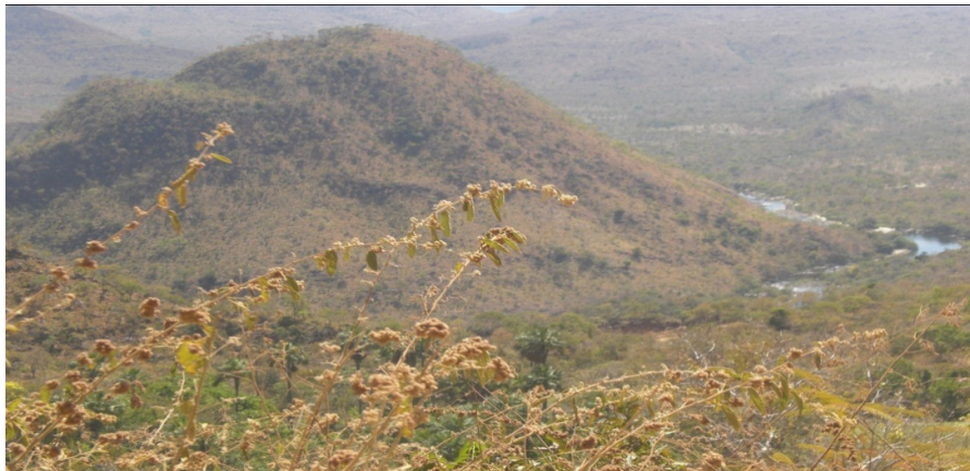
Rio das Almas circundando a serra – caminho para o Vão de Almas

do vale que circunda uma serra denominada Moleque; Vão do Prata é a região do vale do rio Prata; entre outros. Os rios são elementos importantes nessas comunidades, pois abastecem os indivíduos com água para consumo próprio, sendo utilizados também para lavar panelas e banho.