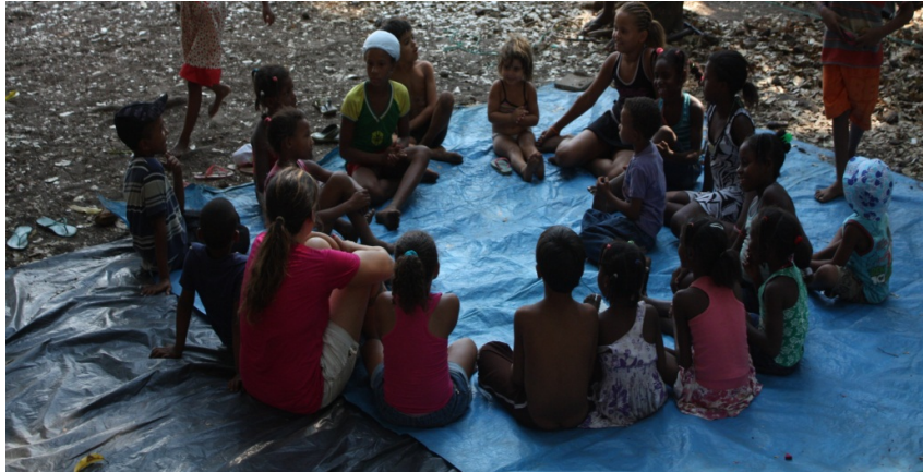
O espaço da brincadeira – Vão do Moleque

Ao chegarmos à comunidade, notamos a presença de muitas crianças e ao ser anunciado no microfone da festa que “o pessoal da saúde estava lá e faria também atividades com as crianças”, logo surgiu pouco a pouco uma porção delas. Criamos um espaço entre as árvores, próximo aos atendimentos que o pessoal do Projeto Viver Kalunga estava realizando, pois muitos vinham procurar atendimento e as crianças ficavam por perto. Assim, estabelecemos um local para as brincadeiras, e que seria o lugar que muitas das crianças passariam os dias conosco durante as festas.