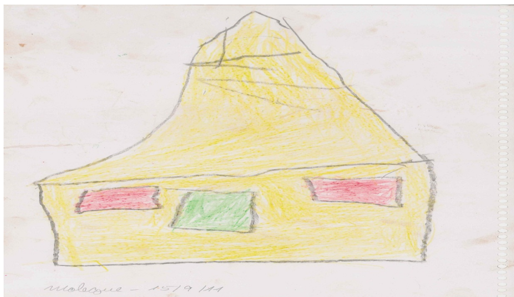
Desenho de criança kalunga habitante do Vão do Moleque– Sua moradia.

Além disso, é por meio das interações sociais que os conteúdos culturais são transmitidos, juntamente com a construção de hábitos e valores. Assim, ao participarem de sua comunidade que seja durante os preparos das festas, ou indo buscar água no rio, a concepção que os sujeitos fazem de sua comunidade incide sobre a formação dos sujeitos participantes, sendo uma relação de reciprocidade e construção mútua permeada por uma representação simbólica que depende de aprendizados.