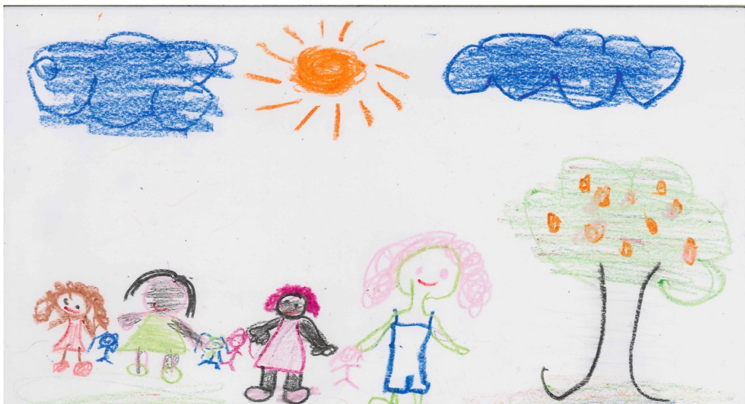
Desenho de criança kalunga sobre sua família e o modo de vida na sua comunidade – Vão de Almas.

Ao considerarmos as crianças como colaboradoras e sujeitos ativos nessa pesquisa, damos voz às mesmas e assim, podemos buscar elementos que representam seu universo, o contexto a qual estão inseridas e as atividades que gostam de realizar. Os elementos que