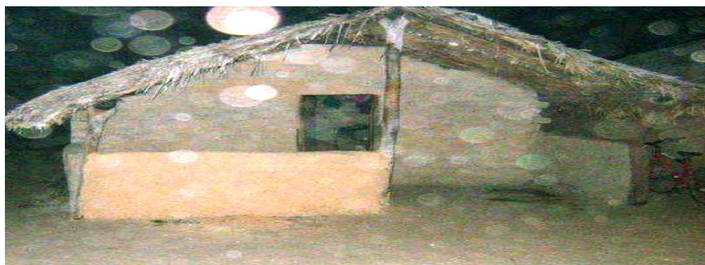
Barraco no Vão de Almas – Moradia temporária de uma família kalunga durante a festa

A maneira como o local é estruturado é semelhante no Vão de Almas e no Vão do Moleque. Há um eixo central formado pela igreja e no extremo oposto, o barracão de palha, em que acontecem os forrós e a festa. Às margens deste eixo, existem barracos para a estadia dos kalungas, sendo de adobe no Vão de Almas e de palha e madeira no Vão do Moleque. Esses barracos são ocupados pelas famílias tradicionais e pelos mais velhos, quando não são suficientes o que vem ocorrendo comumente nas últimas festas, os outros kalungas e visitantes acampam nos arredores. É comum vermos os barracos serem reparados por causa da deterioração do tempo e da inutilização no momento da festa, visto que é quando estão presentes nesse local que é visitado apenas durante esse período.