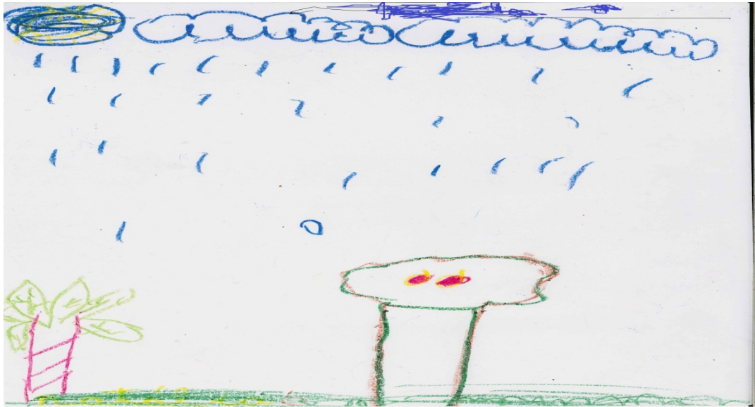
A chuva e as árvores - Desenho de criança kalunga sobre onde vive – Vão de Almas.