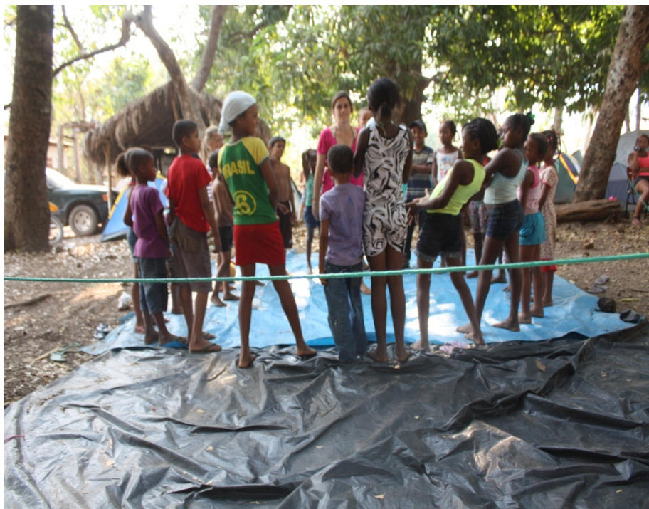
Brincadeiras com músicas – Vão do Moleque.

“o coelho montou na onça e apareceu na festa”. As crianças nos relataram que os avós contam histórias para eles.