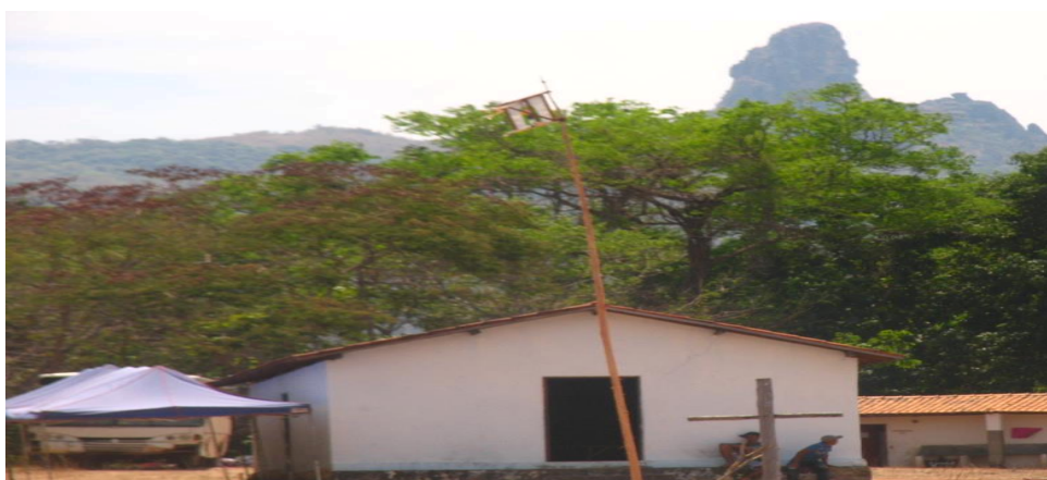
Pico do Moleque e a capela da comunidade do Vão do Moleque

Os Vãos, como são denominados, são vales de terras planas que se formaram entre as cadeias de montanhas e representam uma identificação de moradia e habitação de alguns kalungas que vivem na região. Estes sujeitos que convivem na mesma região, se constituem como um grupo menor dentro a categoria geral a que pertencem os kalungas. Por sua vez, cada Vão é subdividido em regiões menores denominadas por “fazendas”, em que os limites dessas áreas são definidos por acidentes geográficos, uma serra, uma baixada, o curso de um córrego, etc. As fazendas são compostas por inúmeras famílias com propriedades de terras de tamanhos distintos.