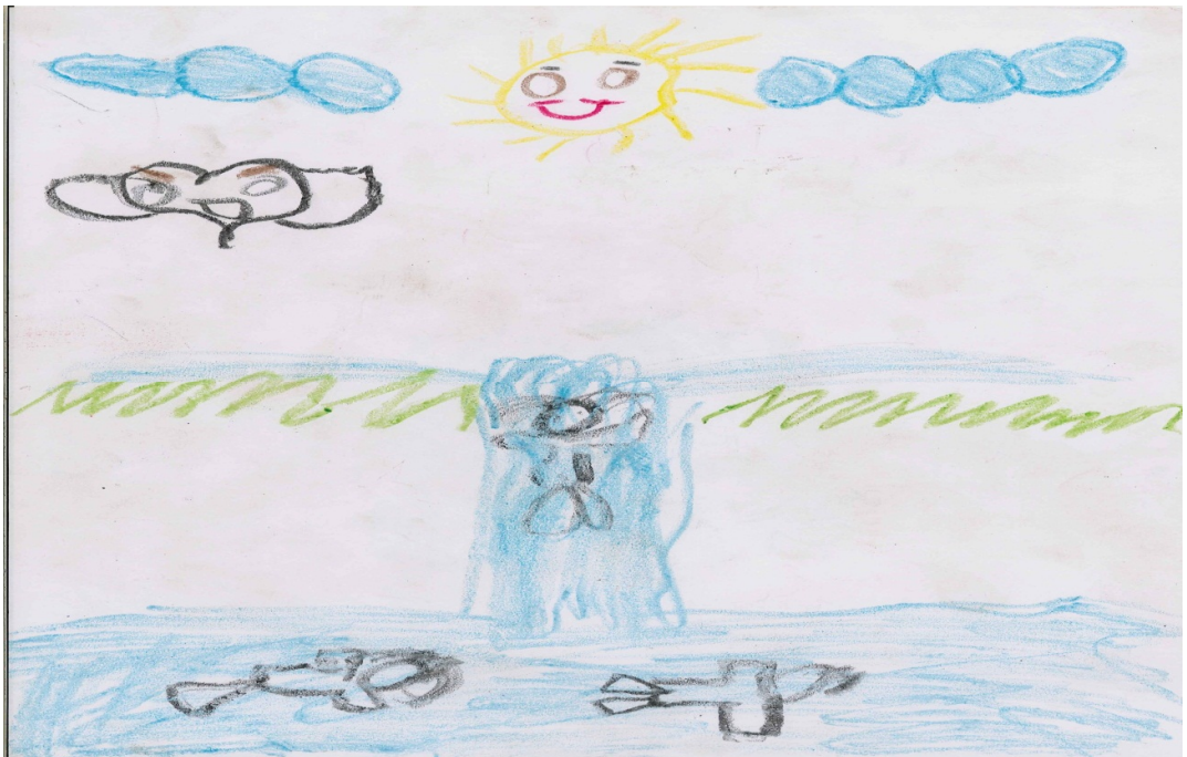
O lazer no rio – Vão de almas.