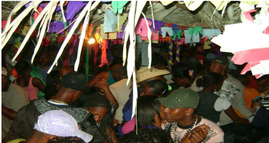
Forró kalunga no barracão – Comunidade Vão de Almas