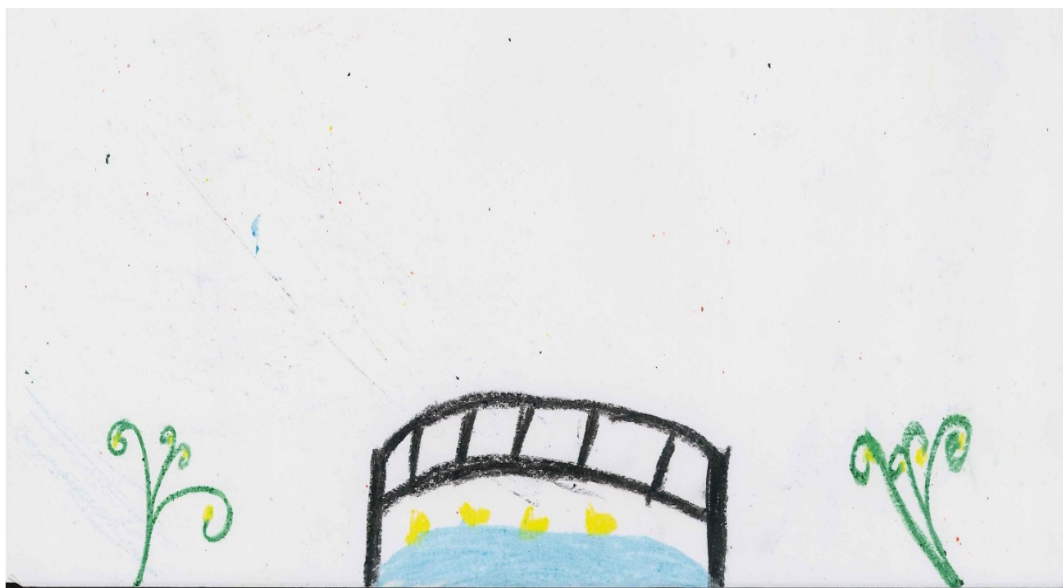
O rio e a ponte – elementos da realidade e cotidiano de uma criança kalunga apontados em seu desenho – Vão de Almas.