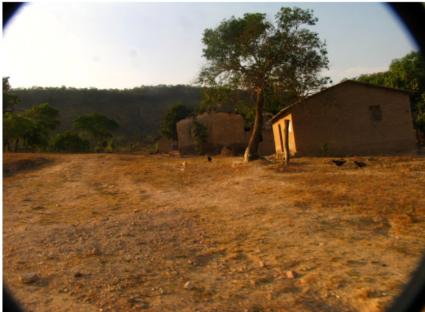
Casas de familiares na mesma propriedade – Comunidade Kalunga

A moradia entre os kalungas ocorre de forma dispersa e são afastadas da estrada, de forma geral. É comum vermos uma casa distante de outras por muitos quilômetros e avistarmos construções próximas de rios e córregos. Por não haver rede de água e esgoto nas propriedades e os sujeitos terem que caminhar grandes distancias para adquirirem água, percebemos construções que beiram e se aproximam das margens de rios, de onde provem a água para consumo dos homens e dos animais. Um elemento característico dessa população é o plantio de roça, o cuidado com o gado e o pomar de usufruto comum entre os sujeitos da mesma família. Em uma propriedade costuma existir, muitas vezes, mais de uma casa, pois os filhos quando se casam podem construir e se mudar para sua própria casa dentro da mesma terra.