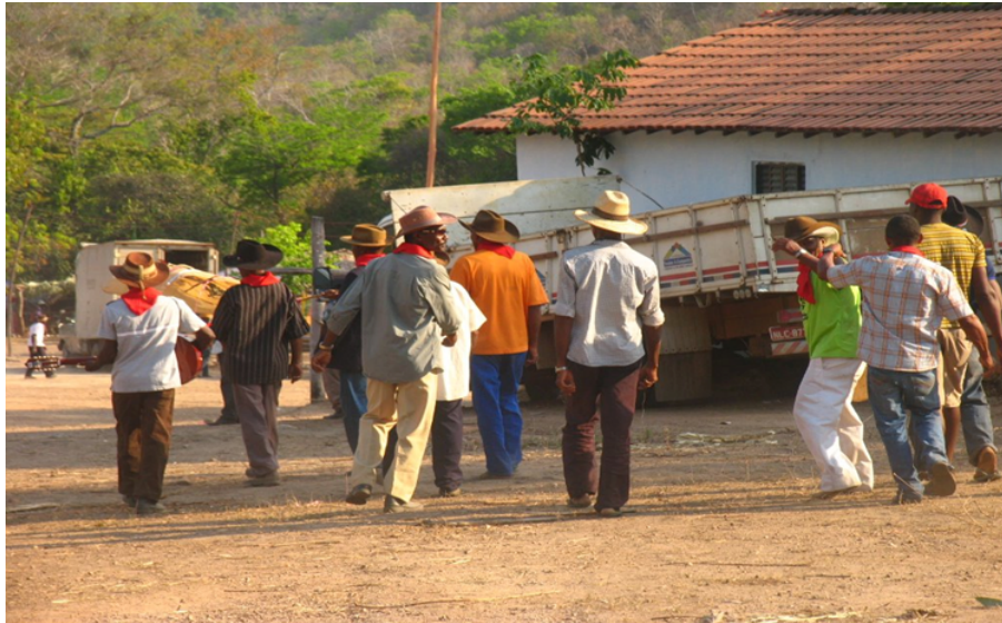
Tocadores do festejo – Vão do Moleque

com os jovens, adultos e idosos. Dessa forma, elas podem observar os hábitos dos mais velhos e aprender participando do forró, da missa, do império, e dos outros momentos coletivos.