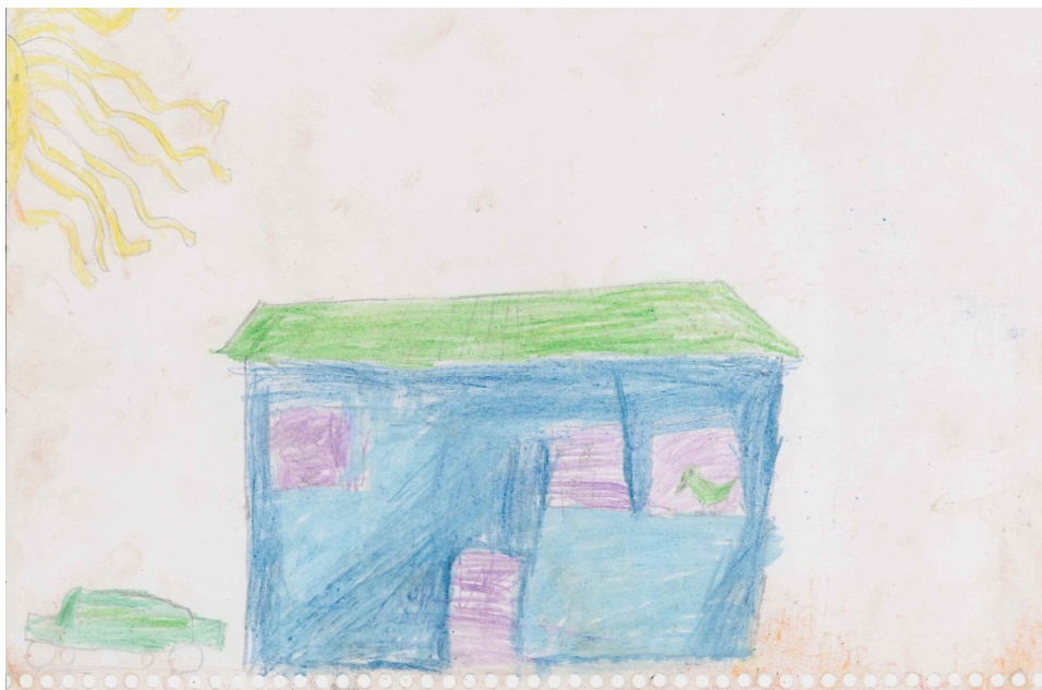
Desenho de criança kalunga – a casa, o sol, o pássaro e o carro.

No último desenho apareceu um elemento diferente dos desenhos anteriores: o carro. Notamos que os carros fazem parte da realidade recente dessas crianças, por terem maior contato com visitantes e pela maior presença de carros na região devido à construção da estrada.