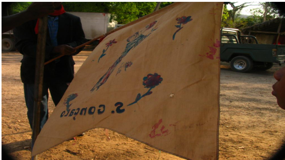
Bandeira de São Gonçalo – Comunidade do Vão do Moleque

Assim como no Vão de Almas, no Vão do Moleque a igreja, local em que ocorrem as atividades religiosas como a missa, a reza e o levantamento do mastro; e o barracão da festa, que serve de palco para os banquetes do império, do reinado e dos forrós, são as construções mais importantes do festejo.