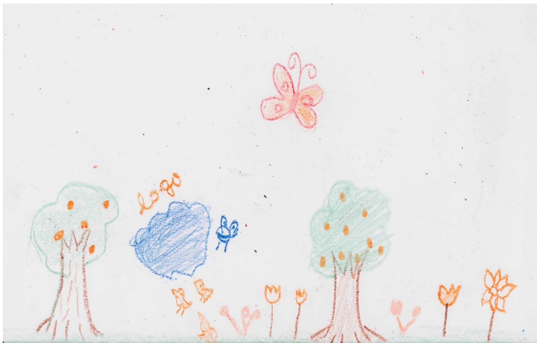
Os animais e as árvores – desenho de criança kalunga no Vão de Almas.