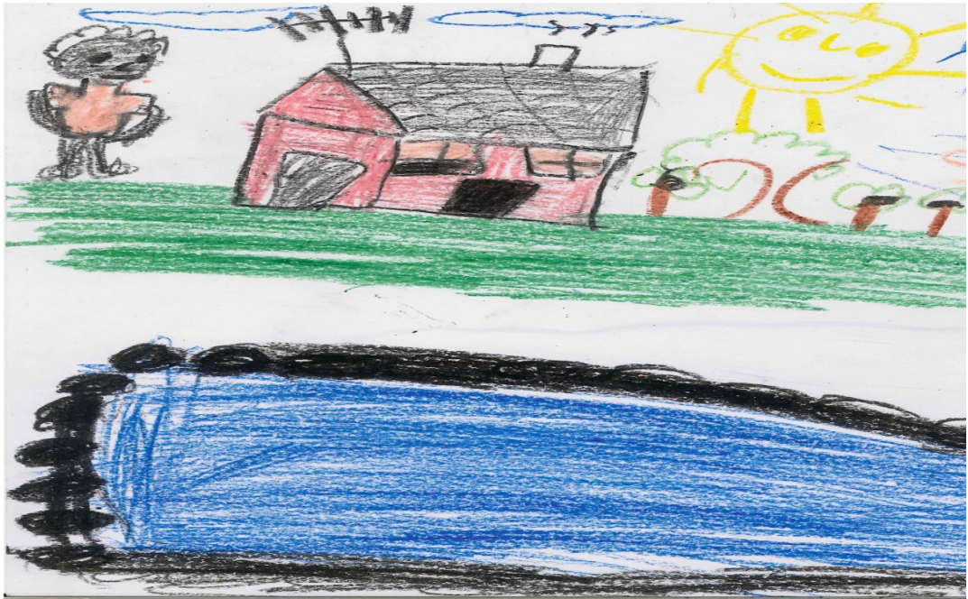
A criança kalunga retratada em sua moradia juntamente com o rio, a casa, o sol e as árvores - Vão de Almas.