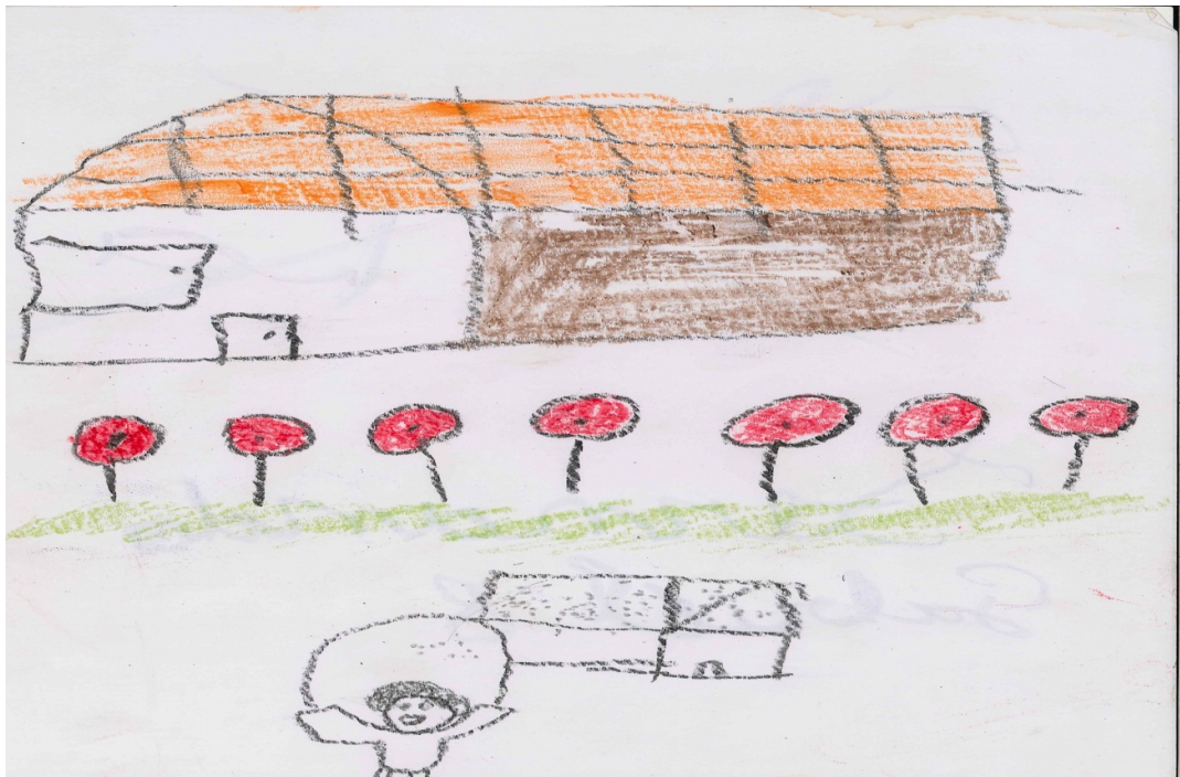
A casa, as plantas e a brincadeira de corda – Vão de Almas.