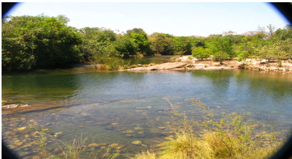
Rio Prata – importante rio da região