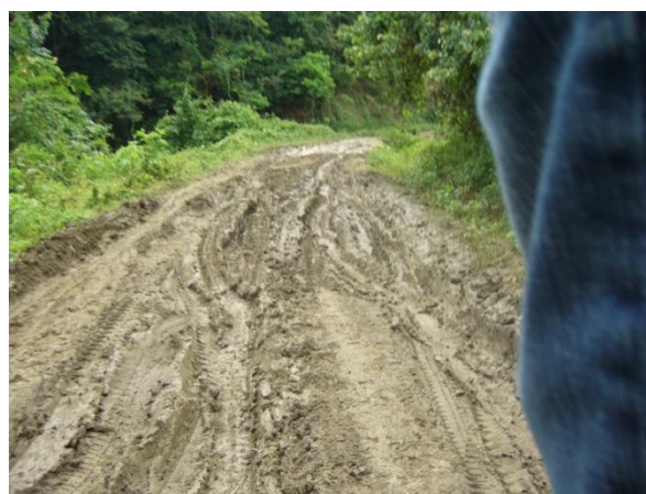
Imagens 5 e 6. Transporte de tabaco de El Salado a El Carmen de Bolívar. Sete de setembro de 2011.