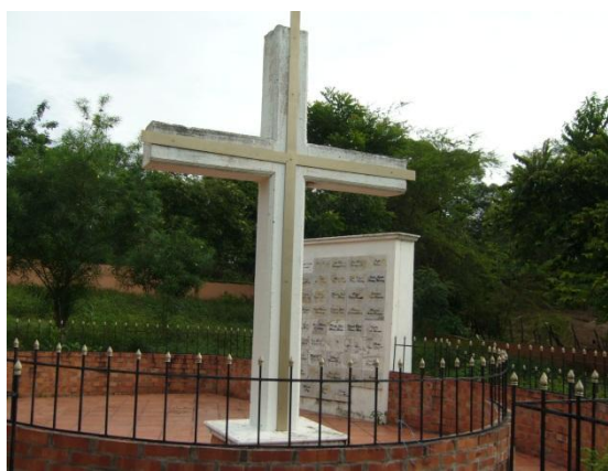
Imagem 1. Monumento de homenagem às vítimas da violência em El Salado.