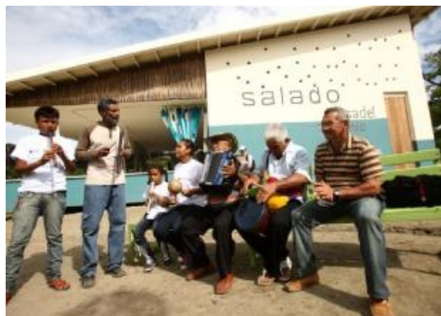
Imagens 3 e 4: Casa del Pueblo 64 . Fonte: Revista Semana, 2012.

Em El Salado prima a organização social. Atualmente se conta com cinco associações integradoras de diferentes membros da comunidade: Asociación de campesinos de El Salado, Grupo Juvenil del Salado, Mujeres Unidas del Salado, ASOJOPROS (Asociación de Jovenes Productores del Salado) e ASODESBOL (Asociación de Desplazados del Salado Bolívar). A través destas organizações executam-se projetos produtivos e de formação técnica, além de encontros comunitários