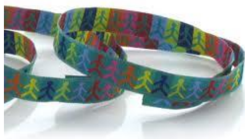
Imagem 2. Pulseira desenhada para apoiar publicitariamente o projeto Reconstrução de El Salado 62 .

O projeto foi lançado e divulgado publicitariamente com uma pulseira de punho (Imagem 2) em setembro de 2009, como uma iniciativa para que a empresa privada vinculava-se à reconstrução de El Salado. A Fundação convocou várias empresas, estamentos e sócios midiáticos para apoiar o projeto (INFORME SEMANA, 2009).