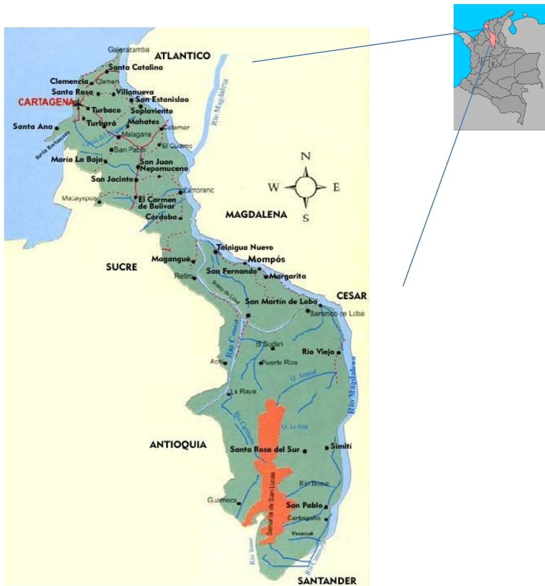
Figura 1. Departamento de Bolívar-Colômbia com seus municípios 26 .

estratégicos por onde podem se mobilizar tropas, armas e drogas (MEMORIA HISTÓRICA, 2010 b ).