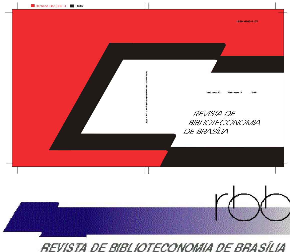
Figura 2 - Marca definida para o protótipo

A construção do site considerou seções específicas, o trabalho acontece de maneira simbiótica, ou seja, observando as características do formato anterior.