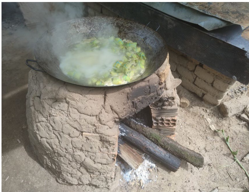
Figura 2: Fornalha