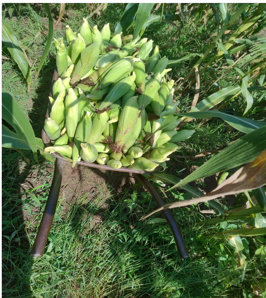
Figura 12: Milho verde in natura

A seguir, é possível visualizar vida do ser humano e a natureza, alimento ser humano e natureza, para muito além do alimentar, e sim a sabedoria, prática e resultados sustentável e solidário.