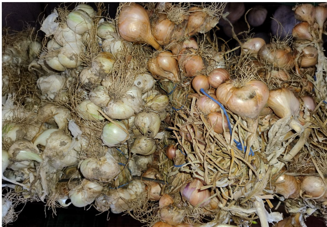
Figura 15: Cebolinha branca e roxa