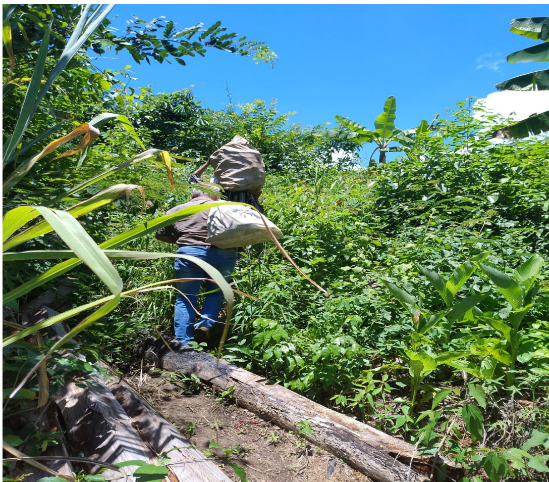
Figura 10: Auto-organização do núcleo familiar