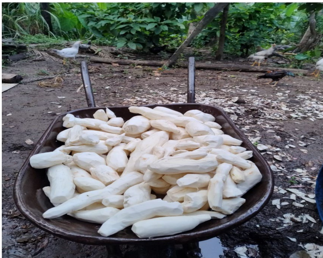
Figura 5: Mandioca em fase de processamento