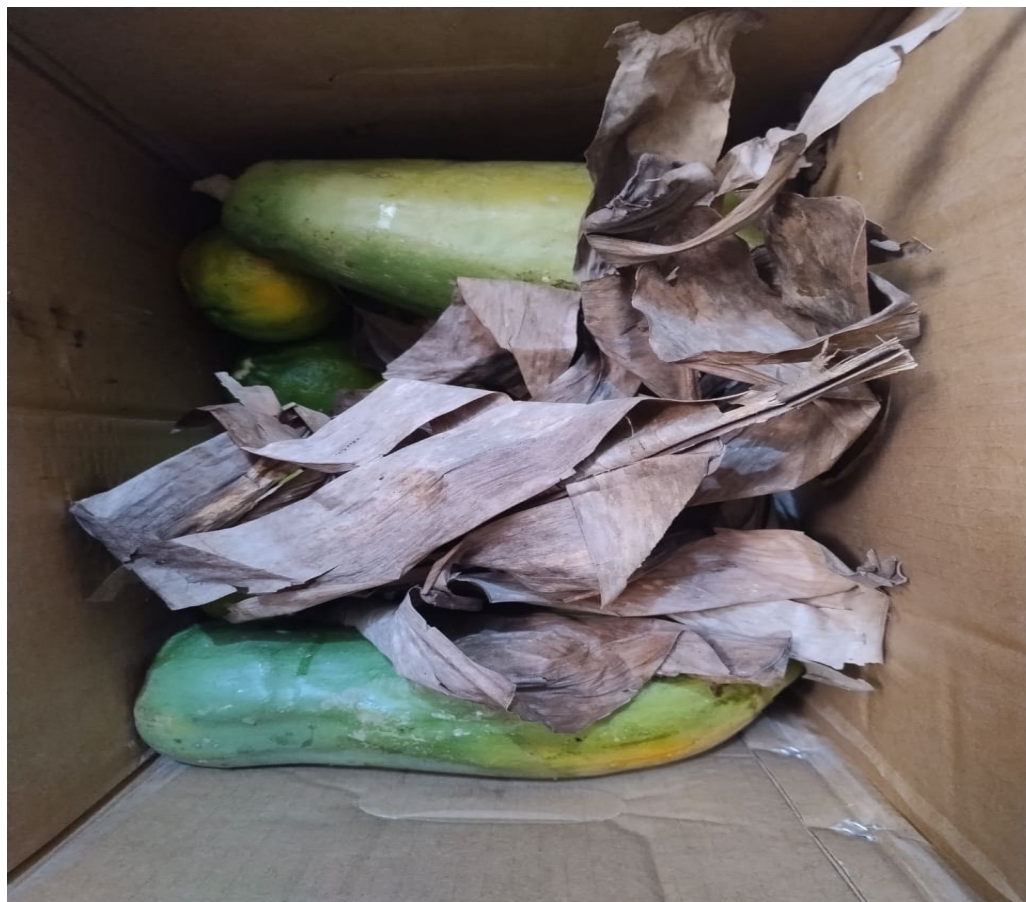
Figura 14: Frutas orgânicas