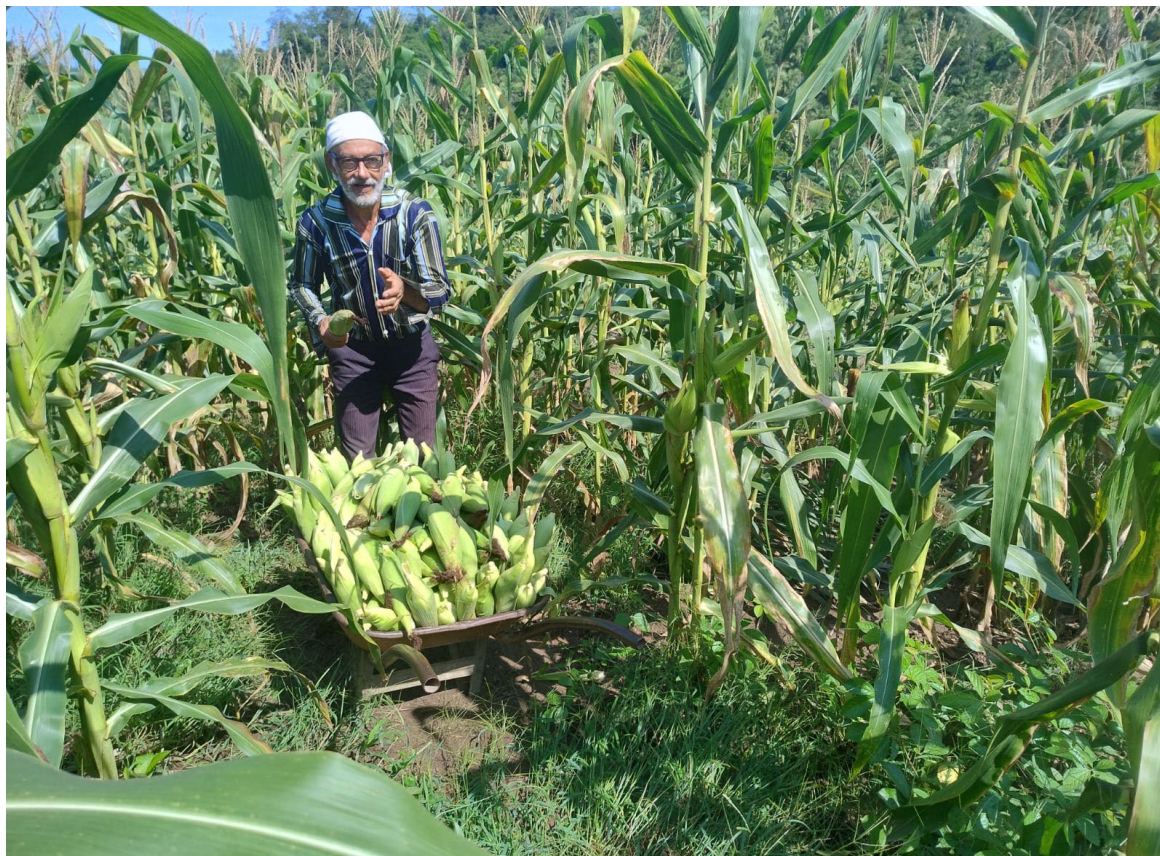
Figura 17: Quintal produtivo

queimar em setembro, e outubro fazer o plantio Hoje não podemos mais fazer isso, porque o fogo pode sair da área e perder o controle, porque não existe aceiro para fogo, tem faísca que pula até 150 de distância de onde está o fogo, as coisas melhoram, evoluem para um lado e para outros acaba dificultando, porque para o pequeno agricultor a queimada é um dos pontos principais no processo de rotação de cultivo (Geraldo, 2025).