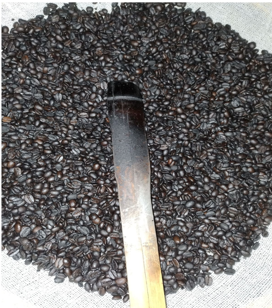
Figura 25: Café torrado