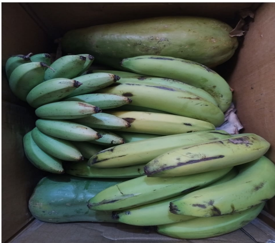
Figura 22: Banana orgânica