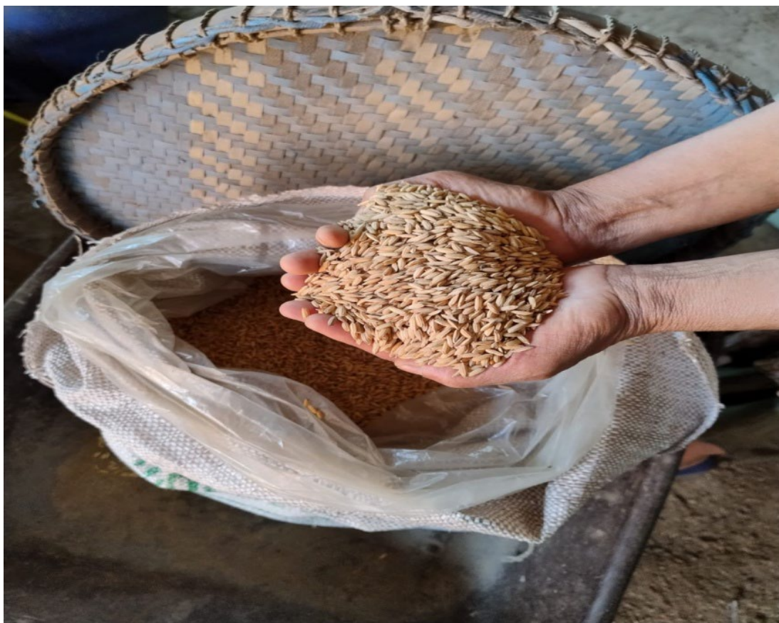
Figura 4: Semente crioula de arroz