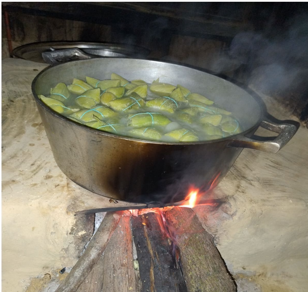
Figura 19: Sabores

do viver, fazer e como fazer, levando em consideração os recursos naturais presentes, sua funcionalidade e a necessidade de saber usar sem deteriorar.