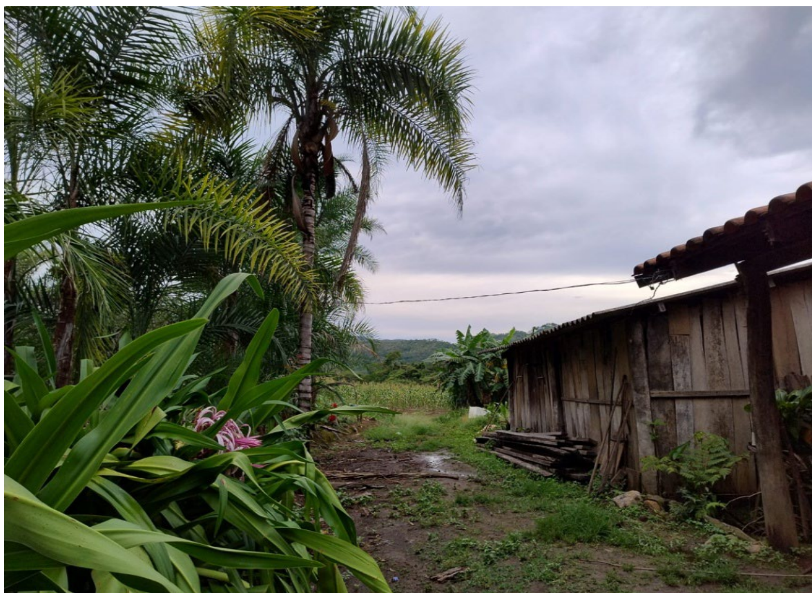
Figura 6: Quintal produtivo

Cada parcela tem uma especificidade, cada lote tem uma realidade. São 72 parcelas que compõem os diversos saberes, teoria e prática, que resultam na sustentabilidade ambiental, tendo como princípio a realidade do assentamento de antes, durante e a atualidade. Para Primavesi (1992), a Agroecologia implica um manejo do solo baseado em processos biológicos e físicos naturais, priorizando a saúde da terra em detrimento do controle químico-mecânico, buscando restaurar os equilíbrios naturais para garantir uma agricultura sustentável, economicamente viável, socialmente justa e ambientalmente saudável.