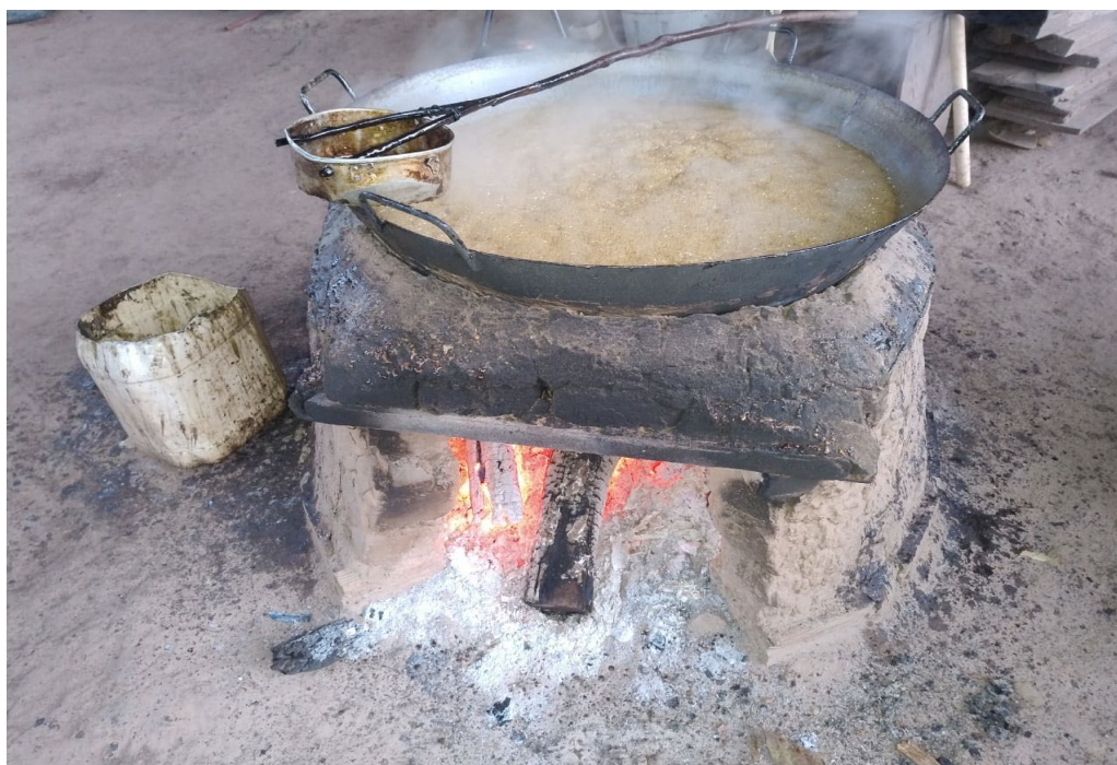
Figura 18: Produção de açúcar mascavo

reprodução das várias práticas tradicionais, fortalecendo o desenvolvimento rural e sustentável, com o fazer diário da agricultura, reconhecendo o papel e a força da natureza como parte do movimento e se complementando. São os vários mínimos detalhes que fazem total diferença e constituem a essência do saber fazer no campesinato. Saber plantar, saber colher, saber em que época e como, saber para que e como usar exigem muita sabedoria, e ela parte da ancestralidade.