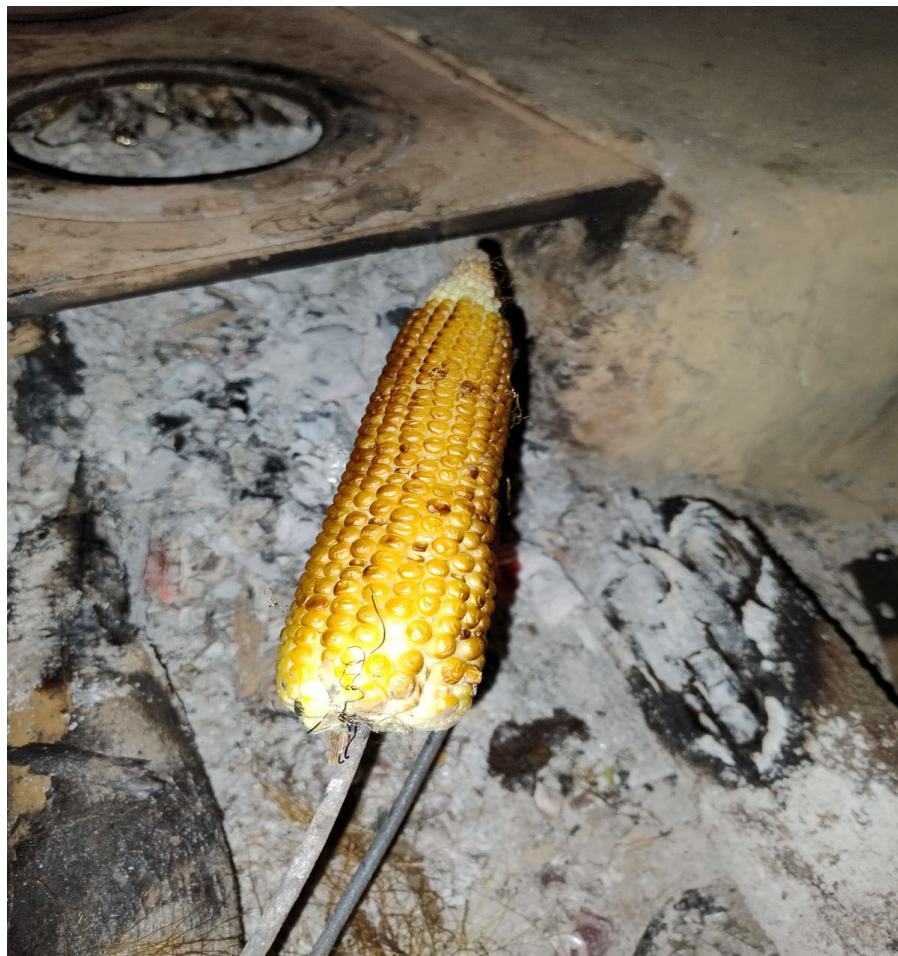
Figura 23: Milho assado na brasa