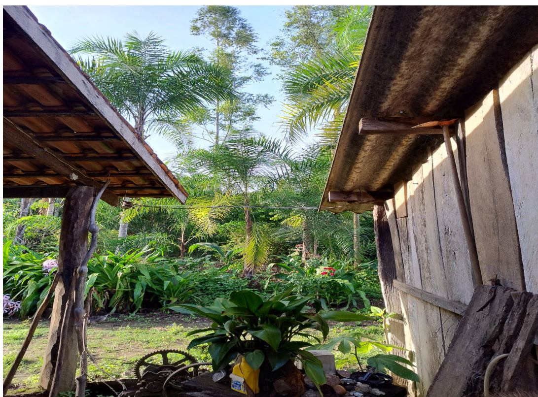
Figura 16: Os muros que nos cercam

escolhendo trabalhar com pastagem, porque os terrenos são pequenos, não tem espaço para rodar máquina para fazer grandes plantio. Aí, quem já está com a idade avançada, a melhor opção é mexer com gado, que não requer tanto esforço físico. A forma de fazer roça do sustento dificultou muito. Antigamente a gente fazia roça, trabalhava nela de 3 a 4 anos, aí saía dela e fazia em outro lugar. Com isso, a roça anterior virava capoeira novamente, com 12 anos já estava uma mata novamente, aí fazíamos rodízio. Hoje não, hoje aqui no assentamento dificultou, porque não podemos mais fazer derrubadas, aí as roças ficam muito velhas no mesmo lugar e acaba dando muitas pragas e a produção perde força e diminuem (Geraldo, 2025).