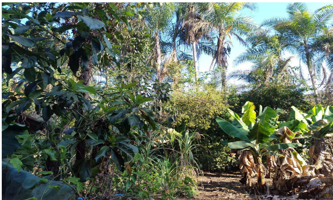
Figura 8: Diversidade