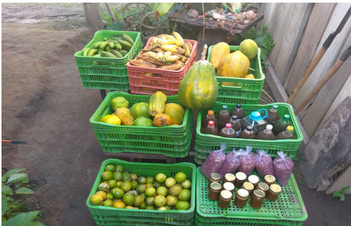
Figura 20: Produção orgânica

Os assentados do Rio Bonito constroem e produzem a cadeia alimentar necessária à comunidade, a soberania alimentar resulta no saber, no fazer e na autoconsciência de responsabilidade e corresponsabilidade com o meio ambiente. E a partir de práticas do dia a dia, vão produzindo de forma sustentável de acordo com a especificidade de cada parcela, a rede de possibilidades do bem viver numa área de Reforma Agrária. A cesta da agricultura familiar contém alimento e vida em forma de cores e sabores e o enraizamento do saber tradicional.