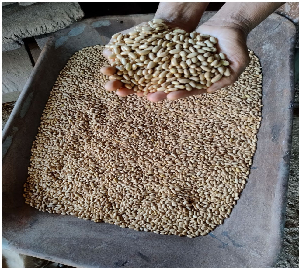
Figura 13: Semente crioula de feijão