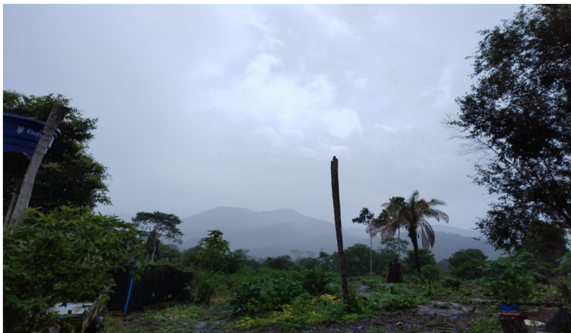
Figura 3: Natureza