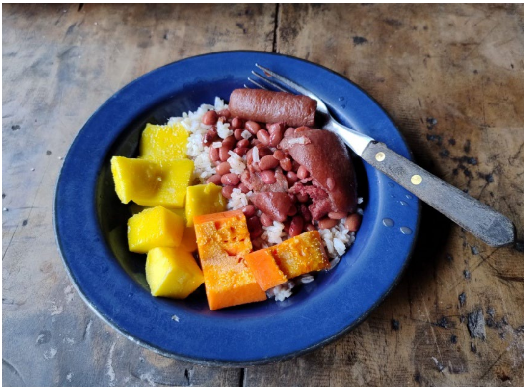
Figura 7: Soberania alimentar