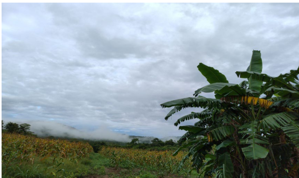
Figura 9: Agricultura familiar camponesa

O Rio Bonito é constituído dos vários saberes, fazeres, ancestralidade e diversidade, que constroem e se reestruturam, adaptando-se de acordo com o uso consciente do solo, percebendo o caminho e a forma correta de desenvolver as várias práticas de sustentabilidade.