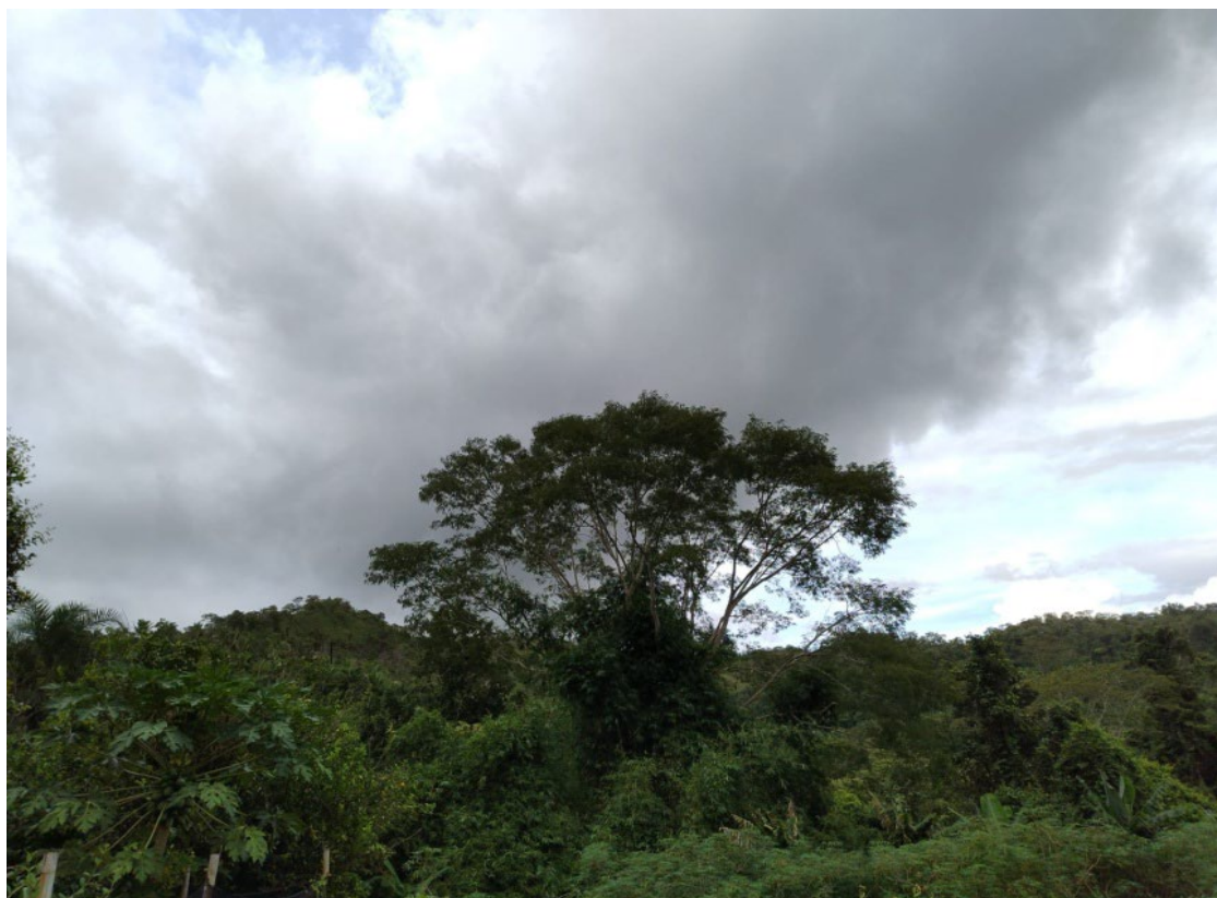
Figura 11: Natureza em sua virtude

adubos químicos, a terra fica dependente e cada vez fica mais fraca, então temos que conservar, porque adubo químico estraga a terra e a nossa saúde, então é melhor usar os adubos que temos na natureza mesmo. Aqui mesmo temos uma terra que a gente pisa nela, chega ela é fofa. Agroecologia aqui é o sistema de produção entre o meio ambiente, nossos objetivos de assentados e garantindo nossa sustentabilidade e autonomia. É o nosso modo de mexer com a natureza, é nosso sustento, nossa vida. Se não tiver essas técnicas de cultivo, como vamos ter resistência? Temos que ter nossas técnicas, o nosso modo de viver. Nós, seres humanos, precisamos da Agroecologia, do meio ambiente, da natureza, precisamos da terra e ela precisa de nós, então a gente cuida dela e ela cuida da gente. Alimentação saudável, meio ambiente saudável é bom demais e muito gratificante para todos nós aqui do assentamento poder pegar uma fruta e comer sem medo. E conseguimos nos manter a partir do cultivo, essa é a renda da família: eu planto uma variedade, o vizinho planta outra e, assim, vamos compartilhando e é bom demais e faz parte da Agroecologia. Aqui todo mundo planta de tudo um pouco, principalmente roças, frutas. O importante é a gente não deixar a natureza morrer, é deixá-la viva, bonita e transpirando o ar puro para a gente (Eleusa, 2025).