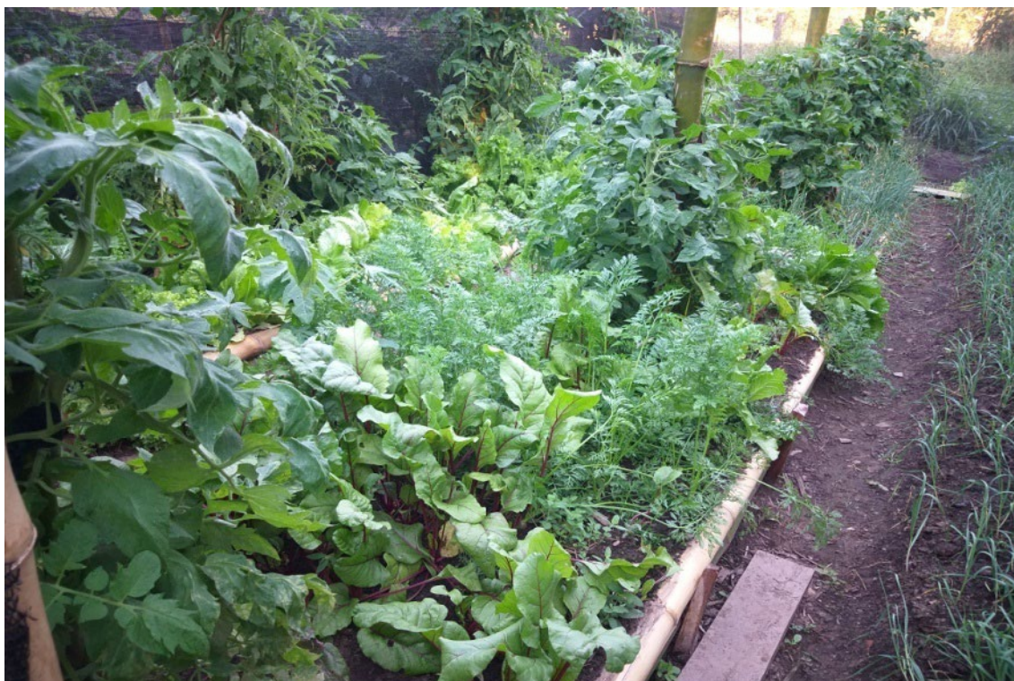
Figura 24: Horta orgânica