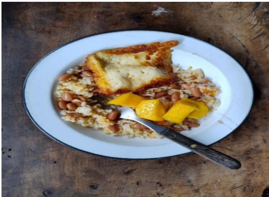
Figura 27: Soberania alimentar, as possibilidades do quintal de casa