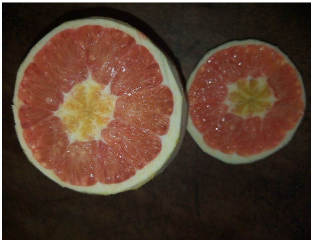
Figura 26: Laranja