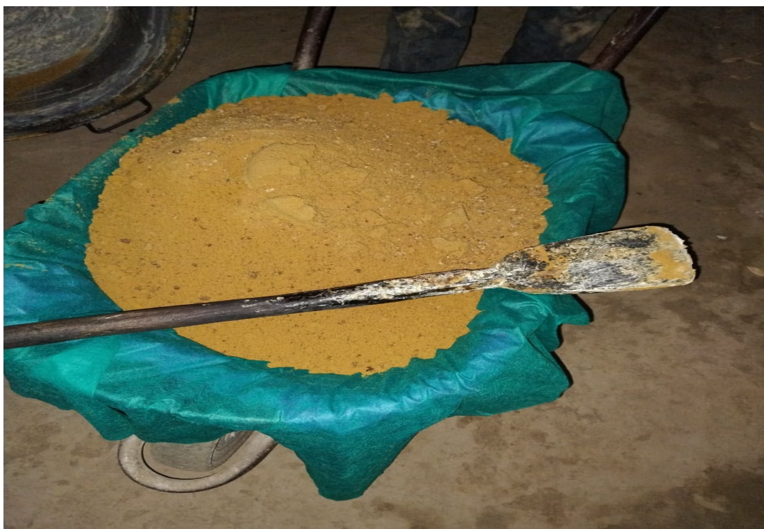
Figura 21: Açúcar mascavo