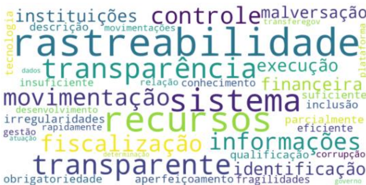
Figura 1 – Nuvem de palavras constituída a partir das respostas obtidas no Bloco V – Questão 28

A presença de palavras como, por exemplo, “corrupção”, “irregularidades”, “malversação”, “controle” e “identificação”, evidencia forte conexão entre rastreabilidade/transparência e prevenção de ilícitos, e responsabilização e accountability . Já os termos “fragilidades”, “insuficiência”, “obrigatoriedade”, “aperfeiçoamento” e “desenvolvimento”, por exemplo, indicam a percepção de que, embora haja mecanismos vigentes, o modelo atual ainda apresenta limitações institucionais e tecnológicas, sendo percebido como passível de aprimoramento.