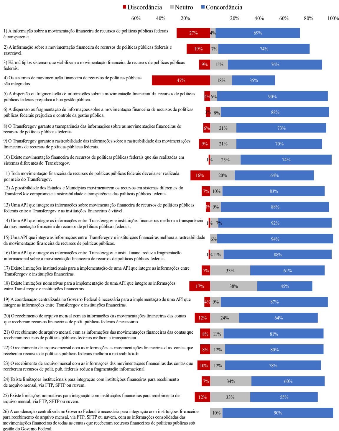
Gráfico 2 – Percepção sobre a fragmentação informacional nas transferências de recursos de políticas públicas federais no Brasil