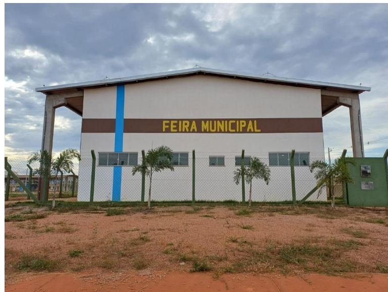
Figura 02 - Espaço da Feira de Domingo em Vila Bela

ao turismo, como já acontece com outras feiras realizadas em diferentes ruas/espços do país. Seu local de realização é em um espaço próprio (barracão), próximo à rodoviária e a entrada da cidade. A feira acontece durante o período da manhã. Sob a supervisão virtual do primeiro autor desse artigo, 12 estudantes (do grupo de 35 do Curso de Gestão em Tecnologia de Turismo) conversaram com 18 expositores/as que aceitaram, voluntariamente, participar da pesquisa, executada em 08 de junho de 2025.