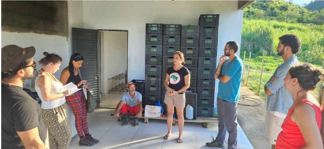
Figura 04 - Assentados(as) apresentam a COOPAC

a capacidade de organização dos produtores e a geração de valor local, como apontam Solha, Elesbão e Souza (2017).