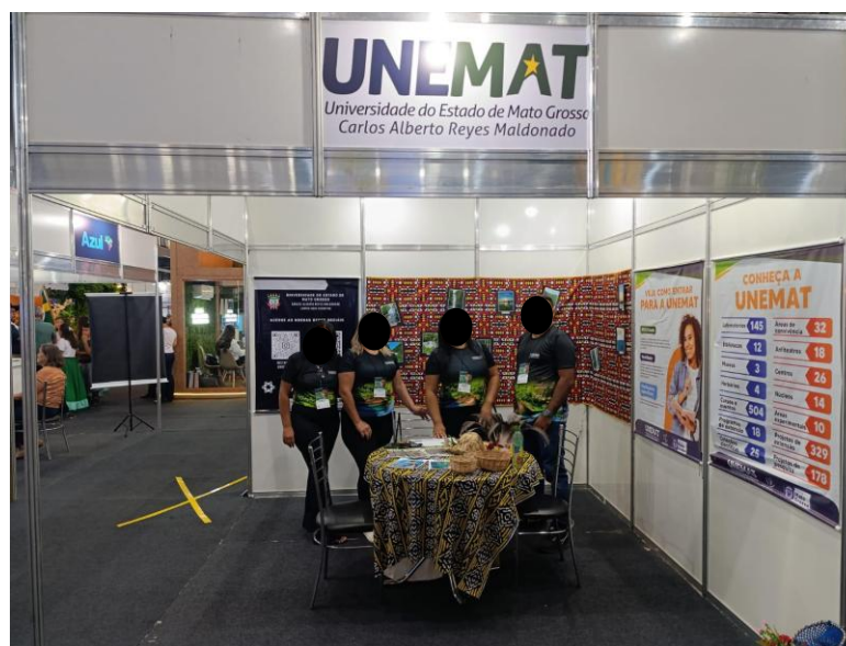
Figura 01 - Estande da Unemat na FIT Pantanal 2025

A UNEMAT esteve representada com um estande de divulgação dos seus cursos de graduação, especialização e pós-graduação, especialmente do curso de graduação em Gestão em Tecnologia de Turismo - Campus de Nova Xavantina e Núcleo Avançado de Vila Bela da Santíssima Trindade. Foi desse núcleo avançado da Unemat, que um grupo de 23 estudantes realizou as atividades de campo na própria feira. Ali, sob supervisão presencial do primeiro autor deste artigo nos dias 05, 06 e 07 de junho de 2025, conversaram com 48 diferentes expositores/as que aceitaram participar, voluntariamente, da pesquisa. Para fins de preservação e respeito à privacidade, os rostos das pessoas foram cobertos na imagem a seguir.