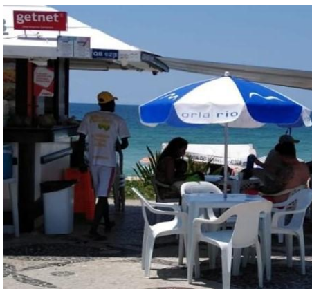
Moise de costas, vestindo camiseta do antigo Kaprichado, hoje Tropicália.