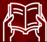
Figura 1 - Exemplos das dicas postadas nos stories do Instagram do projeto.