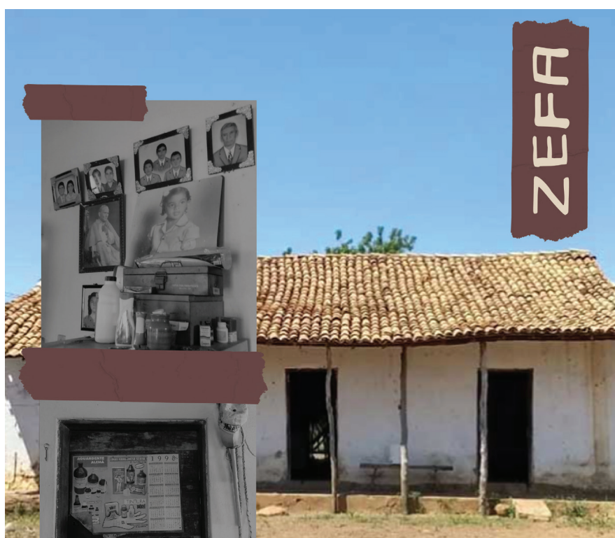
Colagem 08: Zefa