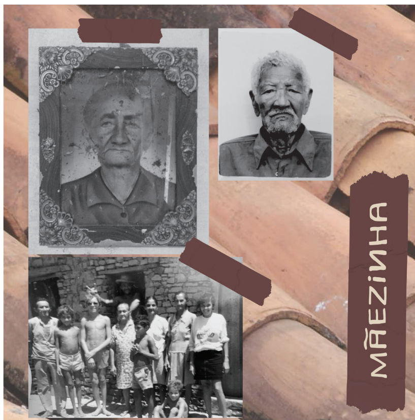
Colagem 03: Mãezinha