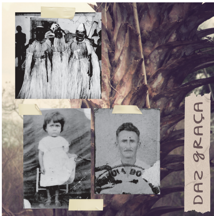
Colagem 01: Das Graças