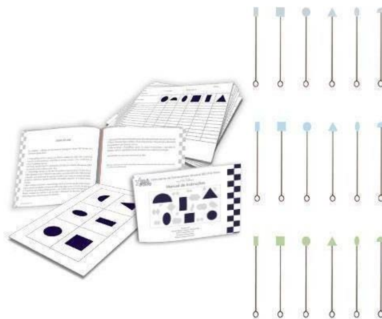
Figura 2 – Instrumento de Estereognosia Intraoral (IEI) PRÓ FONO – Incolor, verde ou azul