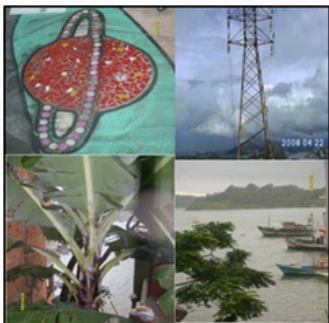
Fotos tiradas durante a expedição pelo bairro