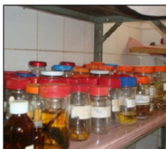
Mostuário de insetos