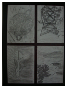
Desenho com carvão das fotos da expedição