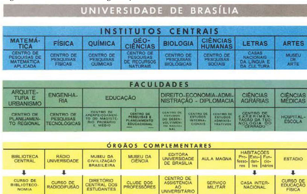
Figura 3. Primeira forma de organização dos cursos da UnB.