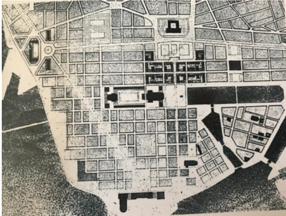
Imagem 1 – Plano definitivo assinado por Auguste Perret em 1946

duas “cooperativas dos assolados”: François 1 o e Agir. Cada uma delas possuía seus próprios arquitetos e mestres de obras e cuidava de uma zona específica da cidade. Além das cooperativas, o Estado estava responsável por reerguer os imóveis sem destinação individual e imediata (ISAI na sigla em francês), que seriam as unidades de habitação coletiva (Etienne-Steiner, 2017).