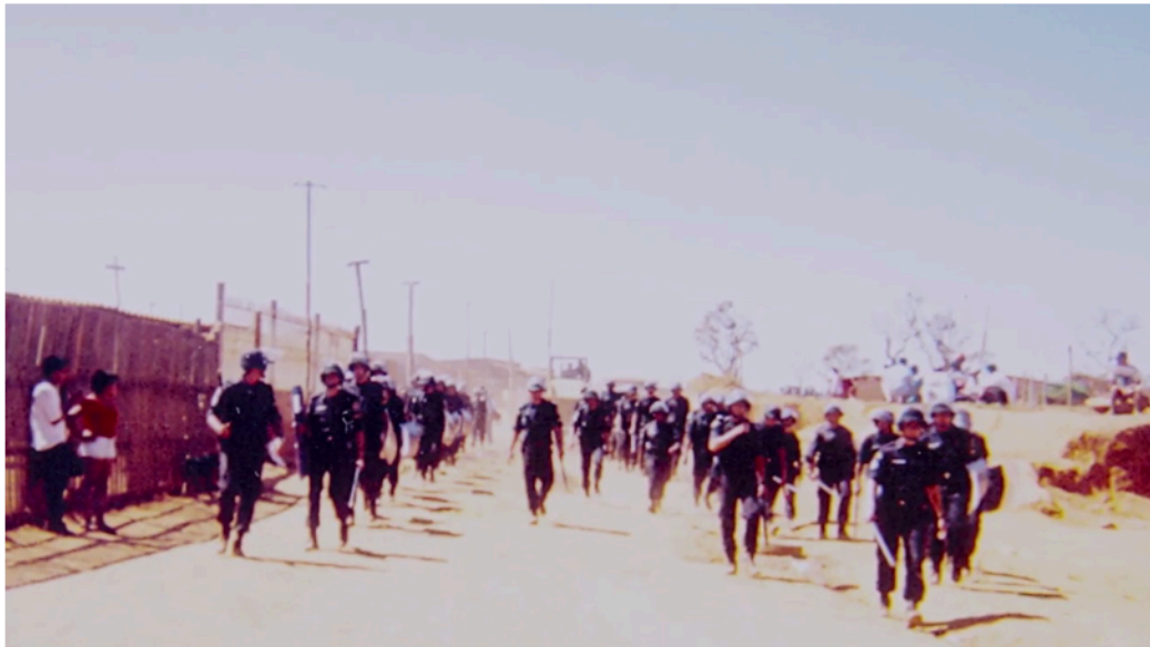
Figura 5: Cena do documentário "Estrutural".

O filme Estrutural , em sua abordagem multi-temporal, apresenta ferramentas e informações que nos permitem desvelar algumas relações de poder que imprimiram (e suprimiram) marcas na cidade ao longo do tempo. As ações da polícia, por exemplo, exibidas por meio de fotografias, evidenciam como a prerrogativa do uso da violência pelo Estado imprimiu marcas profundas nas histórias contadas sobre a Cidade Estrutural. Uma fotografia especialmente simbólica utilizada no documentário ( figura 5 ), mostra dezenas de policiais caminhando pelas ruas da cidade durante uma ação de desocupação de agosto de 1997. Não existe asfalto, nem casas em alvenaria. O que se vê, compondo a paisagem impressa na foto, são barracos de madeira. A marcha do batalhão de choque sobre o chão seco de terra, levanta uma fina nuvem de poeira. A suavidade da madeira, da terra, do azul do céu, contrastam com a densidade das vestes dos policiais, capacetes e seus cassetetes expostos na fotografia – símbolos da força da violência do Estado sobre o território vernacular. 11