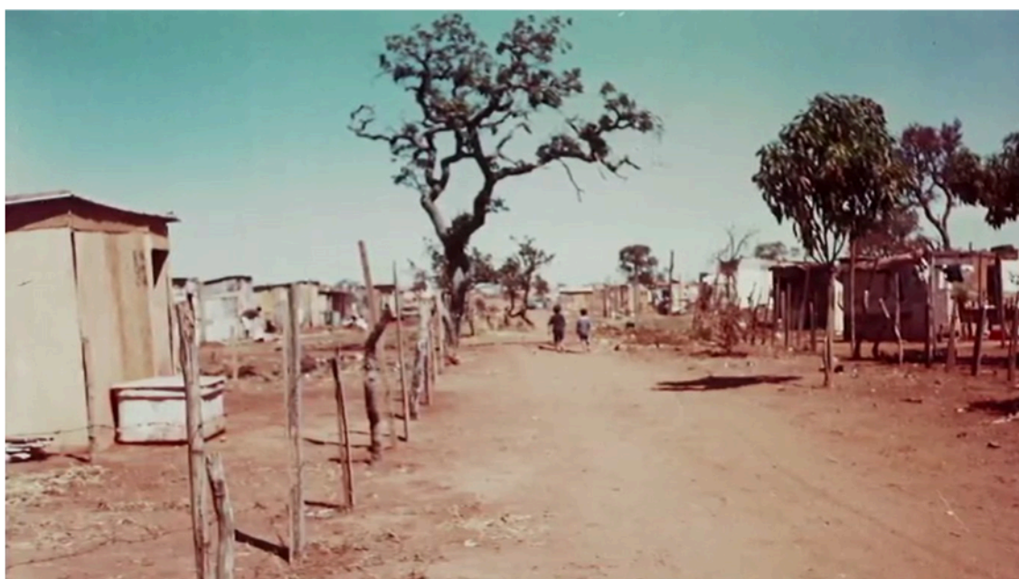
Figura 7: Estrutural na década de 1990. Cena do documentário "Estrutural". Reprodução do YouTube.

No entanto, entre o pessimismo imobilizador de Davis e o sonho modernista das cidades de vidro e aço totalmente planejadas, existem outras possibilidades. O que o filme de Dias deixa evidente, é que a cidade é um constructo. Na sua materialidade estão impressas as desigualdades sociais e econômicas que culminam na formação de periferias urbanas. Mas estão impressas, também, as lutas de suas habitantes pelo direito à moradia, a capacidade de atuação dos movimentos sociais urbanos. Se a cidade é, por definição, o lugar do conflito, ela