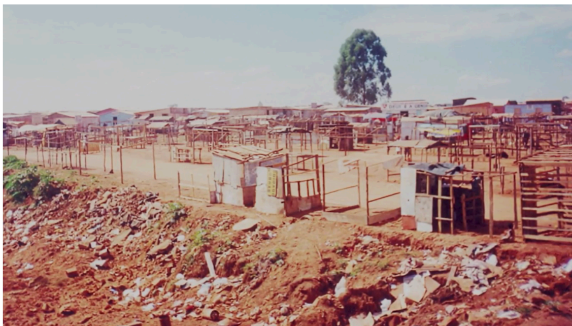
Figura 3: Expansão da Estrutural. Vila Nova. Cena do documentário "Estrutural".