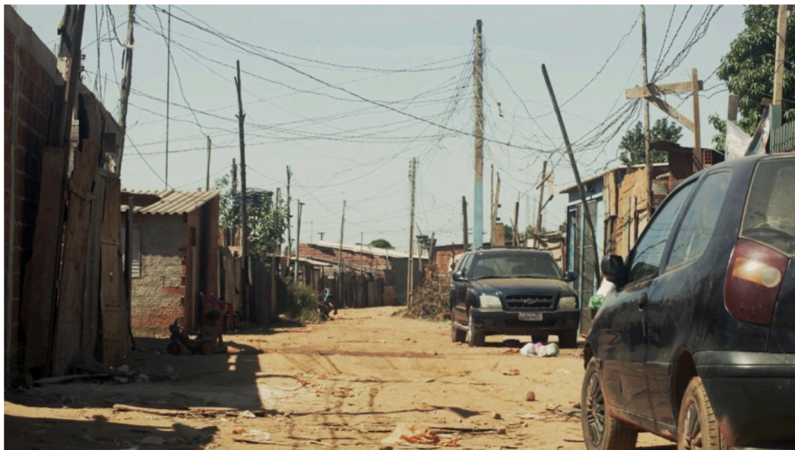
Figura 6: Santa Luzia. Cena do documentário "Estrutural".