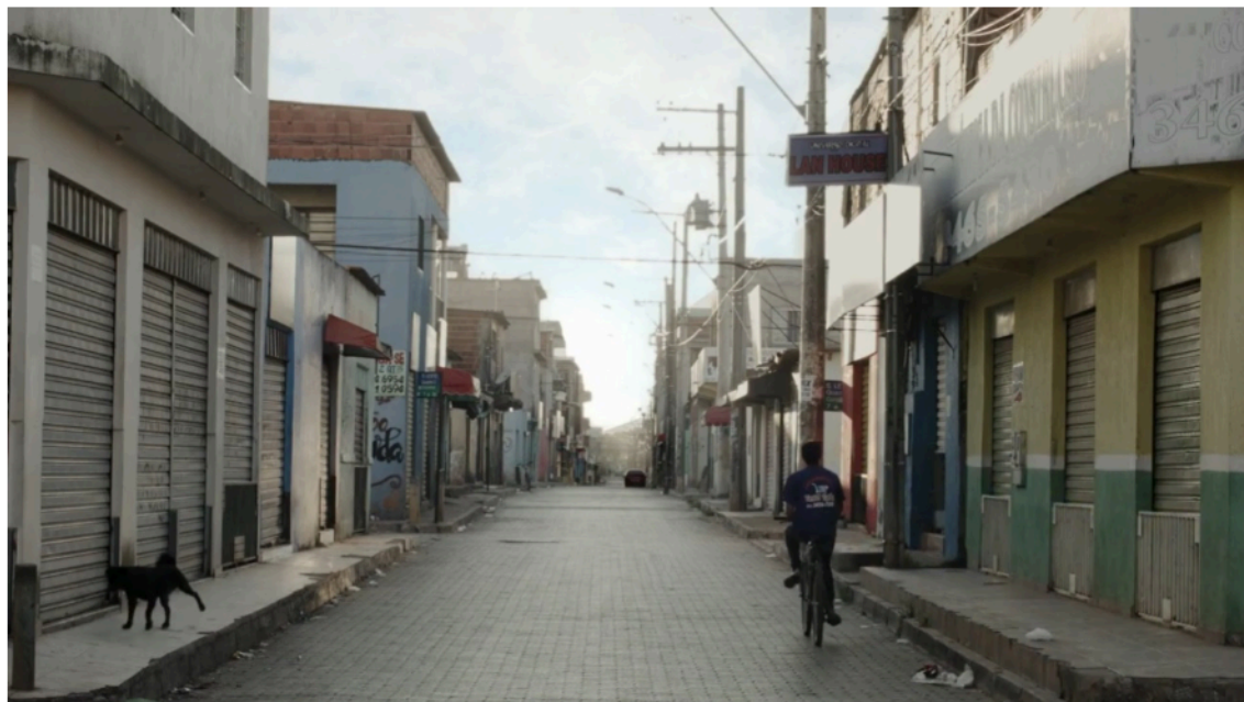
Figura 1: Cena do documentário "Estrutural". Reprodução do YouTube

Ao caminharmos por uma cidade construída e consolidada, muitas vezes, apagamos a historicidade de sua materialização. Como se suas existências, suas edificações e organizações, ultrapassassem a dimensão da experiência humana. Na Estrutural, mudanças na disposição urbana – frequentemente impostas pelo governo e sem diálogo com a população – e a chegada frequente de novas moradoras, acabaram por criar espaços irreconhecíveis, ausentes de significado e afetividade para quem há muito morava ali. A memória sobre os inícios da cidade vai, então, se diluindo, se perdendo. O nascimento das novas gerações e a passagem do tempo aumentam ainda mais a sensação de que as cidades surgem descoladas da ação humana, nos fazendo parecer impotentes diante do lugar que nos circunda – como se este existisse para além de nossas ações. 2 Enfatizar a historicidade do urbano, construindo uma narrativa sobre o surgimento e a consolidação da Estrutural, essa é a intenção que parece estar por trás do documentário de Dias – ele próprio ex-morador da cidade.