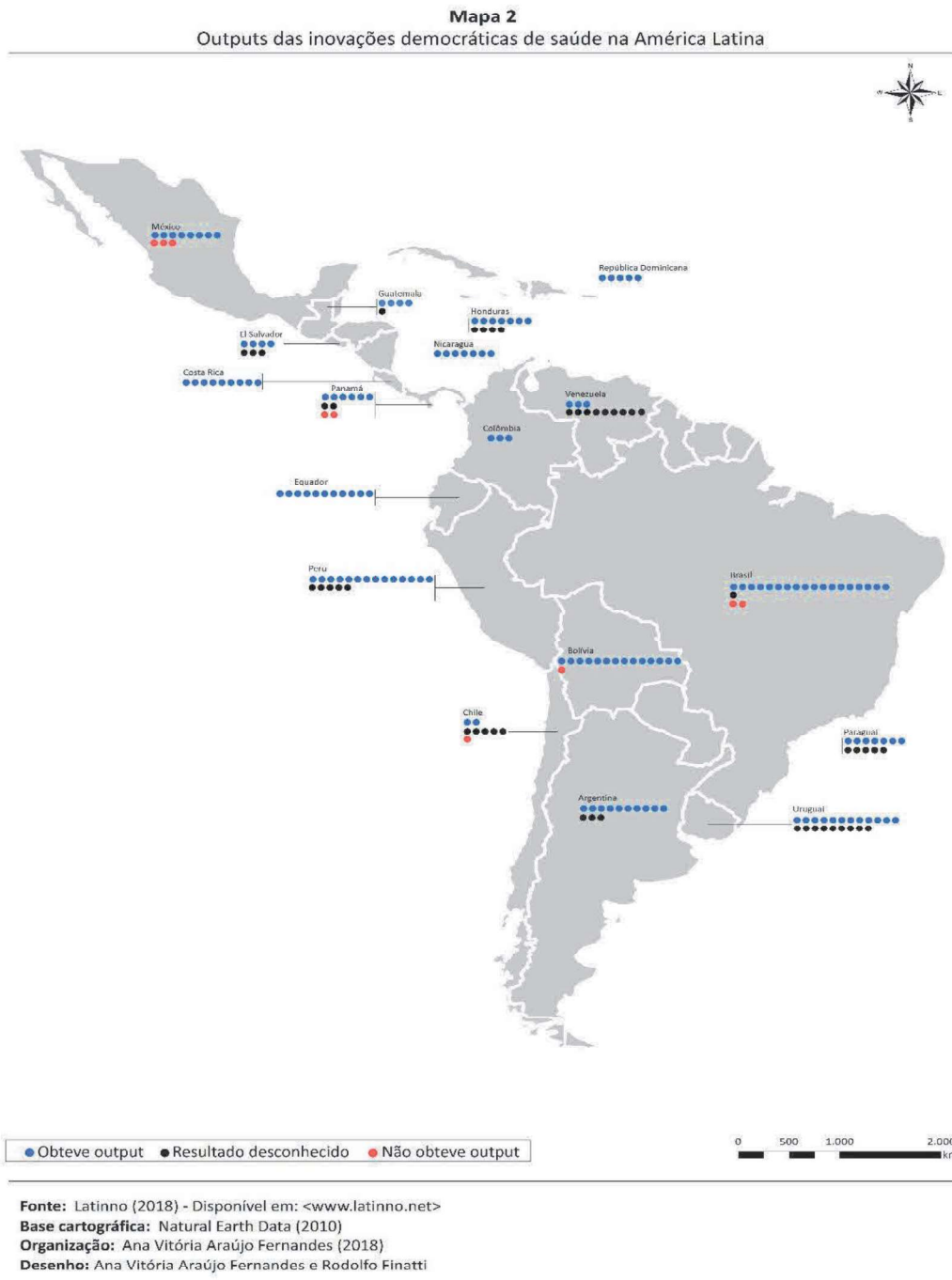
Mapa 1: Output das inovações democráticas da América Latina.

Outputs e outcomes são duas variáveis de impacto fundamentais para a avaliação das repercussões das inovações democráticas. De acordo com a existência de resultados – potenciais (outputs) ou efetivos (outcomes) – foi possível analisar a distribuição das inovações democráticas pela região. O mapa a seguir permite a visualização da distribuição das inovações na América Latina e Caribe segundo os outputs e outcomes obtidos.