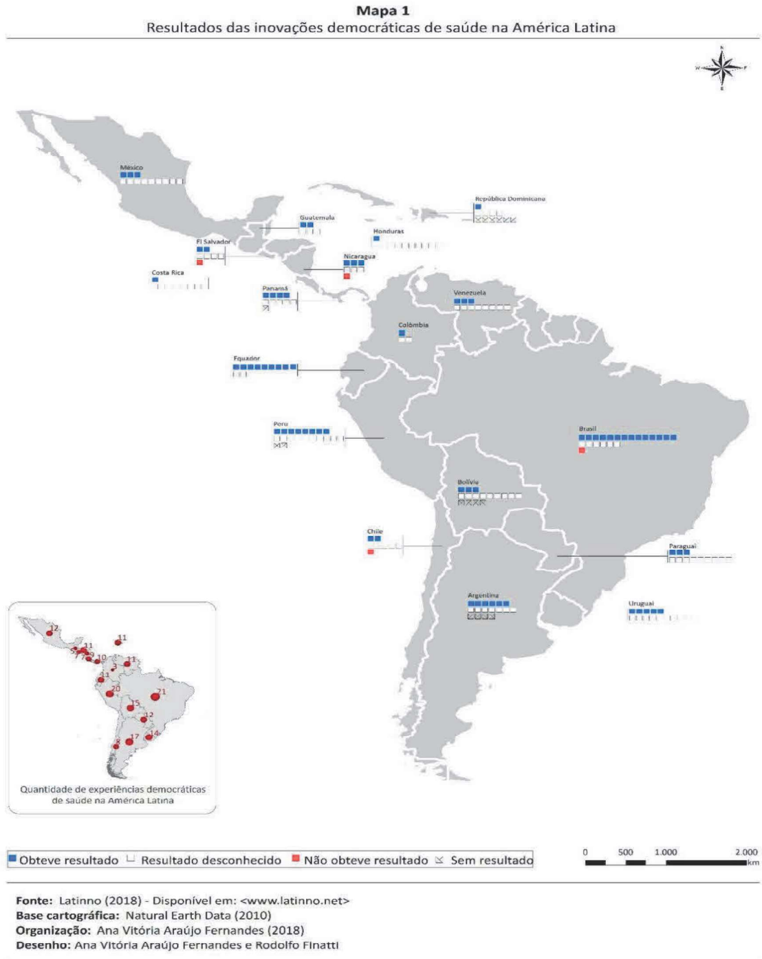
Mapa 2: Resultados (outcomes) das inovações democráticas em Saúde na América Latina.