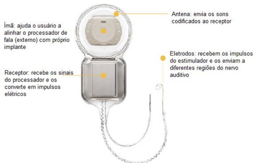
Figura 3 - Componente interno do Implante Coclear Fonte: Cochlear (35).