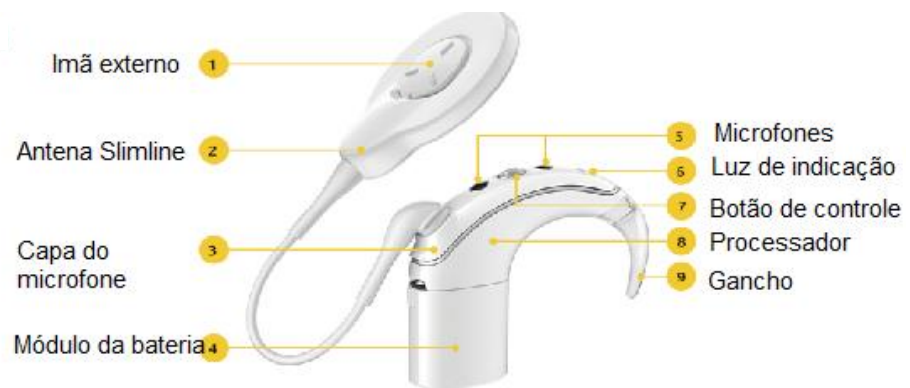
Figura 2 - Processador de fala, componente externo do Implante Coclear