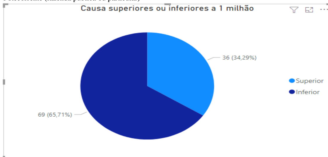
Gráfico 2 – Valor da causa inferior ou superior a R$ 1 milhão de reais julgados à luz da equidade quando o Recorrente (fazenda pública ou particular)

No gráfico, com base nos dados extraídos da SGE, e consolidado no Programa Power BI 23 , do total de 370 processos distribuídos à 1ª Turma e, dos 319 na 2ª Turma, 66 tiveram o mérito julgado pela Primeira Turma, enquanto a Segunda Turma julgou apenas 39. Desses recursos, 59 tiveram como recorrente a Fazenda Pública e 46 o particular. Os demais, conforme já relatado, não foram objeto de apuração para fins desta pesquisa.