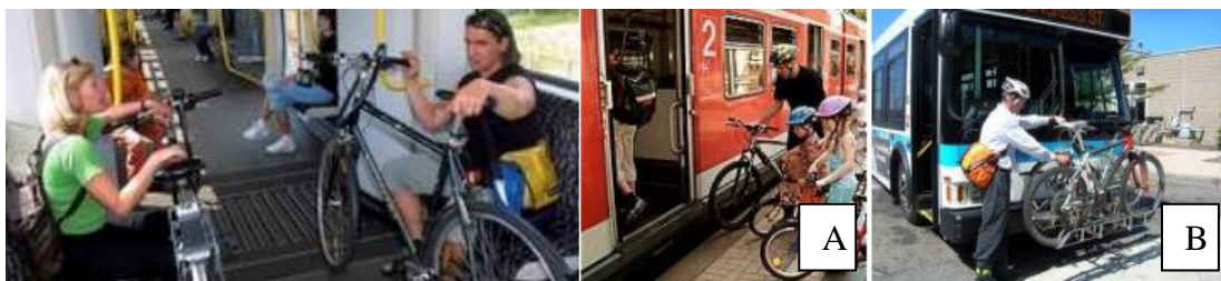
Figura 2 – Integração bicicleta – metrô (Alemanha) (A) e ônibus (Canadá) (B)

A infraestrutura cicloviária deve apresentar conectividade em seu percurso, possibilitando que o ciclista se locomova de forma rápida e segura, sem muitos desvios e paradas (RICCARDI, 2010). E, para que essa infraestrutura tenha qualidade e seja acessível, ela precisa ser integrada com os demais sistemas de tráfego da cidade, em especial ao sistema de transporte público de ônibus e metrô, o que possibilita uma mobilidade mais eficiente (CARDOSO; CAMPOS, 2016; PAIVA, 2013). A Figura 2 mostra a integração da bicicleta com diferentes modos públicos de transporte.