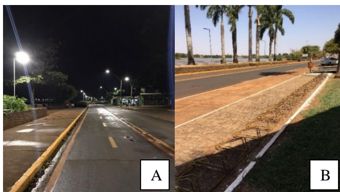
Figura 5 – Presença de iluminação eficiente (A) e paraciclos (B)

Para a situação de C, foram assinalados 6 itens, destacando a iluminação eficiente e a presença de paraciclo em frente a cicloestrutura. Tais conformidades são expostas na Figura 5.