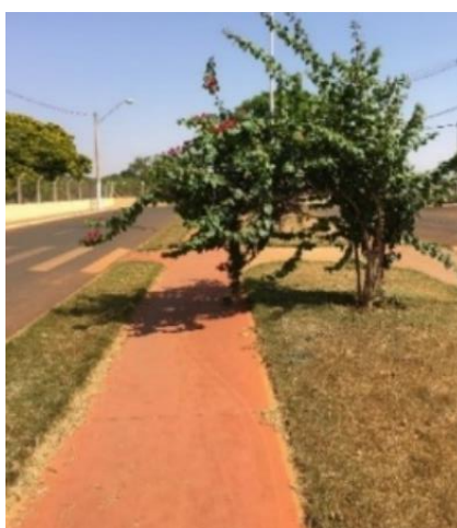
Figura 4 – Presença de obstáculo no trecho ciclável A

Já para a situação de I, foram assinalados 7 itens, entre eles está a largura útil da cicloestrutura, que por se tratar de uma ciclovia bidirecional, deveria apresentar 2,50 m de largura útil, porém apresenta 1,20 m. O trecho ciclável também apresentou presença de obstáculo como galhos de árvore impedindo o tráfego. Esta inconformidade está retratada na Figura 4.