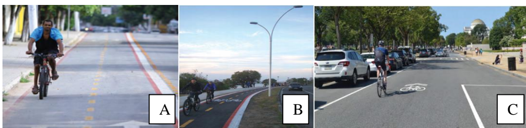
Figura 1 – Ciclofaixa em Divinópolis, MG (A), Ciclovia em Porto Alegre, RS (B), Ciclorrota em Washington, EUA (C)

A largura na cicloestrutura refere-se ao espaço destinado ao uso dos ciclistas. Esta dimensão varia de acordo com a direção do fluxo na via, a qual pode ser em sentido único (unidirecional) ou duplo (bidirecional) (BATISTA; LIMA, 2020). Em relação ao revestimento utilizado na infraestrutura cicloviária citam-se os asfálticos e os revestimentos à base de concreto. Estes últimos envolvem tanto o concreto moldado no local, como placas pré-moldadas e blocos intertravados de concreto (BRASIL, 2016). As cicloestruturas são categorizadas em três tipos: ciclofaixas, ciclovias e ciclorrotas, as quais são apresentadas na Figura 1 e tratadas a seguir.