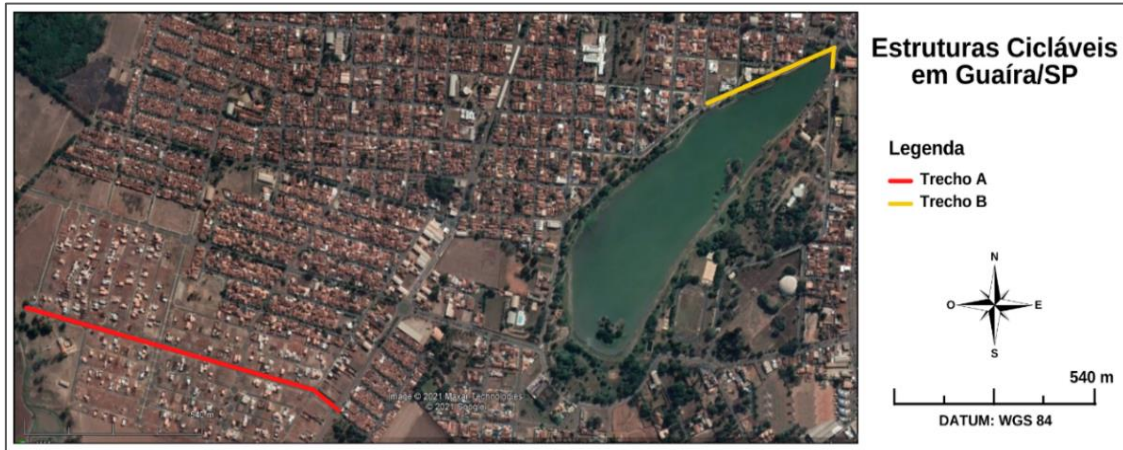
Figura 3 – Localização dos trechos cicláveis A e B na cidade de Guaíra/SP

18h15, em duas quintas-feiras, não próximas a feriados, conforme preconizado por ITDP Brasil (2018).