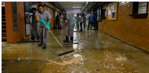
Funcionários limpam subsolo do ICC, principal prédio da UnB no campus do Plano Piloto, que ficou alagado em alguns pontos após chuva desta quarta (17)

Por Marcelo Cardoso*, G1 DF 16/05/2018 20h11 - Atualizado há 2 anos