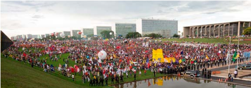
Figura 3: Manifestação contra a PEC 241 em Brasília DF Fonte: Jornalistas livres - Dezembro, 2016

Algumas instituições obtiveram sucesso em reivindicações internas específicas, para melhoria, por exemplo das salas de aula, de reforma em quadra esportiva, ou de melhoria da merenda escolar, ainda que a PEC 241, atual EC 95, considerada autoritária e ausente diálogo com a sociedade, tenha sido aprovada. No ano de 2018, vários alunos ocuparam novamente as instituições de ensino, devido aos efeitos do contingenciamento. No caso da Faculdade de Arquitetura e Urbanismo da UnB, foi deliberado em assembleia estudantil a greve dos alunos e a ocupação da Faculdade. Com impactos ainda maiores do que os previstos, a PEC 241, com vigência a partir de 2017, gerou vários problemas na administração da Universidade, e uma grande parte dos funcionários terceirizados foram demitidos, porteiros, seguranças, funcionários de serviços gerais, como manobra de contenção de gastos para continuidade de funcionamento da UnB, que foi um dos principais motivos para a reocupação dos espaços.