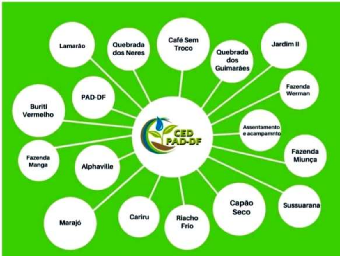
Figura 1: Algumas das comunidades atendidas pelo CED PAD-DF