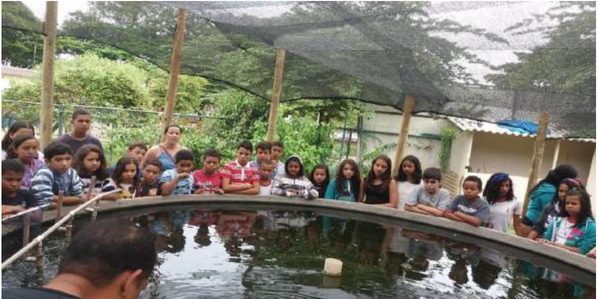
Figura 5: Estudantes das escolas vizinhas conhecendo o projeto Piscicultura na Escola

juventude camponesa nos espaços escolares e não escolares em face da importância política, social, cultural e econômica desse tema para a construção de um campo mais digno, feliz e com sustentabilidade da vida.