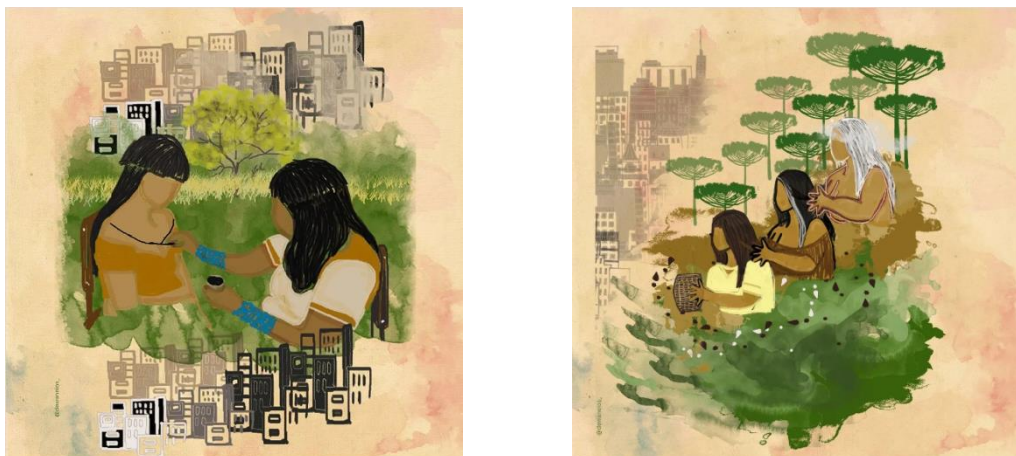
Figura 7 – Capa e ilustrações do caderno “Mulheres: corpos-territórios indígenas em resistência!”.

Entre a 1ª Marcha e a chamada para a 3ª Marcha, que ocorrerá na primavera de 2023, a relação com o Estado se modifica na linguagem das imagens. Nesse intervalo, as articulações de indígenas mulheres emergiram mais fortemente na cena pública, aldearam a política e agora figuram dentro do Congresso Nacional (Figura 8), trazendo não só uma proposta nova de sociedade, mas participando do poder político enquanto Deputada Federal, Ministra dos Povos Indígenas, presidenta da FUNAI e assumindo cargos diversos. Ocupam, assim, um lugar de tomada de decisões e dão outro tipo de encaminhamento às demandas e tensões dos movimentos na arena política. A mesma imagem da indígena mulher grávida, segurando seu maracá, agora está acompanhada de crianças e com raízes fincadas no Congresso Nacional, demarcando-o.