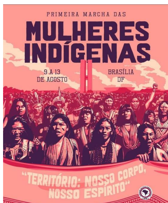
Figura 4 – Chamada para a 1ª Marcha das Mulheres Indígenas.

Em manifestações, mostram que estão fincadas na terra como uma árvore. O território é a própria vida, corpo e espírito, afirmam. “Perder território é perder nossa mãe. Quem tem território, tem mãe, tem colo. E quem tem colo tem cura”. Enquanto cuidam do território, sustentam a vida na Terra: “Somos responsáveis pela fecundação e pela manutenção de nosso solo sagrado. Seremos sempre guerreiras em defesa da existência de nossos povos e da Mãe Terra”, politizando seus corpos em um campo de ação. Na Figura 4, a divulgação da 1ª Marcha evidencia a relação das indígenas mulheres com o Estado, naquele momento, representado pelo Congresso Nacional ao fundo, enquanto elas marcham em coletivo, com braços erguidos e entoando palavras de ordem. Nessa imagem, são muitas, e entre elas há duas indígenas mães com suas filhas no colo. Há o entendimento de que seus corpos são políticos. Com suas pinturas de jenipapo e urucum, com seus cantos e danças, apoiam um corpo ao outro. Nessa orquestração corporificada se apresentam na reivindicação por reconhecimento e valorização da vida dos Povos Indígenas. Exigem a demarcação de seus territórios e a demarcação de demais espaços políticos para garantir o futuro dos seus.