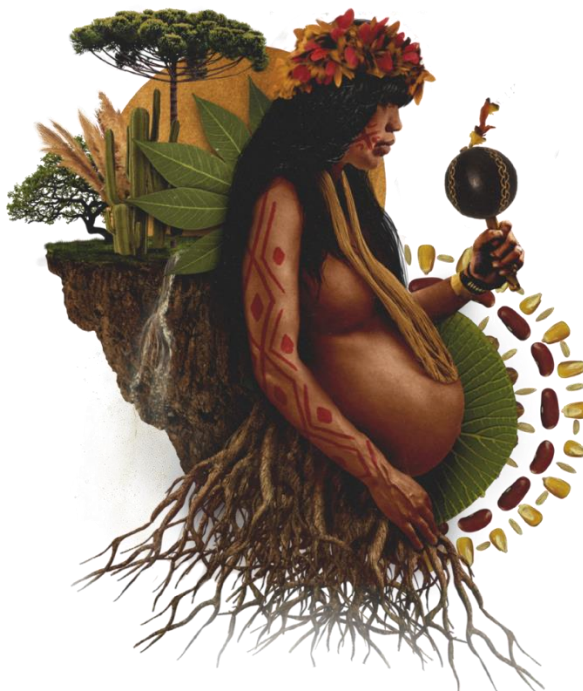
Figura 6 – Arte do portal da Articulação Nacional das Mulheres Indígenas Guerreiras da Ancestralidade (ANMIGA).

Foi no contexto da 2ª Marcha que a ANMIGA 135 foi criada, como resultado dos debates ocorridos no XV ATL, de 2019. A Figura 6 foi retirada do portal da ANMIGA e nela observa-se também a preocupação com a representação dos seis biomas brasileiros, colocando outro elemento na intersecção de suas experiências do chão da aldeia ao chão do mundo.