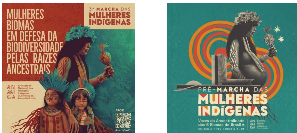
Figura 8 – Chamada para a 3ª Marcha das Mulheres Indígenas.