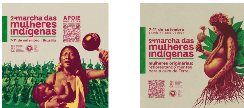
Figura 5 – Chamada para a 2ª Marcha das Mulheres Indígenas.

Nas imagens de divulgação da 2ª Marcha (Figura 5), há uma referência mais evidente da conexão das indígenas mulheres com diversos elementos (água, solo, raízes, folhas, sementes e árvores). A indígena, com sua pintura corporal, está grávida ou amamentando.