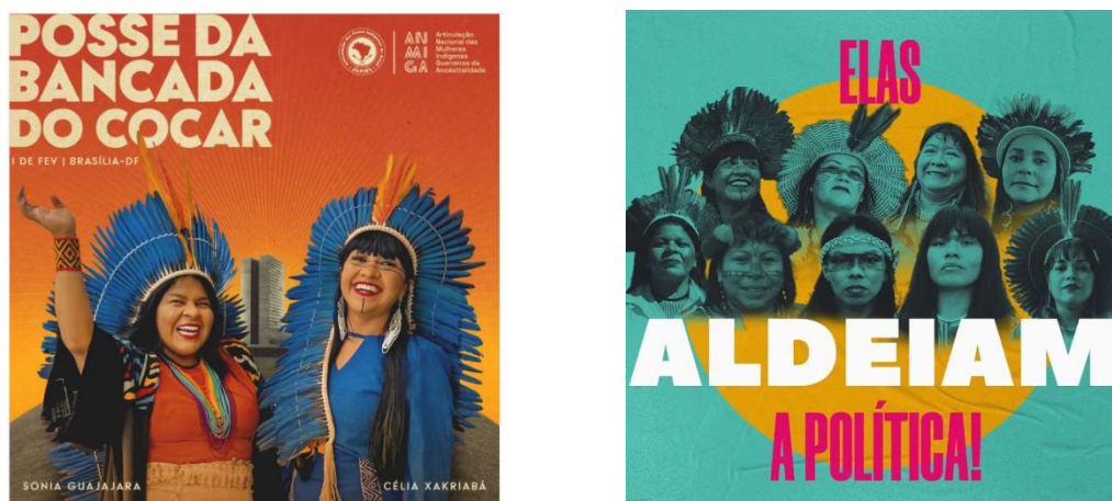
Figura 1 – Posse da Bancada do Cocar e Indígenas Mulheres aldeando a política.

diante dos ataques da gestão Bolsonaro, a resistência do Movimento Indígena se fez protagonista em lives , nas redes sociais, publicações, produções audiovisuais (com destaque para a série “Maracá – Emergência Indígena”) e mobilizações históricas, conquistando apoio da sociedade envolvente, além das ações judiciais apresentadas contra a gestão do Governo Federal (como a denúncia apresentada ao Tribunal de Haia pela APIB e a Ação Civil Pública, em conjunto com a Defensoria Pública da União, pedindo, entre outras providências, a exoneração de Marcelo Xavier da presidência da FUNAI) e as denúncias levadas à ONU (no Conselho de Direitos Humanos das Nações Unidas, em 2021, e durante o Fórum Permanente das Nações Indígenas para as Questões Indígenas, em 2022). Em 2022, as eleições foram marcadas pela ordem: “Aldear a política” (Figura 1), e em nenhum outro momento da história do Estado brasileiro tantas candidatas indígenas estiveram nas disputas eleitorais 36 .