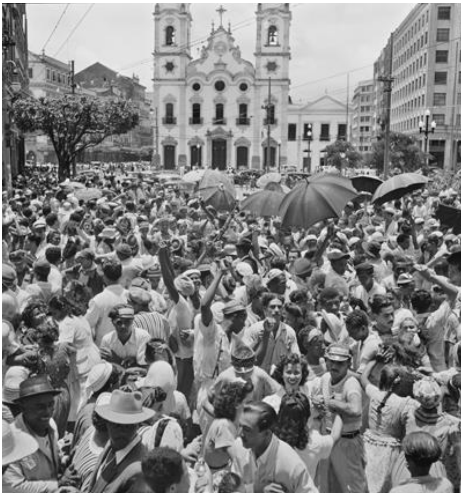
Fig. 3: Recife. Fonte: Pierre Verger ©Fundação Pierre Verger, 1947.