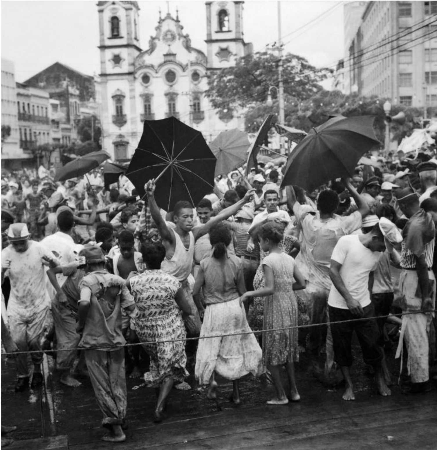
Fig. 4: Carnaval de rua em frente à Igreja Matriz do Santíssimo Sacramento de Santo Antônio.

Uma década depois, o carnaval na Pracinha era novamente objeto de registro fotográfico, agora através das lentes de Gautherot, como vemos na figura 4: Matriz de Santo Antônio ao fundo e à frente, em primeiríssimo plano, talvez ao som de “Evocação” (FERREIRA, 1957), a janela fotográfica aberta por Gautherot mostra um cordão, em cujo lado de lá se pode ver o piso da rua onde o carnaval participante se assenta, enquanto do lado de cá a passarela de um carnaval espetáculo revela-se no tabuado que cobre o piso da rua. De acordo com Lima (2018, p. 230), nos anos 1950, o carnaval se institucionalizava, passando a ser responsabilidade do poder público municipal e, enquanto tal, perdia muito do seu caráter livre. Ainda é Lima (2018, p. 226) quem afirma serem os anos 1960 aqueles em que imperava a disputa entre dois tipos de festa que nos fins da década anterior, apresentava-se no Recife: os carnavais espetáculo e participação.