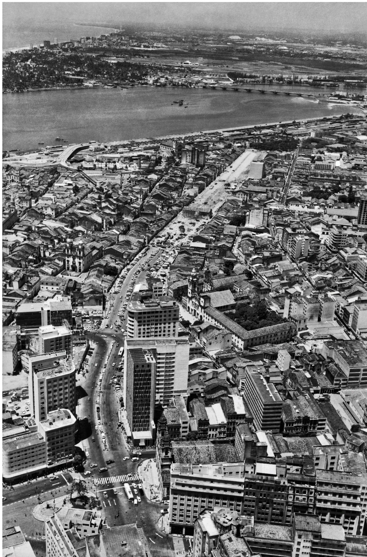
Fig. 1: Dantas Barreto.