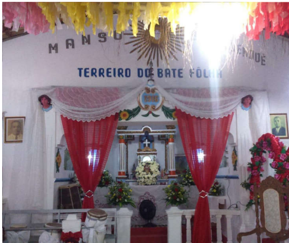
Figura 02: Peji do Bate Folha baiano

Estive no Bate Folha baiano em dezembro de 2016, junto à mameto Mabeji e uma comitiva formada por algumas/uns de suas/seus filhas/os de santo, para a cerimônia dos 100 anos da fundação do terreiro, dedicada à inquice Bamburucema, deusa das tempestades (como Kaiango), santa protetora e dona da casa. Chamam a atenção no local as diversas árvores sagradas jeje que foram plantadas nos tempos daquele Calundu colonial. Estas plantas – velhas e enormes em tamanho – coexistem com outras árvores sagradas angoleiras, também imensas e numerosas no terreiro. Também chama a atenção o belíssimo e antigo peji (altar central) do barracão, que lembra (propositalmente) o altar de uma Igreja Católica, porém guarda segredos por trás de seus panos. A figura 02, a seguir, mostra o centenário e tombado peji do barracão do Manso Banduquenquê, no dia da festa de 100 anos da casa.