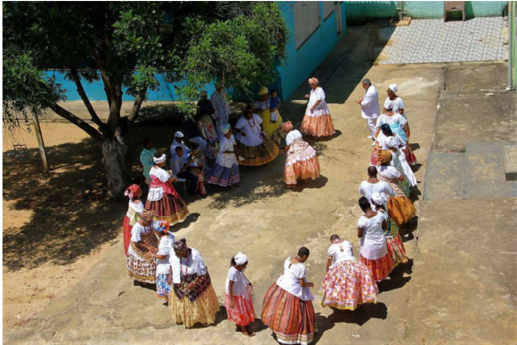
Figura 06: Gira na porta do barracão