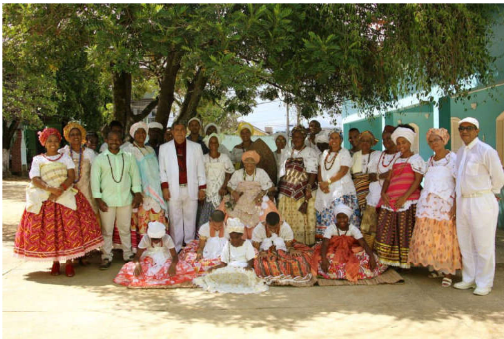
Figura 04: Família de santo da mãe Mabeji