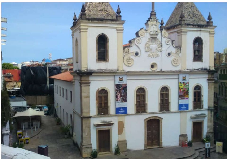
Figura 01: Igreja da Barroquinha em dezembro de 2016 Detalhe aos fundos, coberto por lona preta, edifício de estacionamentos sendo construído no local onde ficava o terreiro da Barroquinha

Onde no passado funcionava a Igreja da Barroquinha hoje funciona um museu. Externamente, o edifício ainda tem a fachada da igreja, mas foi internamente modificado para funcionar como um centro de eventos e não mais templo religioso. Nos fundos, onde ficava o barracão do terreiro de Iya Nassô, há um prédio com estacionamento de carros, que pertence a um hotel, localizado no bairro da Barroquinha. Do antigo terreiro, portanto, mesmo o espaço aberto e possíveis vestígios soterrados atrás da igreja já não podem mais ser recuperados. A figura 01 a seguir, uma foto de dezembro de 2016, mostra a fachada da igreja com a construção do estacionamento aos fundos (envelopada em lona preta).