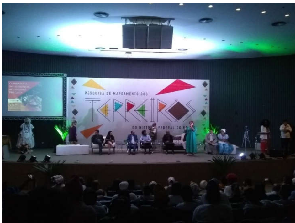
Figura 10: Apresentação do Mapeamento de Terreiros do DF e Entorno Fonte: dados da pesquisa

A figura 10, abaixo, mostra a mesa formada por representantes do Estado, da UnB e das religiões afro-brasileiras, durante o lançamento do mapeamento. Destaque para a Deputada Érica Kokay, que no momento da foto tinha a fala – e para a mãe de santo, à direita do campo de visão fotografado, sentada em cadeira desconfortável (banco improvisado, sem encosto) em meio às/aos representantes do Estado, todas/os em cadeiras melhores.