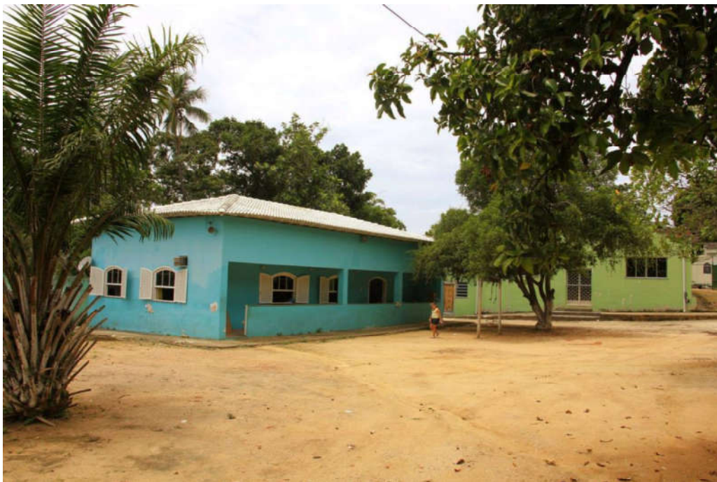
Figura 05: Foto parcial de construções no terreiro

As duas figuras a seguir mostram uma foto parcial de duas das construções do Bate Folha carioca, tiradas da porta da rua (figura 05); e uma gira sendo realizada do lado de fora do barracão (figura 06).