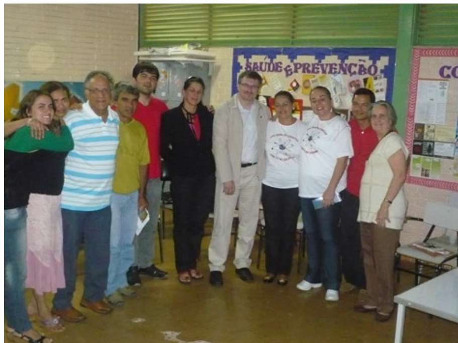
22 – Conselho escolar do CEM 03 Ceilândia.