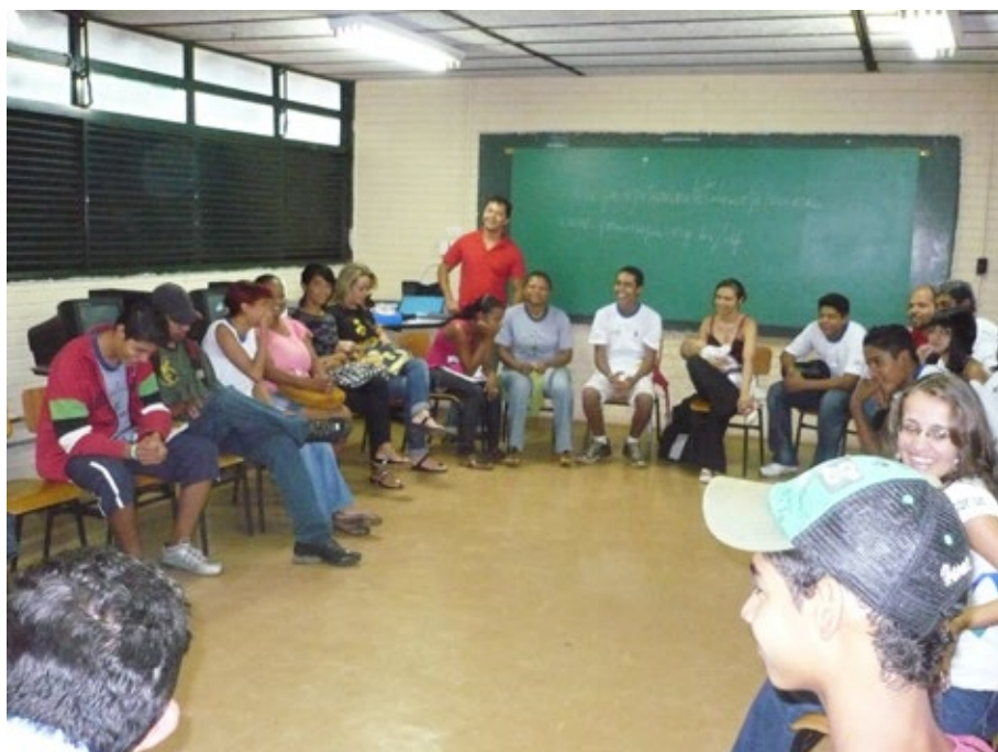
30 - Construção Coletiva do Conhecimento.