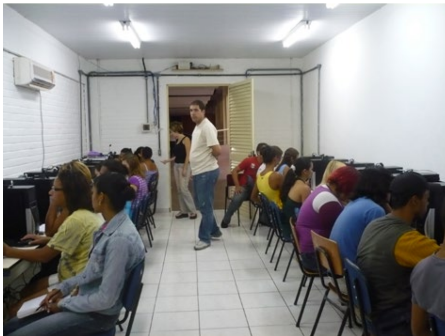
13 – Curso de Ciberarte I no CEP-Ceilândia.