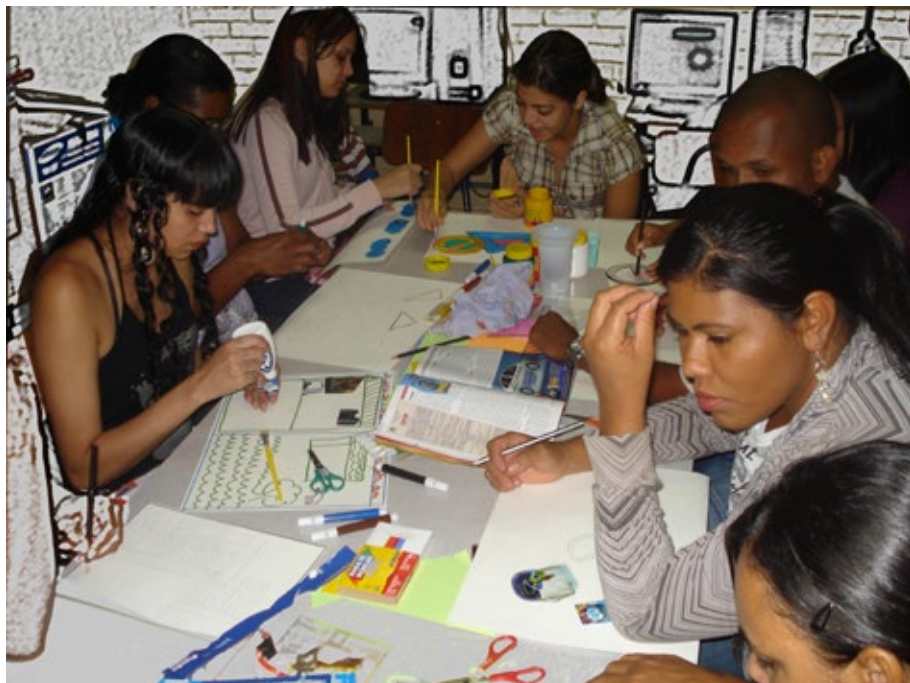
24 - Criação artística coletiva.