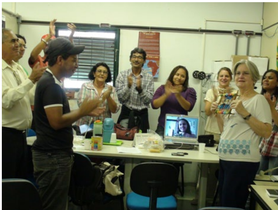
05 - Coordenação Coletiva.