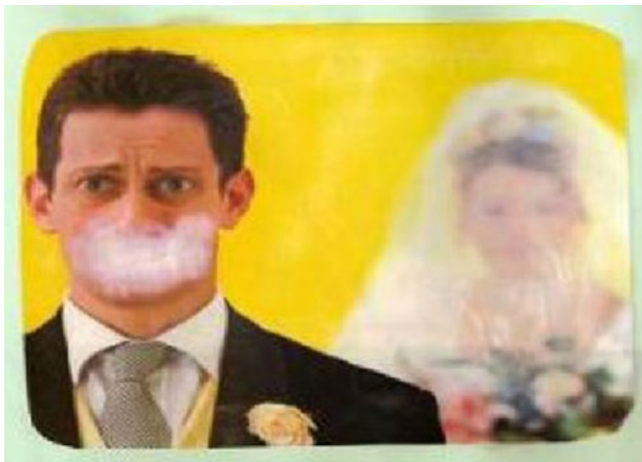
06 - O casamento.