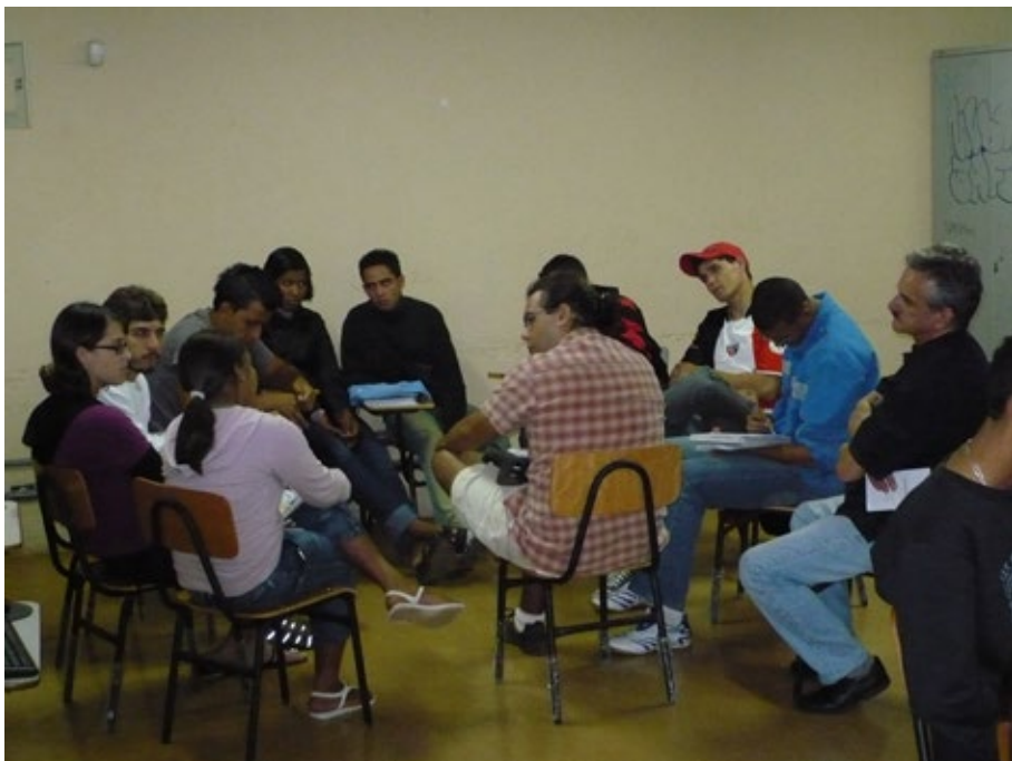
20 – Geração de temas.