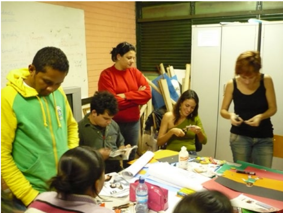
12 – Processo de Criação artística.