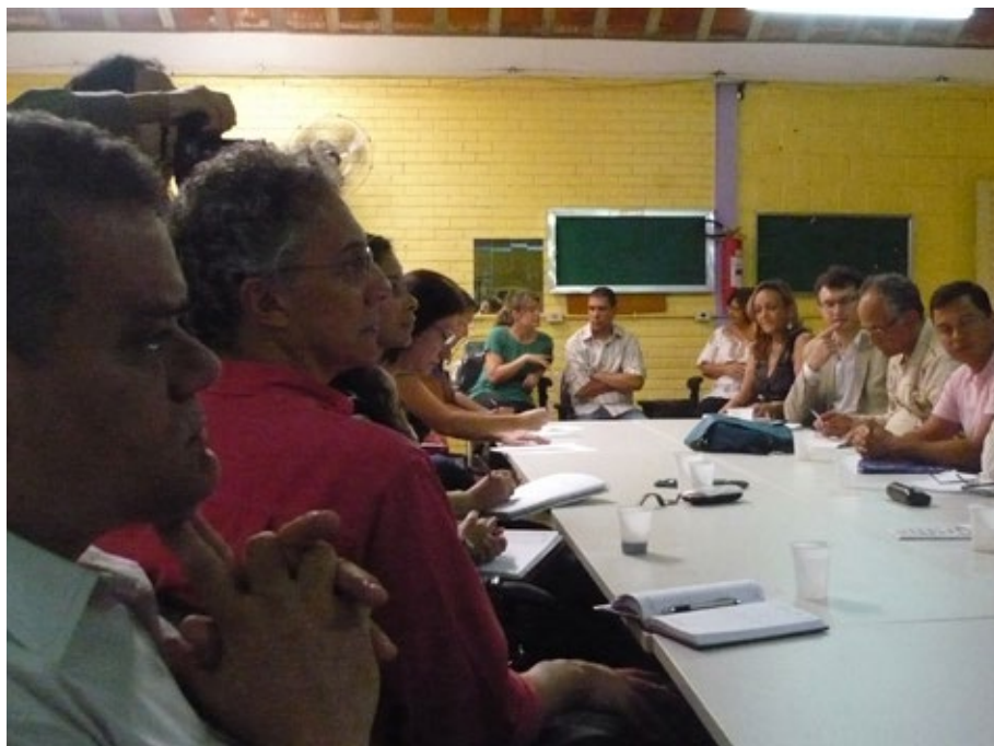
18 - Encontro coletivo UnB, SEEDF, IFB, CEM03 no CEP Ceilândia.