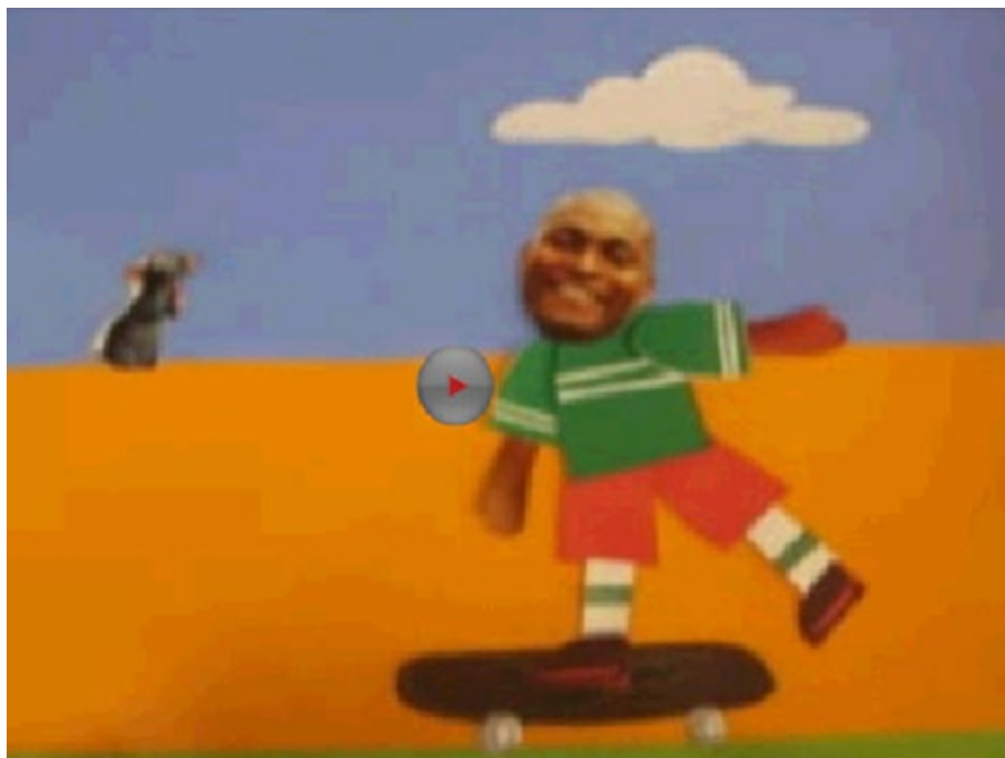
09 - Animação "Tribus".