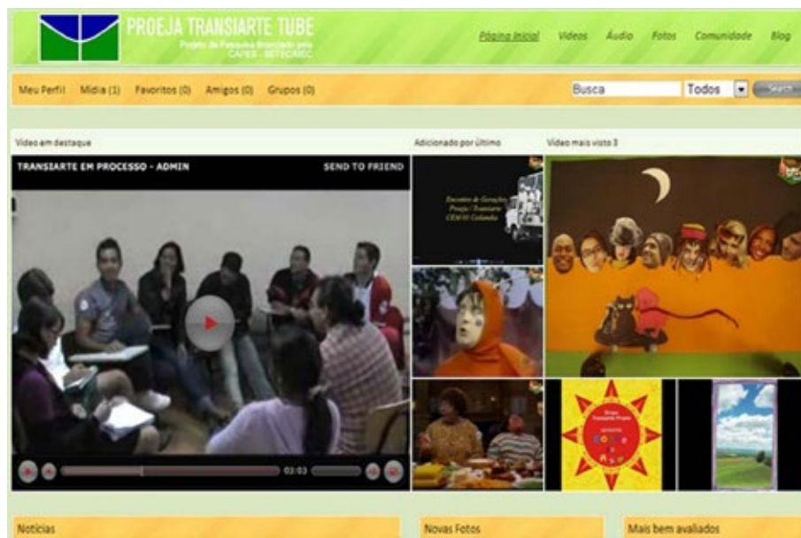
32 – Primeira interface do site www.proejatransiarte.ifg.edu.br.