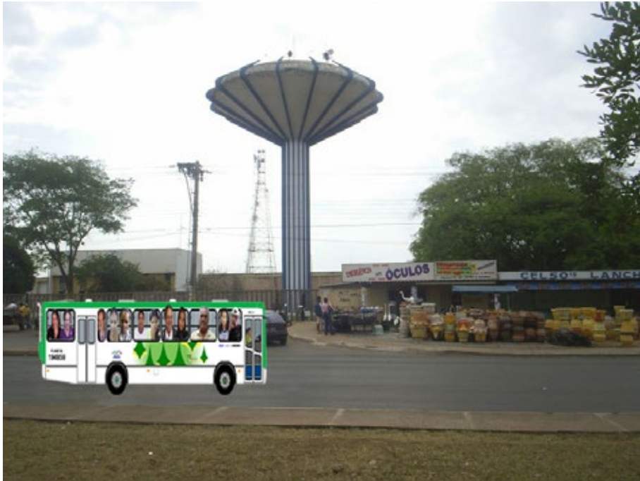
27 – Experiência artística coletiva de fotomontagem “Encontro de gerações”.