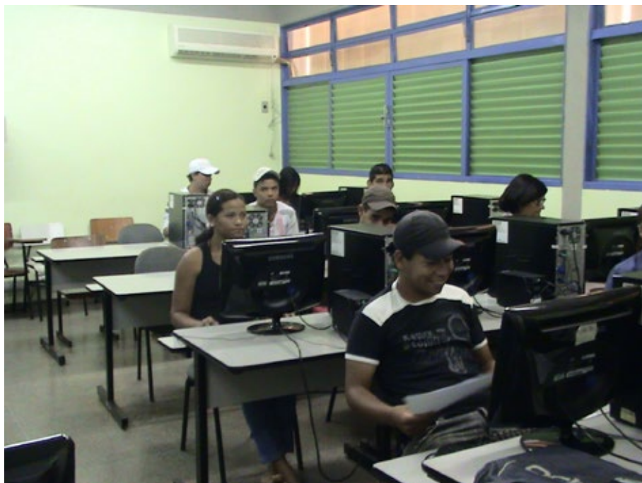
02 – Coordenação Coletiva.