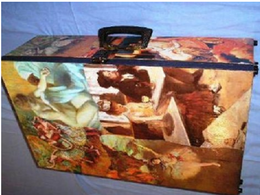
08 – Mala Transarte. Fonte: PROEJA-Transarte