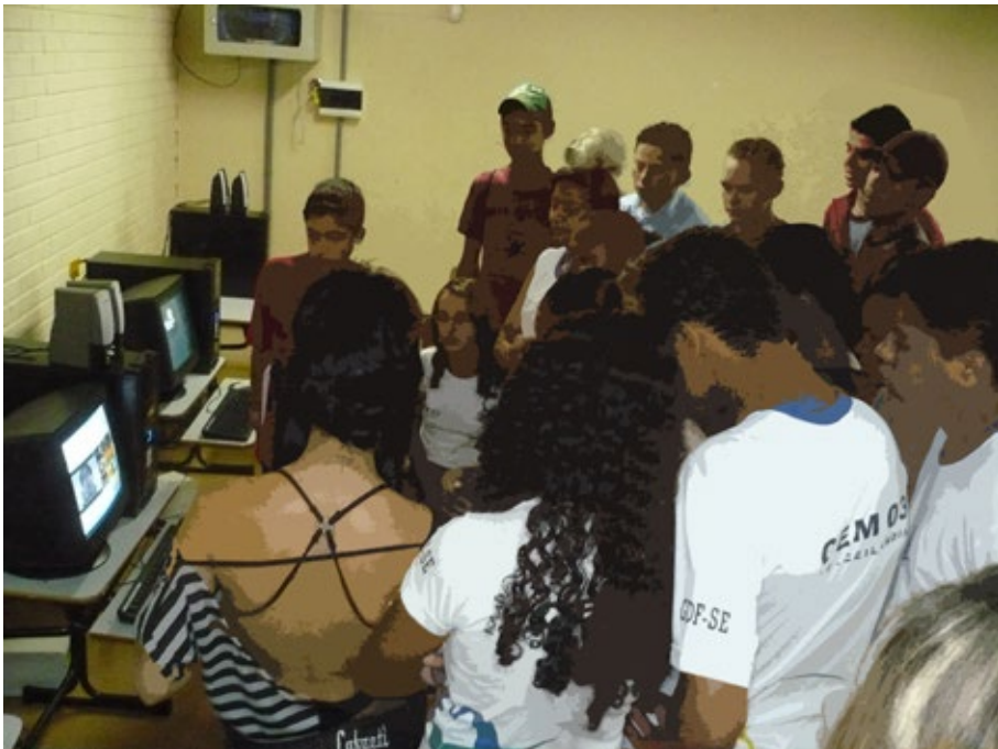
36 – Pesquisa-ação.