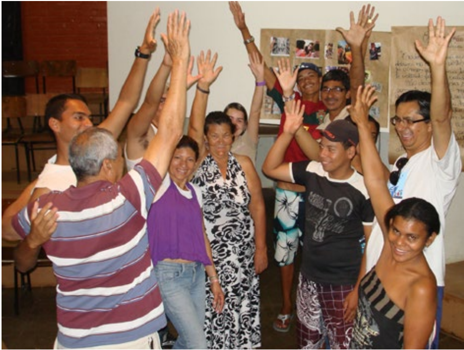
03 - Coordenação Coletiva.