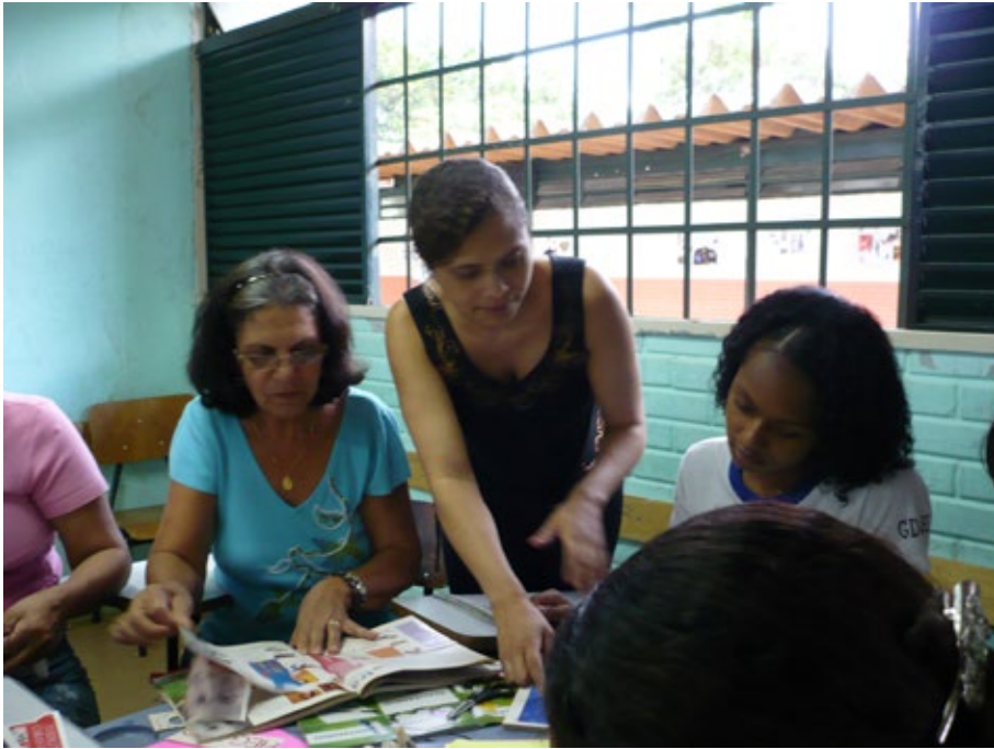
11 – Processo de Criação artística Coletiva.