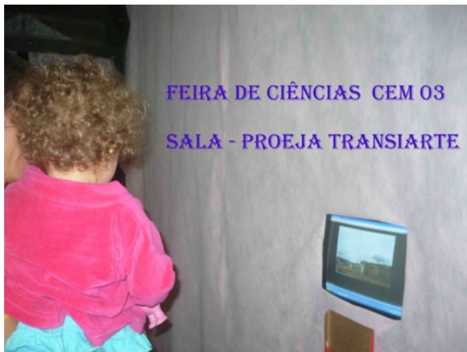
33 - Curso Ciberarte I.