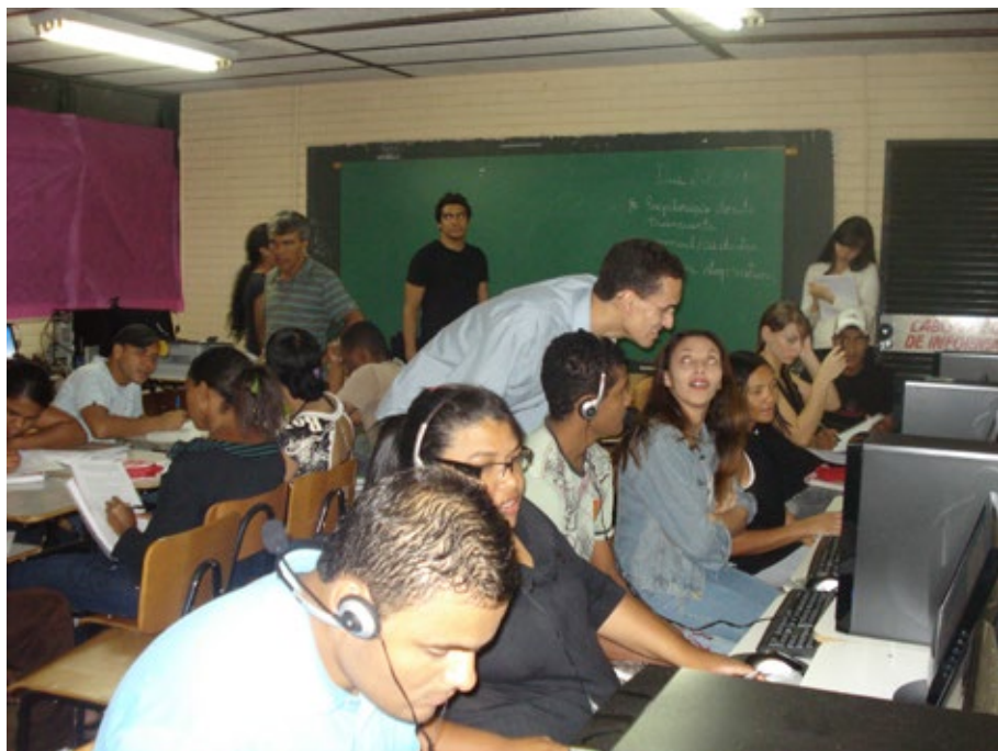
26 – Postagem na Galeria Transarte.