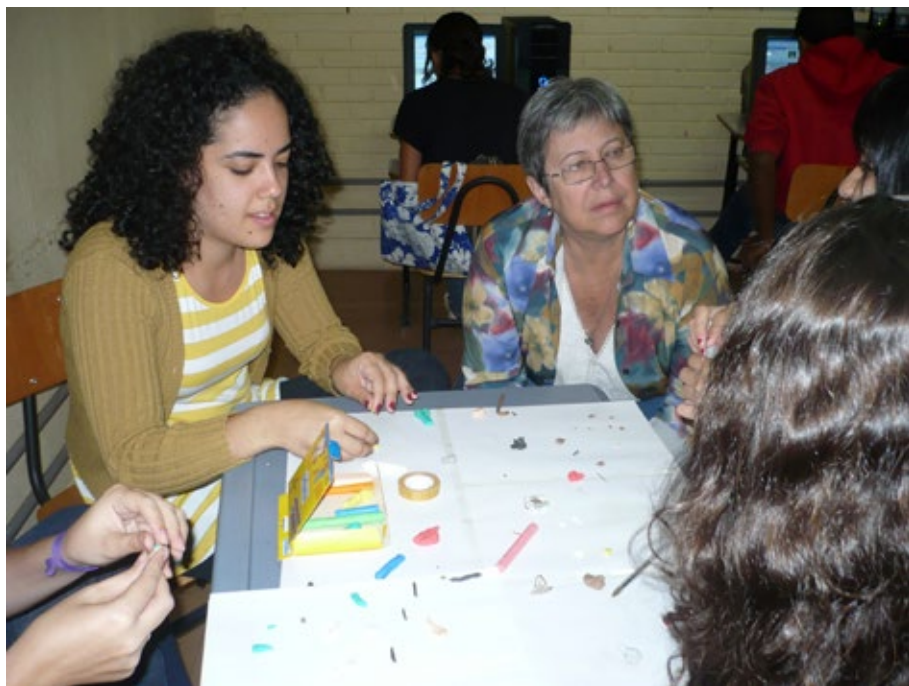
25 – Criação artística coletiva.