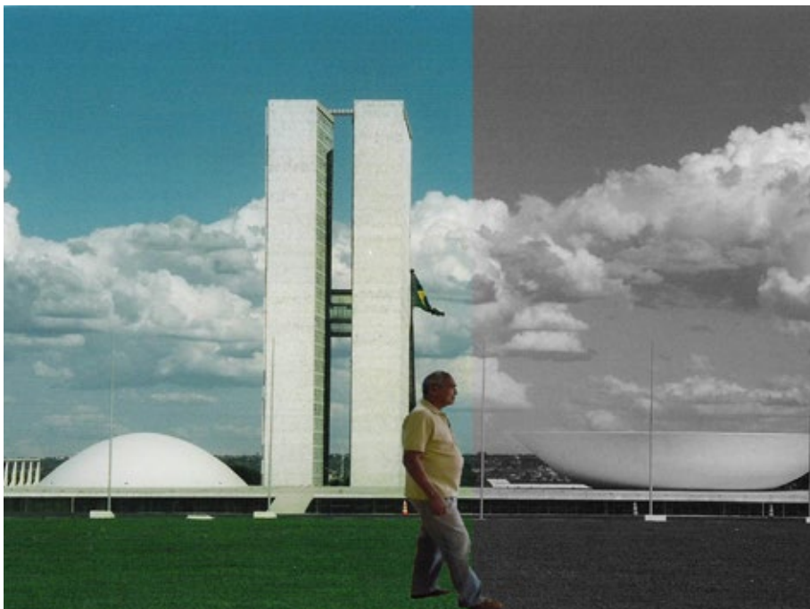
28 – Experiência artística coletiva de fotomontagem “Encontro de gerações”.