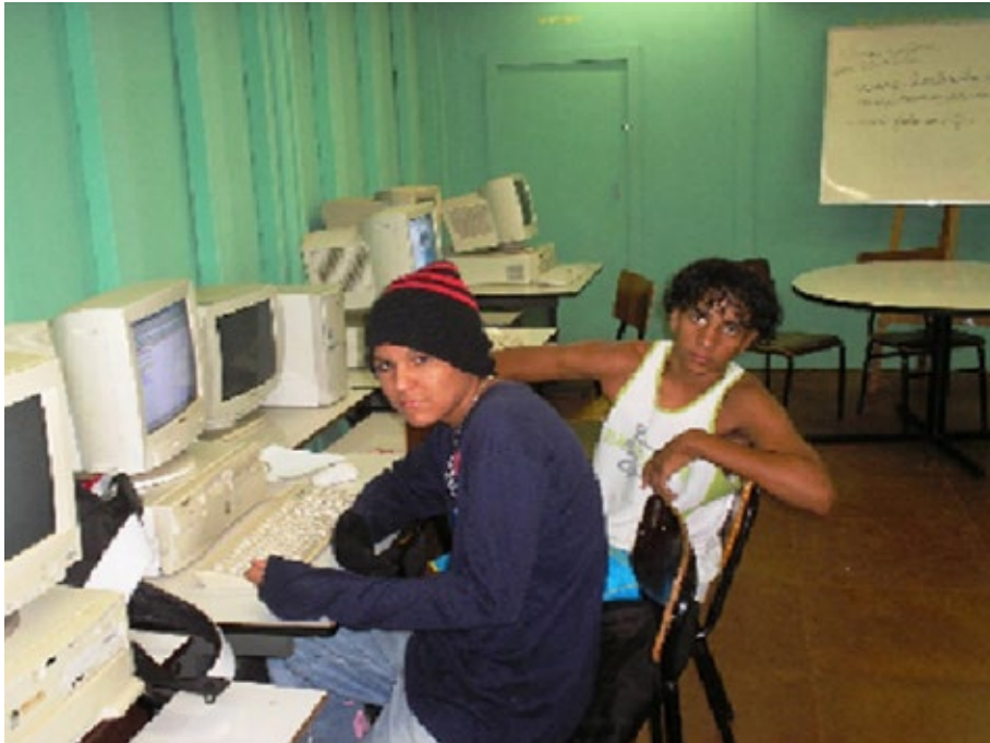
07 – Jovens produzindo vídeo Nas Barras do PROEM.