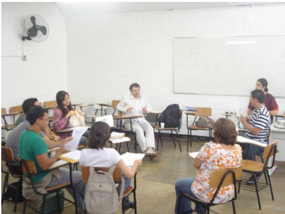
16 – Encontro coletivo UnB, CEM03 e CEP Ceilândia.