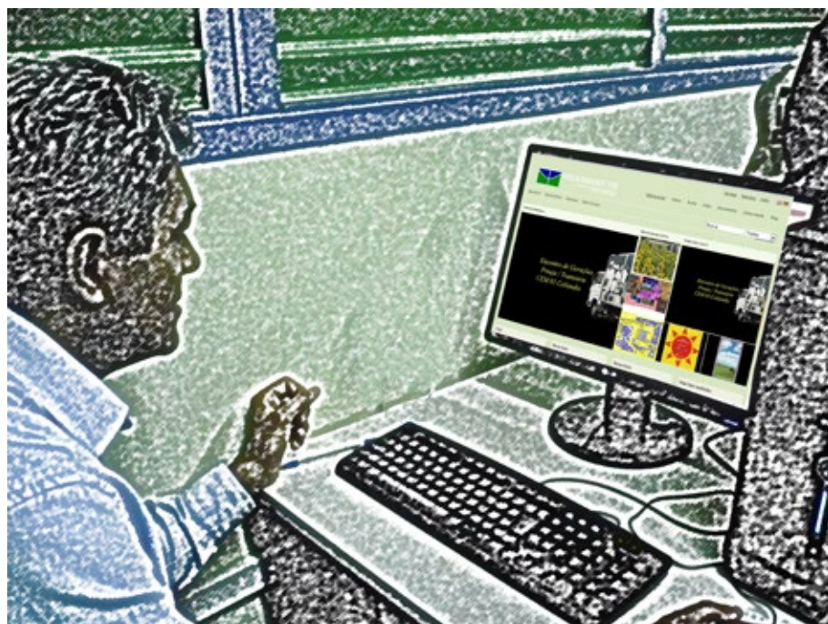
34 - Instalação da Transarte no CEM 03 de Ceilândia.