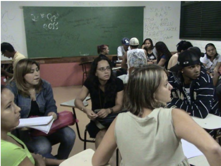
04 - Coordenação Coletiva. Fonte: PROEJA-Transarte