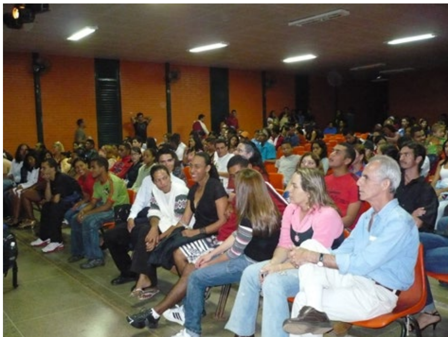
10 - Apresentação de "Tribus" no CEM 03.