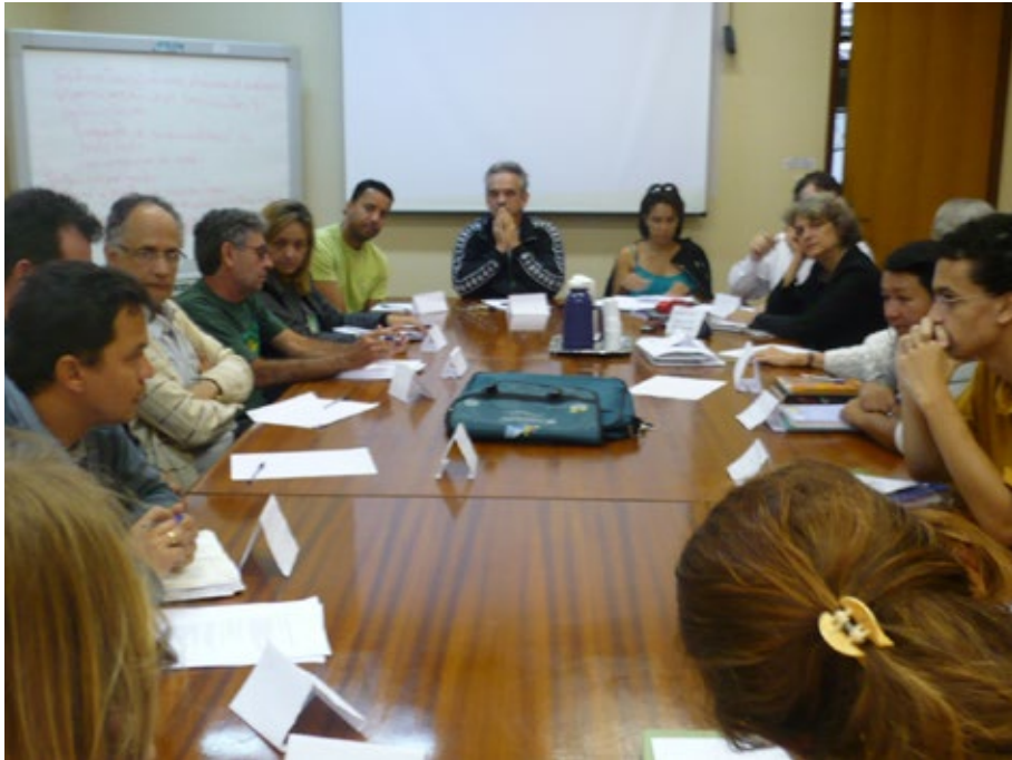
15 – Encontro coletivo SEEDF, IFB,CEM03, CEP Ceilândia na UNB.