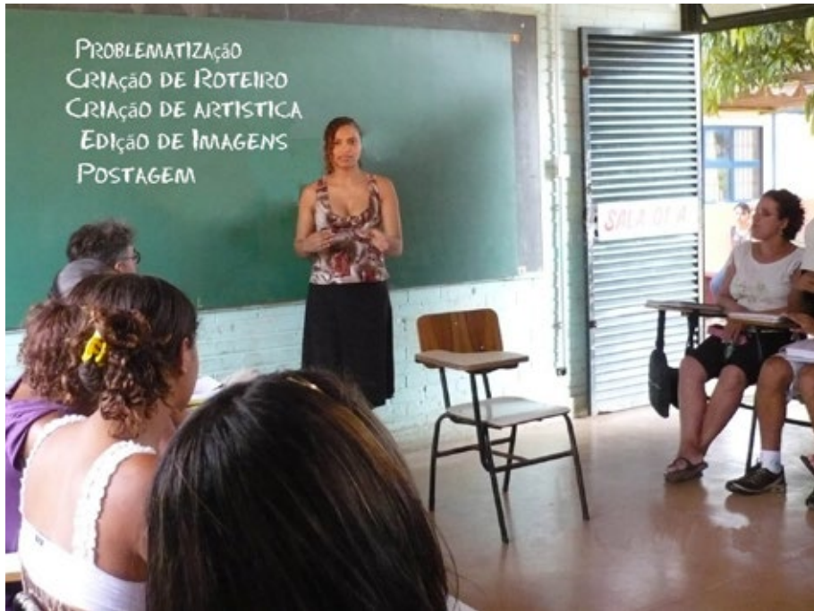
23 - Etapas da oficina transiarte - Construção do roteiro.