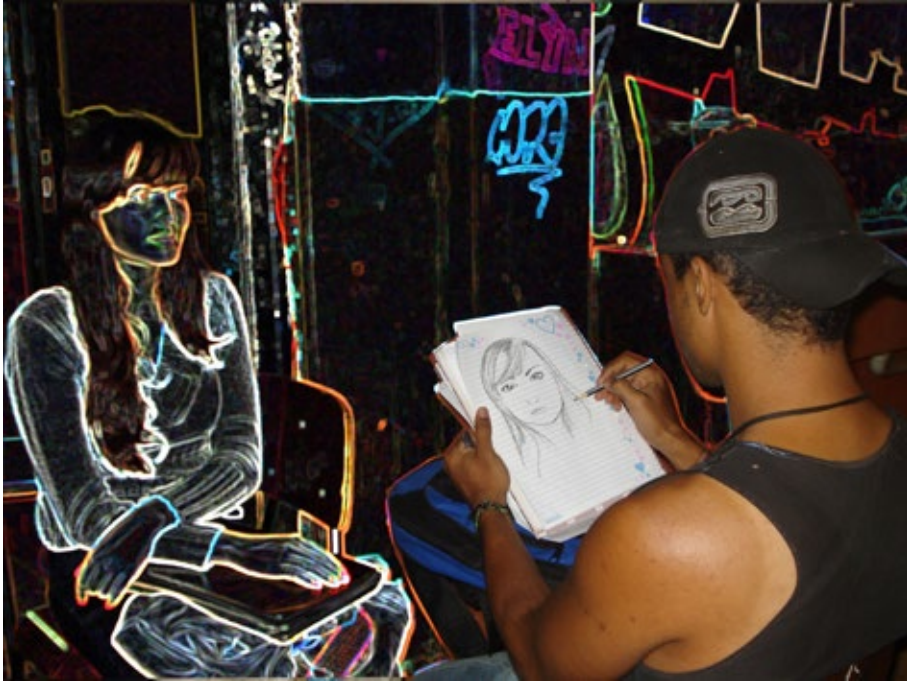
35 – Oficina transiarte no CEM CEM 03 de Ceilândia.