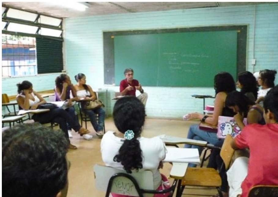
17 - O convite.