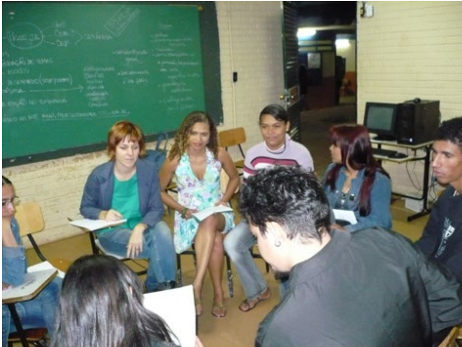
19 – Geração de temas.