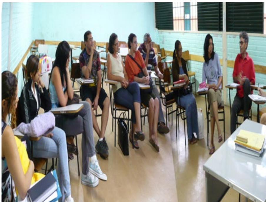
21 – Situações-problemas-desafios.