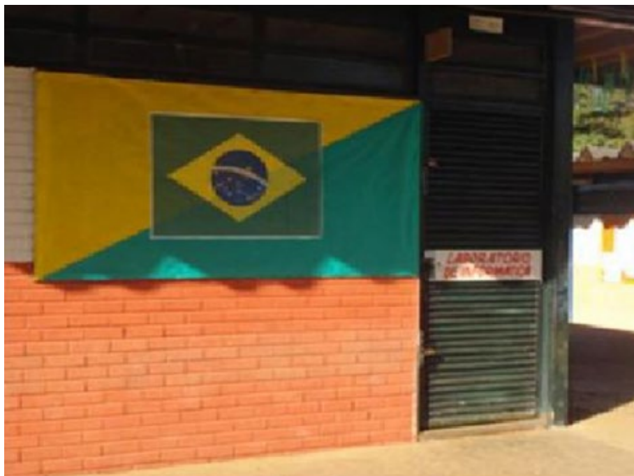
14 – Laboratorio de informática CEM 03 Ceilândia.