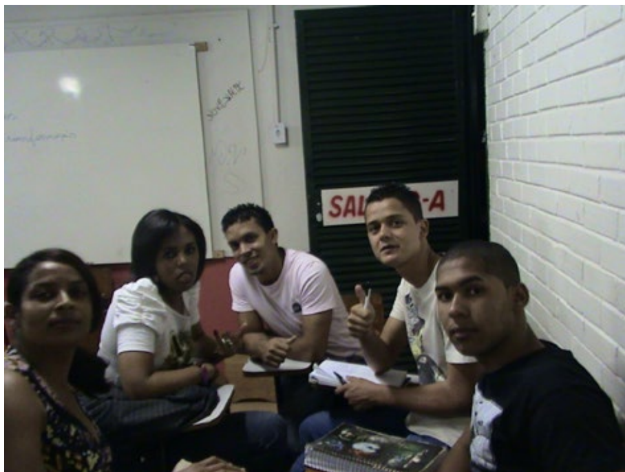
01 – Coordenação Coletiva.