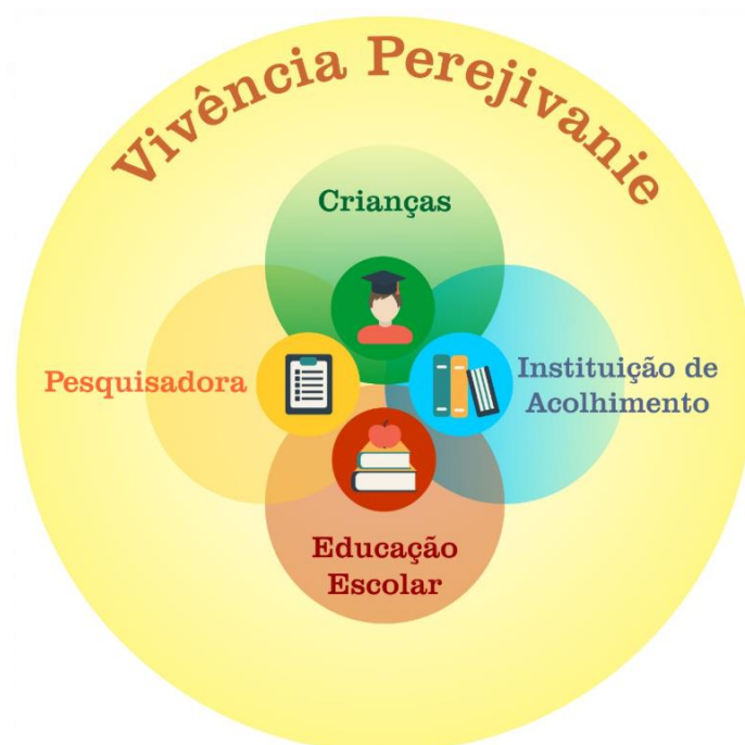
Figura 02: Vivências intergeracionais das experiências das infâncias

uma condição social engendrada em uma cultura, tendo como cenário um sistema excludente e opressor das classes dominantes.