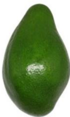
Figura 2 – Cultivar ‘Geada’; São Gotardo – MG, 2019

A cultivar ‘Geada’, conhecida antigamente por ‘Barbieri’ surgiu de um pé franco em Arthur Nogueira – SP; pertence ao grupo flora B; o fruto tem formato piriforme de base angular, pesa em média 700 gramas, com casca verde e lisa de aparência brilhosa (Figura 2). A polpa apresenta baixo teor de óleo (3,2%), de cor amarelo creme com poucas fibras. Com rendimento de polpa de 80% com caroço pequeno e aderente. Considerado uma cultivar precoce, com safra de novembro a janeiro dependendo da região. (SOARES et al., 1986; ABPA, 2019)