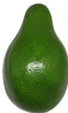
Figura 4 – Cultivar ‘Quintal’; São Gotardo – MG, 2019

A cultivar ‘Quintal’ é uma das mais conhecidas no Brasil, chamado popularmente de abacate manteiga, surgiu de um cruzamento de variedades das raças guatemalense e antilhana, pertence ao grupo floral B, contudo já foi visto que apresenta boa autopolinização (Figura 4). Os frutos apresentam casca verde e lisa, são grandes (500 a 900 gramas), de formato piriforme com pescoço, polpa amarela e sem fibras, com caroço relativamente solto e de tamanho médio. Período de safra, dependendo sempre da região pode ir do final de fevereiro a início de agosto (KOLLER, 1992; ABPA, 2019).