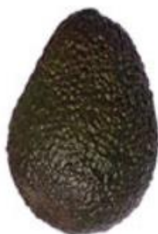
Figura 1 – Cultivar ‘Hass’; São Gotardo – MG, 2019

pertence ao grupo floral A e pode ficar até seis meses na planta depois de ter atingido a maturação fisiológica, assim estendendo a colheita (Figura 1). Tem alto nível de óleo (18 a 25%) e gorduras monoinsaturadas, além níveis elevados de vitaminas antioxidantes (A,C e E), se tornando um dos frutos mais nutritivos com um polpa de sabor manteiga, sem fibras e aderente ao caroço pequeno, com a colheita média pra tardia dependendo da região, Surgiu de um provável cruzamento natural de variedades provindas das raças mexicana e guatemalense. (TEIXEIRA, 1991; KOLLER, 2002; MICKELBART et al., 2007; JAGUACYR, 2016).