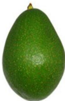
Figura 6 – Cultivar ‘Fortuna’; São Gotardo – MG, 2019; Fonte: ABPA

A cultivar ‘Fortuna’ foi selecionada em Campinas – SP nos anos 60 e foi propagada pelo viverista Armindo Benati, faz parte do grupo floral A, seus frutos apresentam casca lisa verde escuro, polpa amarela e adocicada, sem fibras, com baixo teor de óleo, e seu caroço é solto, formato piriforme e sua massa varia de 600 a 1000 gramas (Figura 6). É resistente a doença verrugose ( Sphaceloma persea ) e seu período de colheita começa final de janeiro e se estende até começo de agosto (KOLLER, 2002; ABPA, 2019).