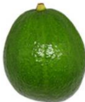
Figura 3 – Cultivar ‘Margarida’; São Gotardo – MG, 2019

características da raça guatemalense como a coloração castanho arroxeadado das brotações novas, é resistente a verrugose ( Sphaceloma persea ) e tolerante a antracnose (Figura 3). É considerado uma cultivar tardia, tolerante a baixas temperaturas, com fruto em formato redondo, grande com média de 750,18 gramas, de casca verde escuro, grossa e rugosa. Polpa verde clara, sem fibras e aderente ao caroço, com baixo a médio teor de óleo e alto rendimento de polpa (KOLLER, 2002).