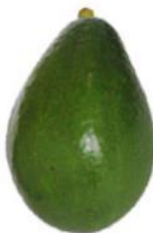
Figura 7 – Cultivar ‘Breda’; São Gotardo – MG, 2019; Fonte: ABPA

fibras e com teor de óleo médio (12,2%) (WATANABE, 2013, citado por ALMEIDA, 2013; ABPA, 2019).