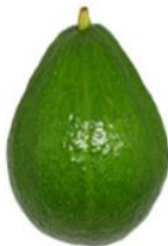
Figura 5 – Cultivar ‘Ouro Verde’; São Gotardo – MG, 2019; Fonte: ABPA

coloração verde escura, de formato ovalado, é considerado grande podendo ir de 600 a 1000 gramas (Figura 5). Tem alto rendimento de polpa, de cor amarela, com sabor semelhante a nozes e poucas fibras e médio teor de óleo. Período de colheita pode ir desde o final de maio a início de setembro (TEIXEIRA, 1991; KOLLER, 2002; ABPA, 2019).