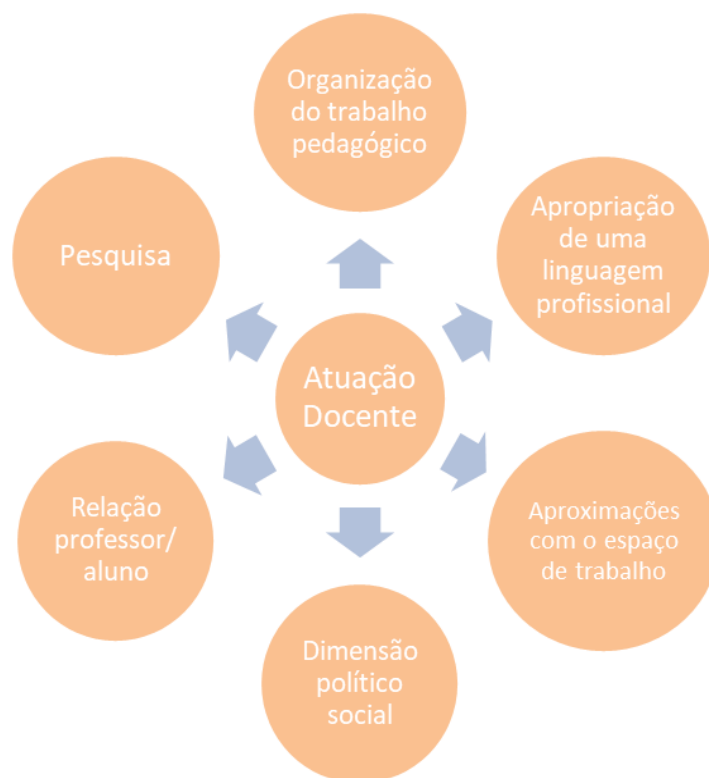
Figura 5 – Atuação Docente