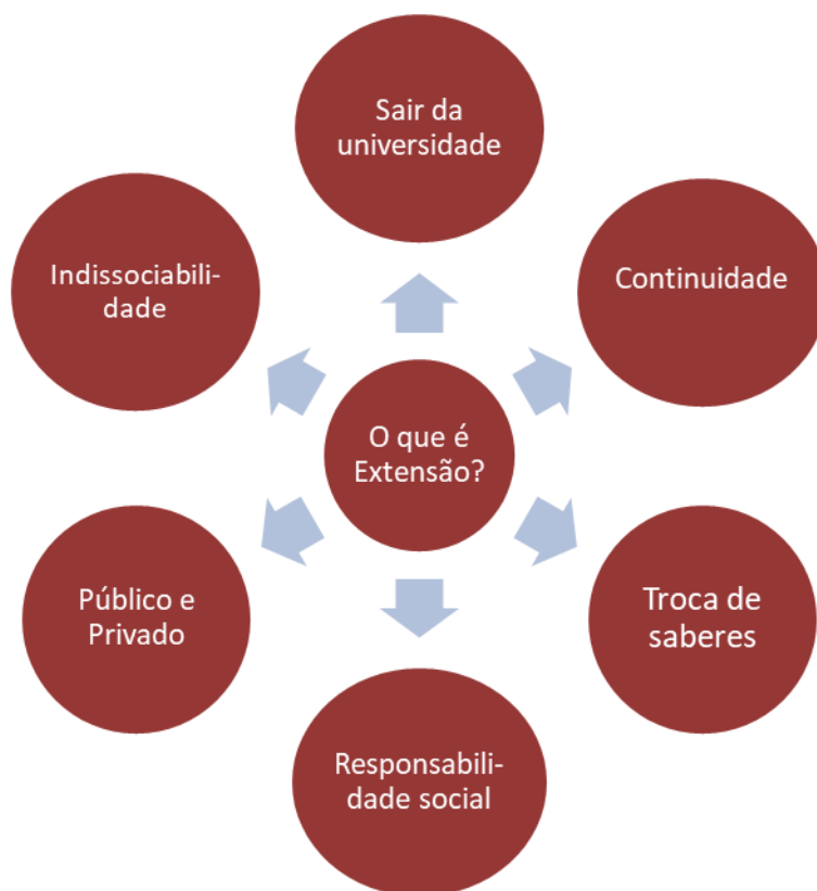
Figura 8 – O que é extensão?

Dos caminhos percorridos até aqui e das ideias que afloraram a partir dos diálogos estabelecidos com os sujeitos que tiveram em suas trajetórias a atividade de extensão como parte constituinte de suas formações acadêmica, chegamos a compreensão de que a busca de uma realidade concreta, por meio da historicidade, totalidade e contradições, pode nos permitir chegar a uma tomada de consciência de forma crítica.