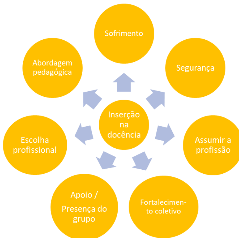
Figura 4 – Inserção na Docência

Estar na condição de iniciante é muitas vezes mergulhar no incerto, se deparar com algo que mesmo sendo conhecido por todo o processo de escolarização vivido, se mostra diferente e desafiador, pois se trata de uma condição nova que pode gerar vários sentimentos, como podemos observar nas falas abaixo.