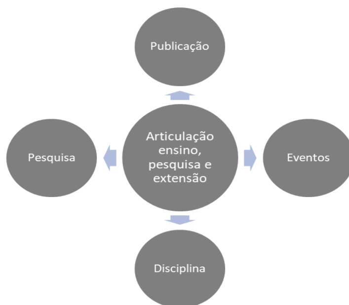
Figura 7 - Articulação Ensino, Pesquisa e Extensão

Compreendemos a extensão a partir de Reis (1996), como processual orgânica, permitindo um processo mutuo de formação, em que, a atividade extensionista retroalimenta a relação estabelecida entre Universidade e comunidade, permitindo que o que é vivenciado em campo gere um espaço de análise, reflexão e construção coletiva, onde o ensino e conseqüentemente a pesquisa, se subsidiam da realidade e a realidade permite que este processo se materialize e se transforme em teoria.