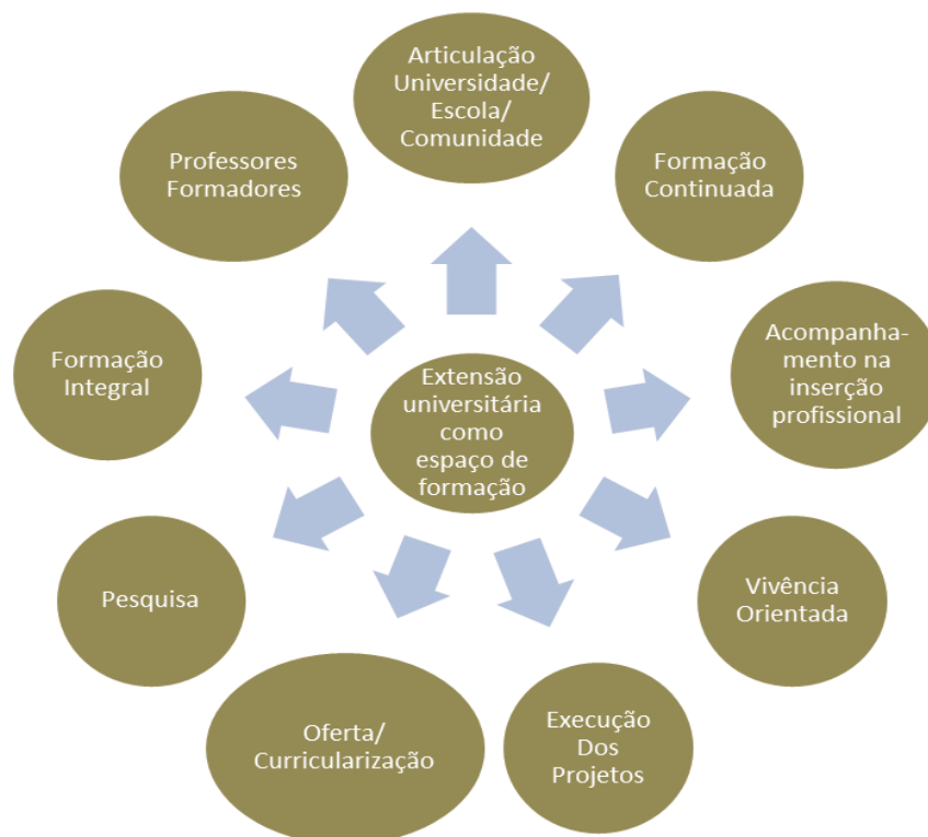
Figura 6 – Extensão universitária como espaço de formação

Partimos do pressuposto de que a extensão universitária se constitui como espaço formativo quando possui uma vertente orgânica-processual, nessa perspectiva é possível dizer que ela se configura como lócus de formação profissional e produção de conhecimento, a partir de uma parceria política-pedagógica entre a tríade universidade, escola e sociedade. Esse núcleo surge a partir de alguns elementos que permeiam os limites, possibilidades e contribuições da extensão para formação e professores, a partir da visão dos professores iniciantes.