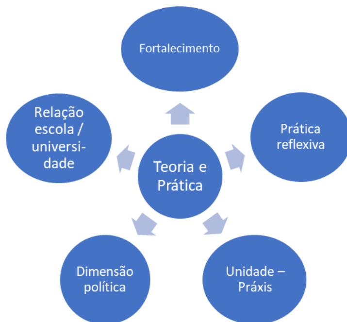
Figura 2 – Teoria e Prática

Pensar em teoria e prática é conceber na formação uma vinculação simultânea e recíproca de duas bases que são autônomas, mas também dependentes, e quando se privilegia uma em detrimento da outra a formação fica incompleta e deficiente. A extensão universitária se apresenta como uma possibilidade dessa articulação, a depender da organização dos projetos e do caminho teórico metodológico adotado.