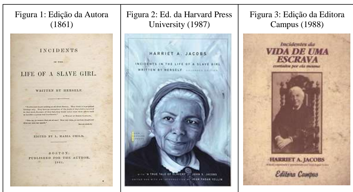
Quadro 2 - Capas das Edições de Incidents

De acordo com Genette (2009), o paratexto apresenta-se como