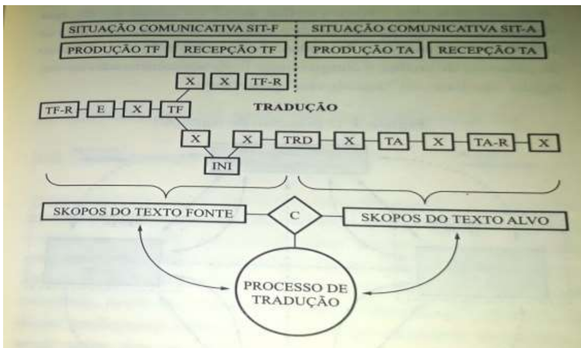
Figura 4. Modelo circular – passos propostos por Christiane Nord (1988, p.71).

Nord opta pelo termo ‘passos’, em vez de ‘fases’, para nomear os variados procedimentos adotados no processo tradutório. O movimento é ‘circular’, uma vez que é possível retornar ao ponto de início ou a qualquer outro ponto, sempre que necessário para se adequar ao que está sendo exigido da função requerida pelo/a iniciador/a.