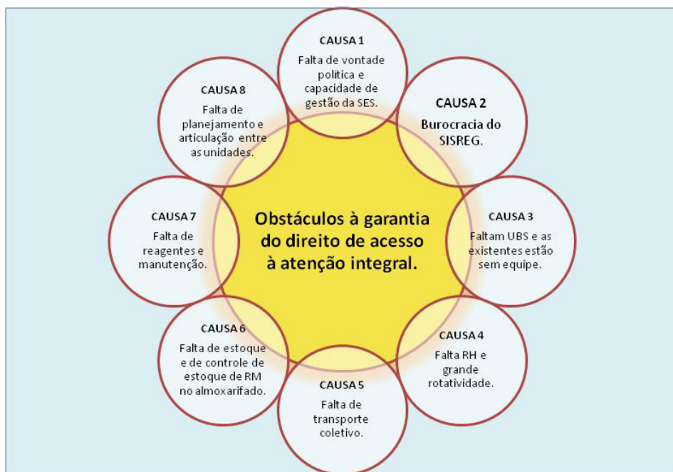
Figura 3: Modelo explicativo do macroproblema 3

Fonte: Plano de Desenvolvimento Institucional do Conselho Regional de Saúde do Paranoá 2010-2011.