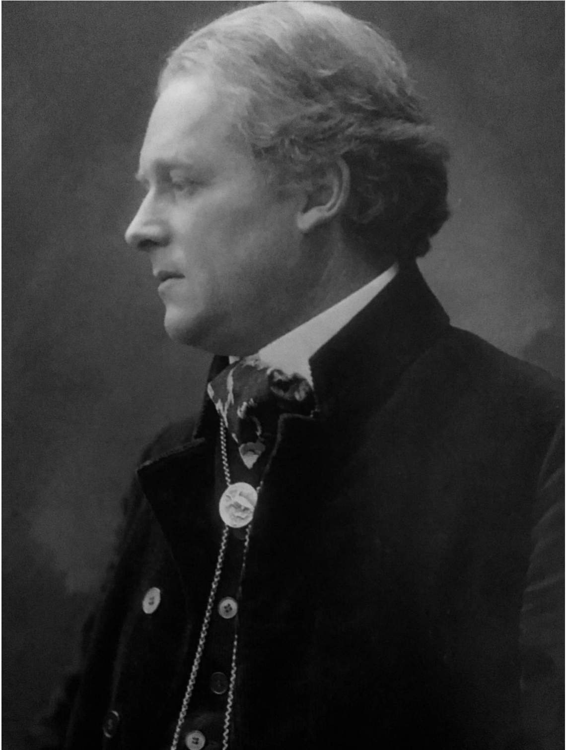
Figura 5: Friedrich Wolters, 1927.