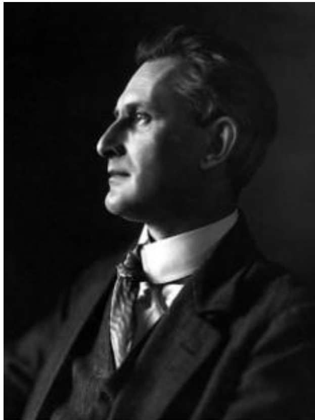
Figura 2: Friedrich Gundolf, 1930.