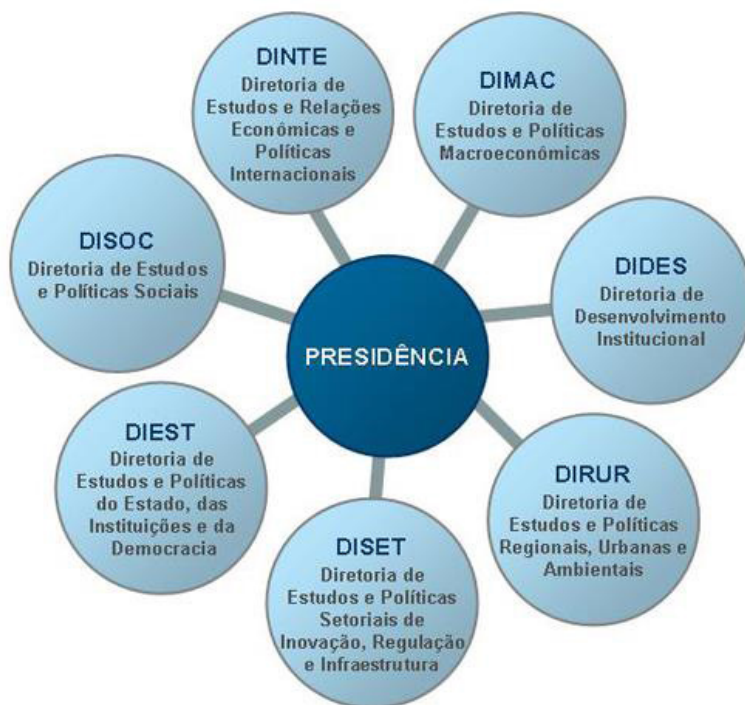
Figura 1: Organograma Institucional do Ipea

Por vezes, a referida ausência de processos assume a versão de uma instituição pouco hierárquica. O organograma abaixo, que pretende representar a estrutura organizacional do Instituto, expressa um tipo de organização em que as diretorias orbitam em torno da presidência, mas em situação de igualdade, nos remetendo a uma forma institucional que valoriza a colaboração entre as partes e se distancia de uma representação hierárquica. Na linguagem da gestão, é um organograma denominado radial ou solar, associado a instituições modernas que buscam incentivar o trabalho coletivo horizontalizado.