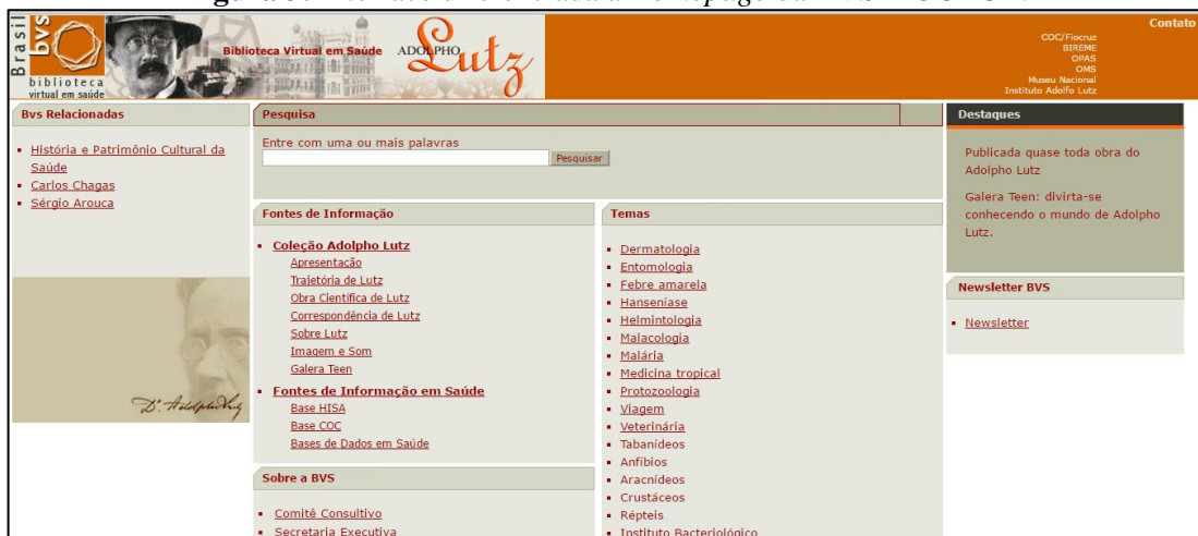
Figura 3: Interface diferenciada à Homepage da BVS FIOCRUZ.

Entretanto, foram identificados problemas quanto as Diferenças nas Perspectivas pela existência de apresentações (interfaces) diversas entre as BV conforme o enfoque de cada espaço digital, sendo as mais próximas do modelo institucional: aleitamento materno; bioética e diplomacia; determinantes sociais em saúde; integralidade em saúde; e saúde pública.