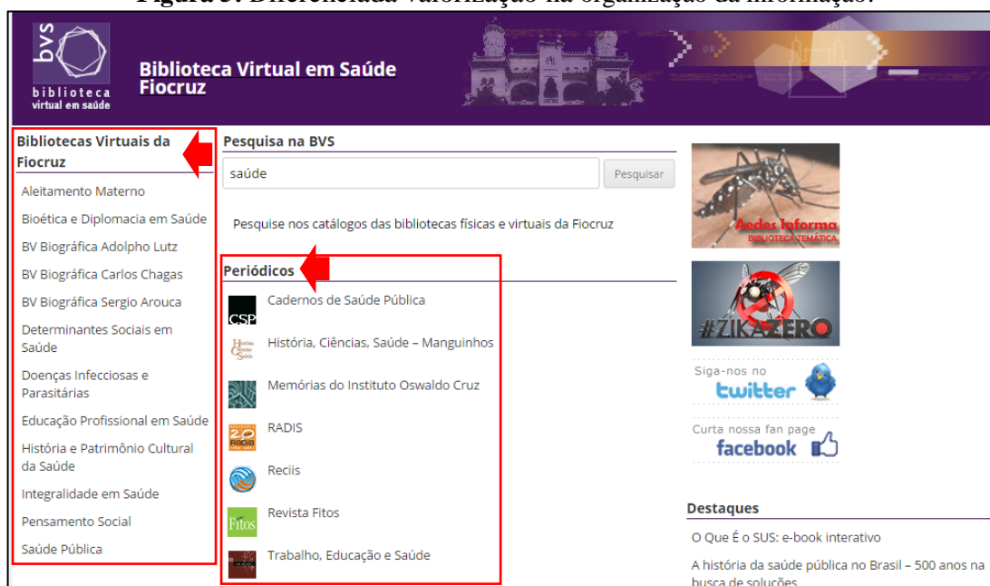
Figura 5: Diferenciada valorização na organização da informação.

Surge a impressão de que as informações referentes aos “temas” e à “literatura científica e técnica” são valorizadas por algumas BV em relação a outras, como: aleitamento materno (figura 4); Adolpho Lutz; Carlos Chagas; doenças infecciosas e parasitárias; educação profissional em saúde; e saúde pública. Ainda, vale mencionar que o portal (figura 5) pode apresentar, ou não, uma diferenciada valorização entre alguns itens, como é o caso do elemento “periódicos” (faixa central), não situado na mesma faixa das “BV da FIOCRUZ”.