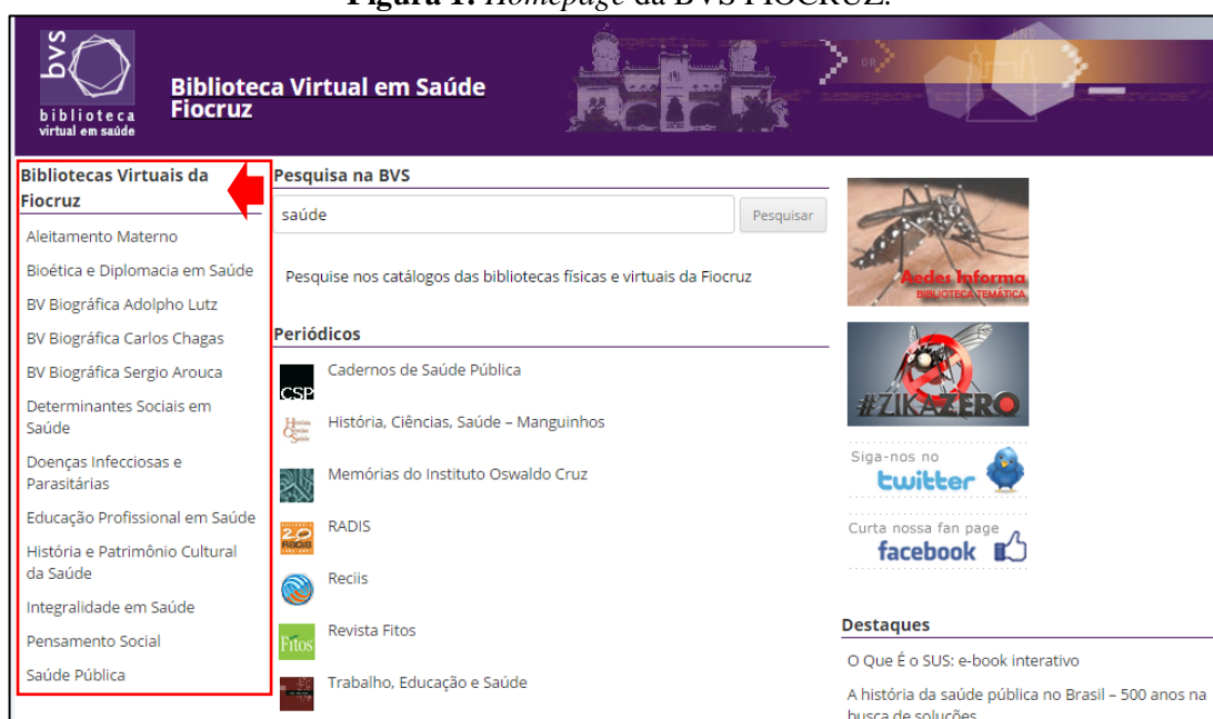
Figura 1: Homepage da BVS FIOCRUZ.

[...] é uma rede de gestão da informação, intercâmbio de conhecimento e evidência científica em saúde, que se estabelece por meio da cooperação entre instituições e profissionais na produção, intermediação e uso das fontes de informação científica em saúde, em acesso aberto e universal na Web.