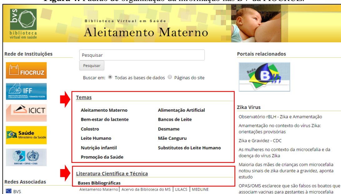
Figura 4: Padrão de organização da informação nas BV da FIOCRUZ.