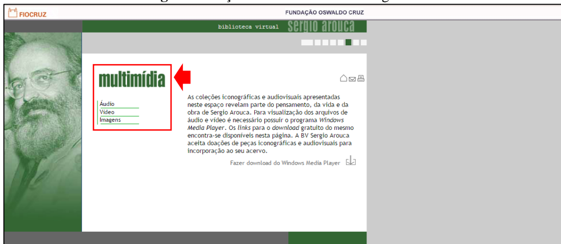
Figura 2: Seção multimídia não heterogênea.