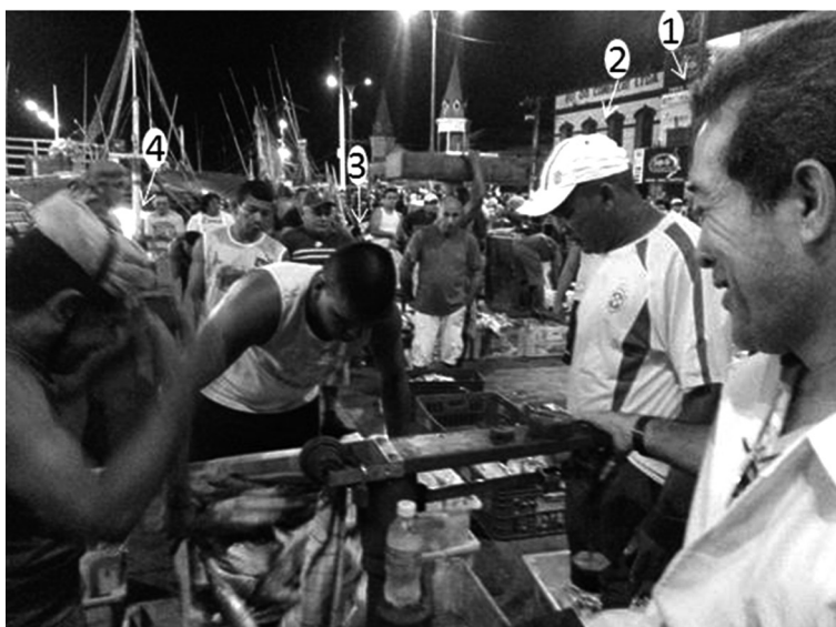
Figura 2. O momento da transação comercial. Destaque para (1) Balanceiro; (2) Comprador, (3) Virador e (4) Carregador

O fluxo comercial deste produto vendido deverá prosseguir durante o dia, quando, por