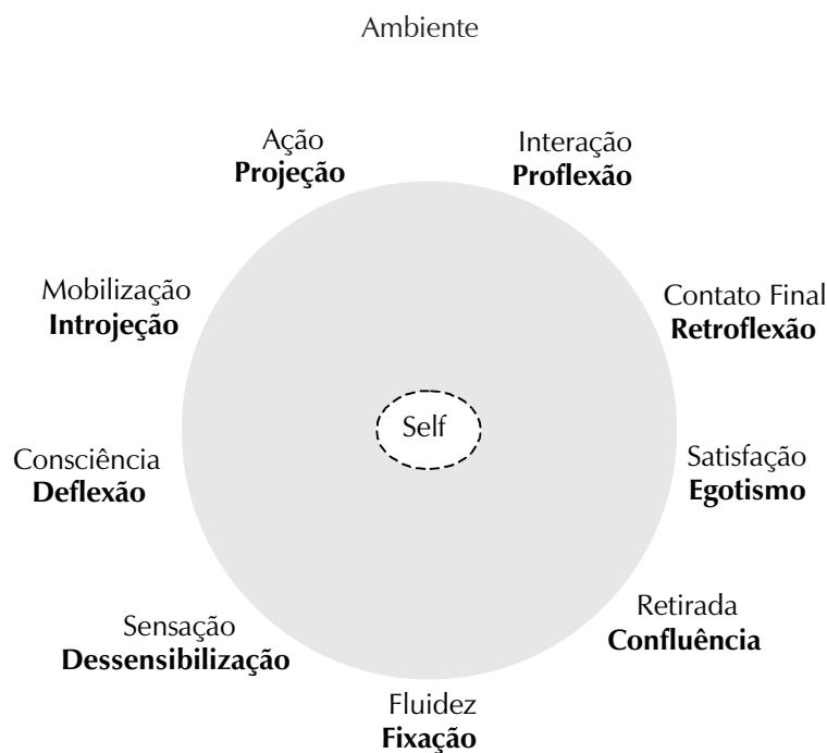
Figura 1: Ciclo dos fatores de cura e bloqueio do contato

Partindo para elucidar como o TDAH se mostra na dimensão intrapsíquica da criança, estabelecemos, em nossa pesquisa, uma correlação entre os mecanismos psicológicos da GT, a análise interpretativa do Teste de Apercepção Temática – figura de animais (CAT-A) e as principais categorias obtidas da análise de conteúdo do discurso das professoras e dos pais.